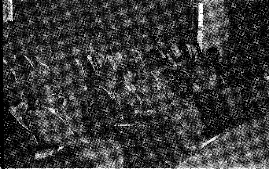
Sempozyuma teşrif eden dinleyicilerden bir kesit.