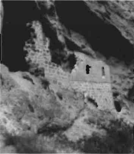
Resim 3 : Odalar Manastırı'ndan harap olan giriş bölümü