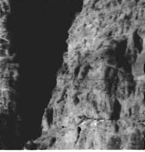
Resim 1 : Odalar Manastırı'ndan genel bir görünüm