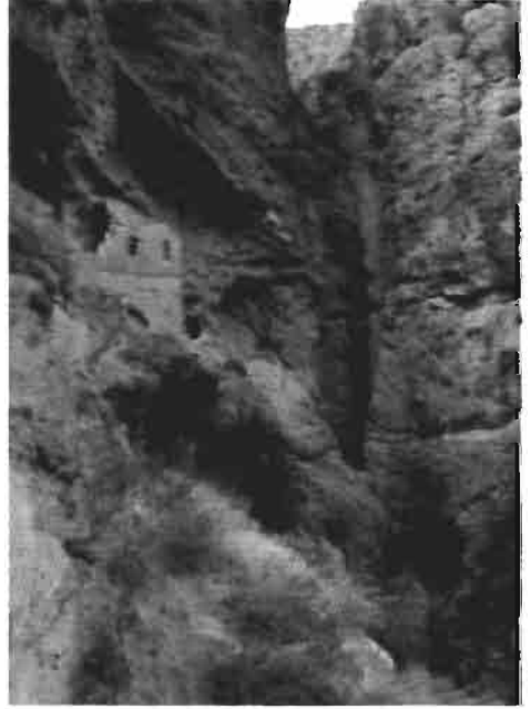
Resim 2 : Odalar Manastırı'nda Kilisenin güncü cephesi