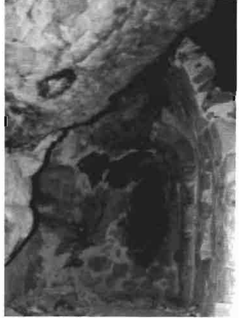
Resim 4 : Odalar Manastırı kilisenin apsisi