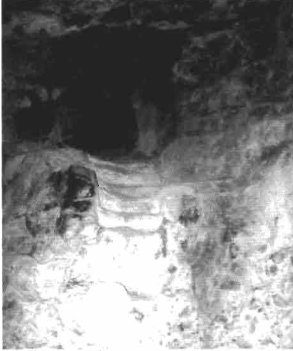
Resim 6 : Odalar Manastırı'nda mezar odasına geçişi sağlayan merdiven basamakları ve giriş