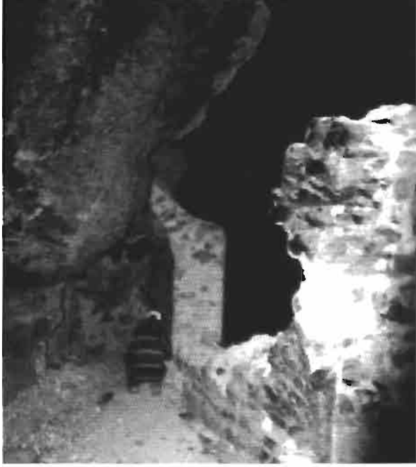
Resim 5 : Odalar Manastırı'nda türü anlaşılmayan yapı izleri