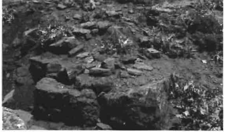
Resim 5 : Kale girişinin doğu kısmı