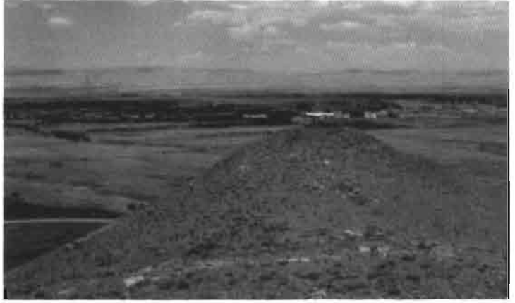
Resim 2 : Kalenin güneyden görünüşü