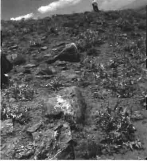
Resim 4 : Kalcın güneydoğu köşesinin temel kalıntıları