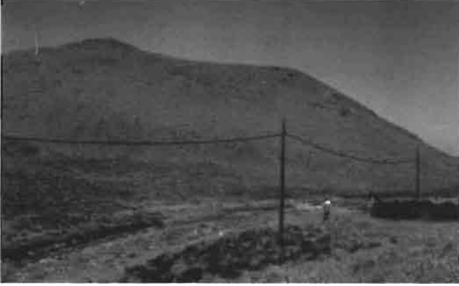
Resim 1 : Kalenin Doğudan Görünüşü