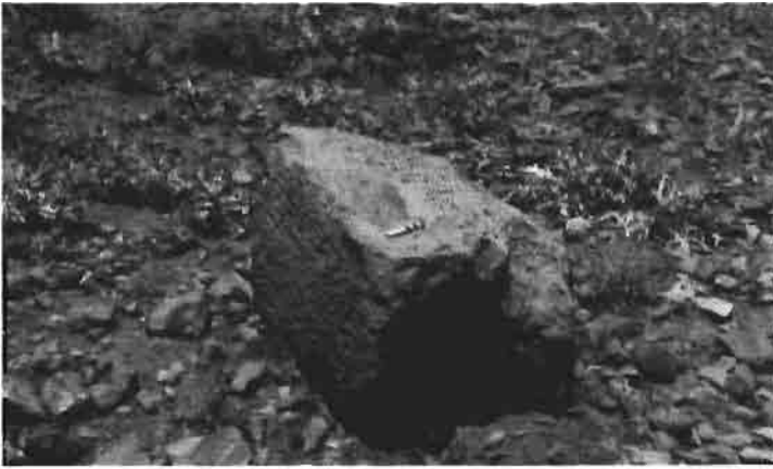
Resim 3 : Bazalt blok taş