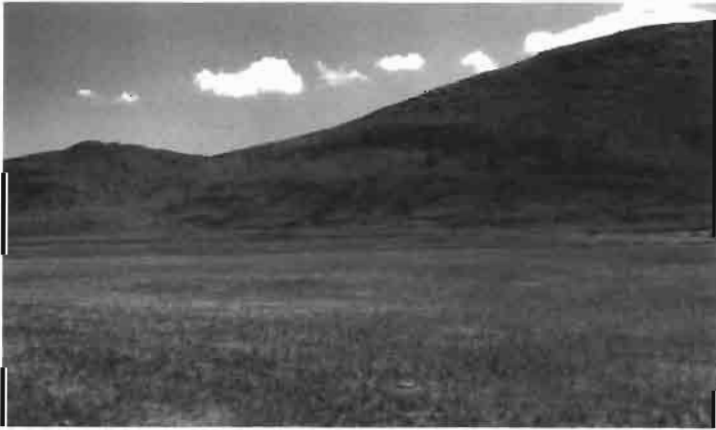
Resim 6 : Batıdan kaleye girişi sağlayan antik yol