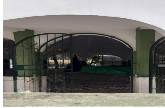
Foto 7. Muğdat Dede Türbesi