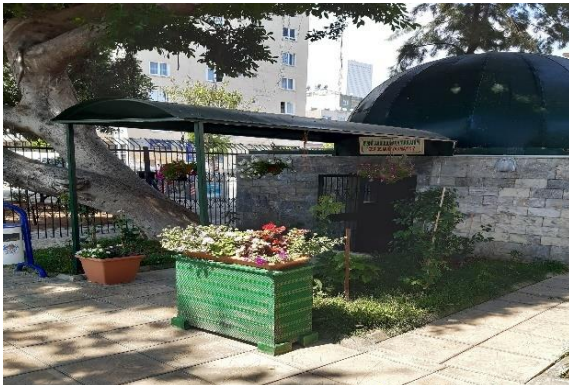
Foto 5. Şih Muhammed Abbari Türbesi

Ziyaretçi profili çoğunlukla 40 yaş ve üzeri kadınlardan oluşmaktadır. Genellikle Arap Alevi vatandaşlar tarafından ziyaret edilmekte olup ziyaretçilerin eğitim durumları ve ekonomik durumları çeşitlilik göstermektedir. (K11, K12, K13, K14). Türbe'yi bilerek ziyarete gelenler olmakla birlikte cadde üzerinde olması nedeniyle daha çok yoldan geçenler tarafından saygı amacıyla ziyaret edilmektedir (K11).