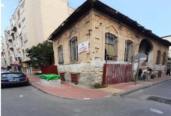
Foto 3. Şih Salih Makamı

Türbenin Ziyaret pratikleri (ritüelleri); Türbe her türlü dilek sahibi tarafından ziyaret edilmektedir. Ziyaretin özel bir günü ya da saati bulunmamakla birlikte cuma günleri daha çok ziyaretçisi çekmektedir (K7, K10). Ziyaretçiler makamda buhur yakmak, makama el yüz sürmek, makamı öpmek, dua etmek, çuha adı verdikleri yeşil örtüden parça kesmek gibi uygulamalar gerçekleştirmektedirler. Yeşil örtüden kesilen parçaları bolluk getirmesine inananlar, cüzdanlarında taşımaktadırlar. Makam başında Allah’tan hayırlı kısmet dileyen ve adak adayan genç kızlar, dilekleri gerçekleştiği zaman adaklarını yerine getirdikten sonra, yeşil örtüden parça kesip çeyiz sandıklarında saklamaktadırlar (K7, K8, K11). Makamda gelir durumlarıyla orantılı olarak kanlı adak da adanmaktadır. Dileğin gerçekleşmesi durumunda adaklık hayvanları parça et ya da yemek olarak ihtiyaç sahiplerine dağıtılmaktadır. Ziyaretçi profili çoğunlukla 40 yaş ve üzeri kadınlardan oluşmaktadır. Ziyarete gelenlerin sayısı gün geçtikçe azalmaktadır. Gençler ziyaret inancını eskisi kadar benimsememektedir (K7, K9, K10, K11). Çoğunlukla Arap Alevi vatandaşlar tarafından ziyaret edilen makama gelen ziyaretçilerin eğitim durumları ve ekonomik durumları çeşitlilik göstermektedir. (K11, K12, K13, K14). Makamı bilerek ziyarete gelenler dışında kaldırım üzerinde olması nedeniyle yoldan geçenler tarafından da ziyaret edilmektedir (K11). Yoldan geçenlerin makam başında dua okudukları gözlemlenmiştir (K10)