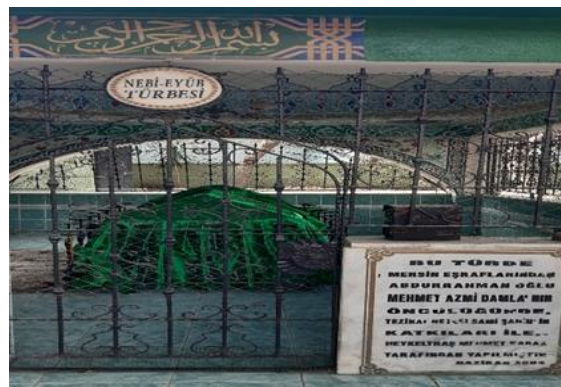
Foto 2. Nebi Eyüp Türbesi