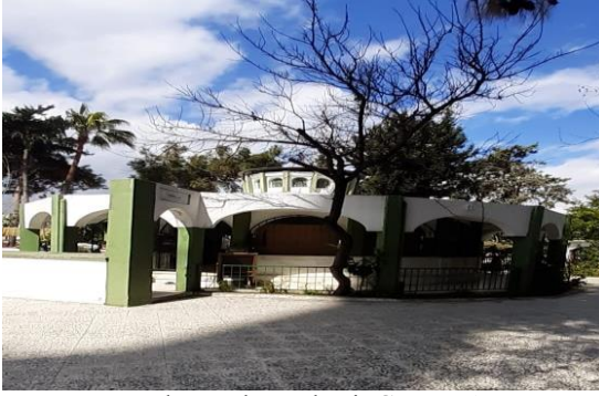
Foto 7. Muğdat Dede Türbesi

Her yaşta ziyaretçisi bulunan Türbe, daha çok kadınlar tarafından ziyaret edilmektedir (K17, K18, K20). Her tür mezhebe mensup vatandaşlar tarafından ziyaret edilen makamın ziyaretçilerinde eğitim durumu ve ekonomik durum çeşitlilik göstermektedir. Türbe'ye özellikle ziyaret amacıyla gelenler olmakla birlikte yanı başında adını verdiği camiden çıkanlar tarafından da oldukça fazla ziyaretçisi bulunmaktadır (K16). Türbe, bulunduğu çevrenin yanı sıra tüm il genelinden, başka kentlerden ve yurt dışından da ziyaretçi çekmektedir (K16, K18, K19, K20).