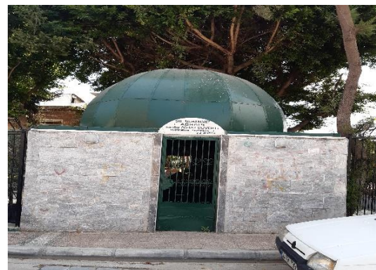
Foto 6. Şih Muhammed Abbari Türbesi