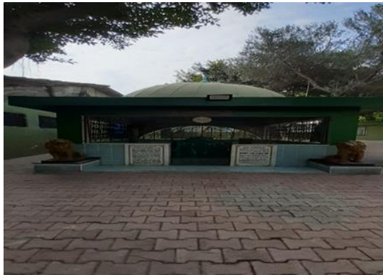
Foto 1. Nebi Eyüp Türbesi