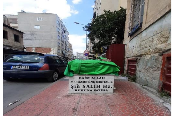
Foto 4. Şih Salih Makamı