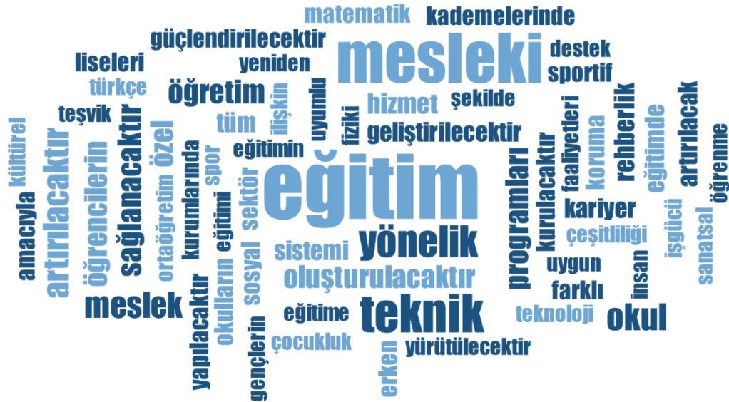
Şekil 1: MEB'e Düşen Görevlere İlişkin Kelime Bulutu

Araştırmanın ilk sorusunun yanıtlanması için politik görevler tespit edilmiştir. İncelemeler sonucunda XI. Kalkınma Planı'nda MEB' düşen pek çok politik görevin bulunduğu görülmüştür. Görevlerin ön görünümünü yansıtmak için kelime bulutu kullanılmıştır. Kelime bulutu incelendiğinde XI. Kalkınma Planı'nda düzenlemelere, mesleki eğitime, öğretime dönük ifadelerin ön planda olduğu görülmektedir (Şekil 1).