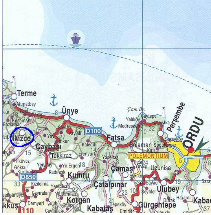
Harita: 1- Ordu/İkizce Haritası