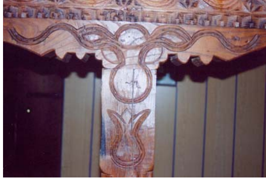
Resim: 14- Ordu/İkizce Laleli (Eski) Camii'nin Kadınlar Mahfili Süslemelerinden