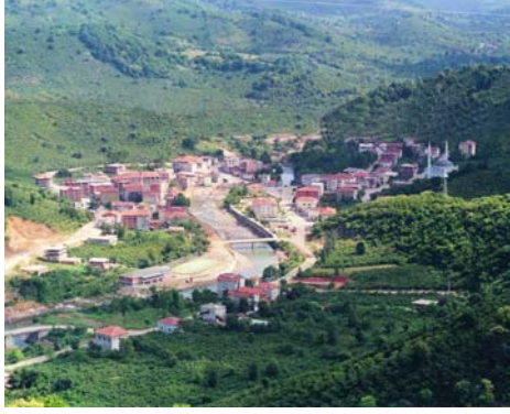
Resim: 1- İkizce İlçesinin Genel Görünüşü