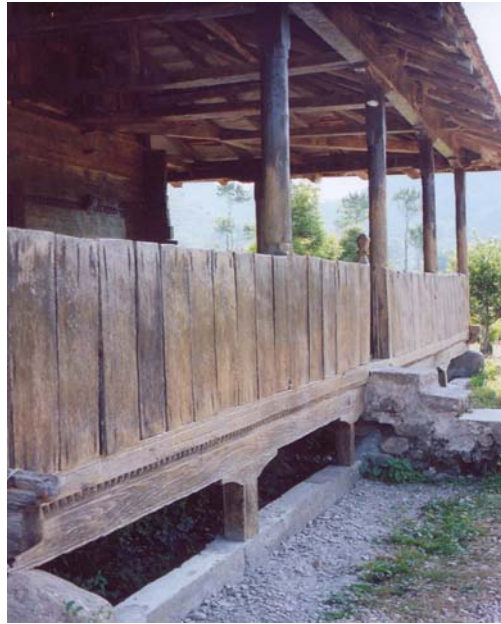
Resim: 4- Ordu/İkizce Laleli (Eski) Camii'nin Kuzey Cephesi