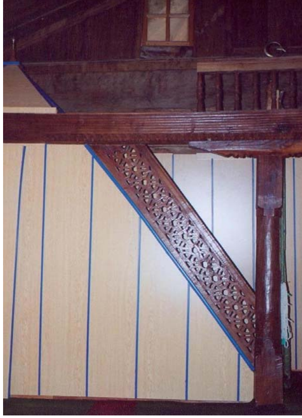
Resim: 17- Ordu/İkizce Laleli (Eski) Camii'nin Minberi