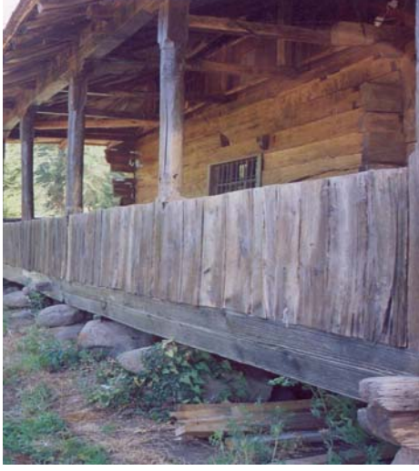
Resim: 5- Ordu/İkizce Laleli (Eski) Camii'nin Doğu Cephesi