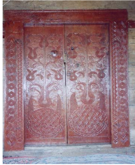
Resim: 12- Ordu/İkizce Laleli (Eski) Camii'nin Giriş Kapısı