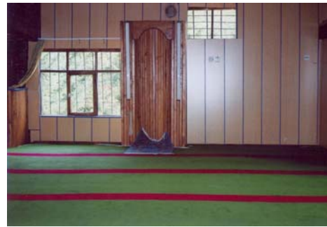
Resim: 16- Ordu/İkizce Laleli (Eski) Camii'nin Mihrabı