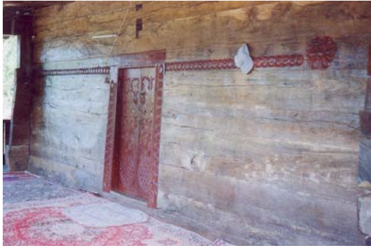
Resim: 11- Ordu/İkizce Laleli (Eski) Camii'nin Giriş Cephesi