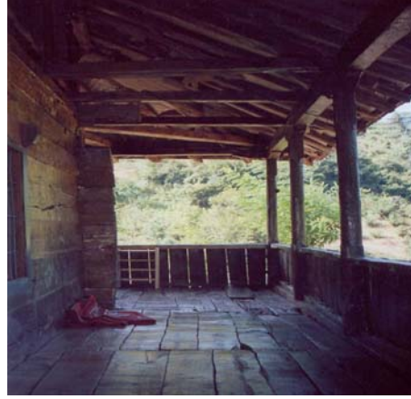
Resim: 10- Ordu/İkizce Laleli (Eski) Camii'nin Doğu Revakı