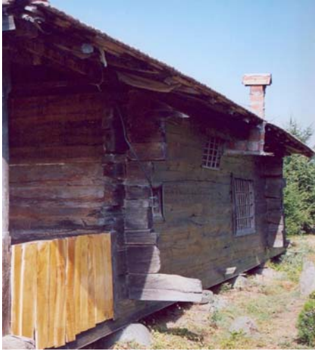
Resim: 7- Ordu/İkizce Laleli (Eski) Camii'nin Güney Cephesi