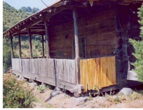
Resim: 6- Ordu/İkizce Laleli (Eski) Camii'nin Batı Cephesi