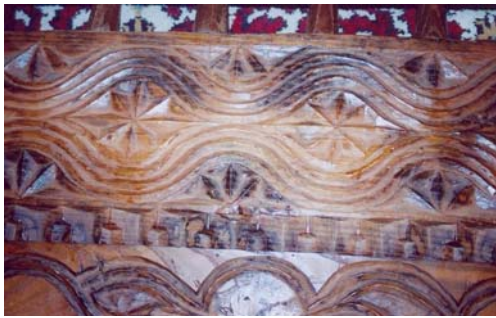
Resim: 15- Ordu/İkizce Laleli (Eski) Camii'nin Kadınlar Mahfili Süslemelerinden