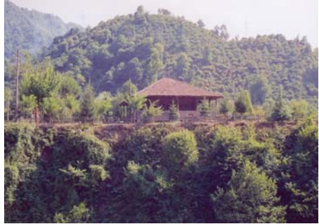
Resim: 3- Ordu/İkizce Laleli (Eski) Camii'nin Genel Görünüşü