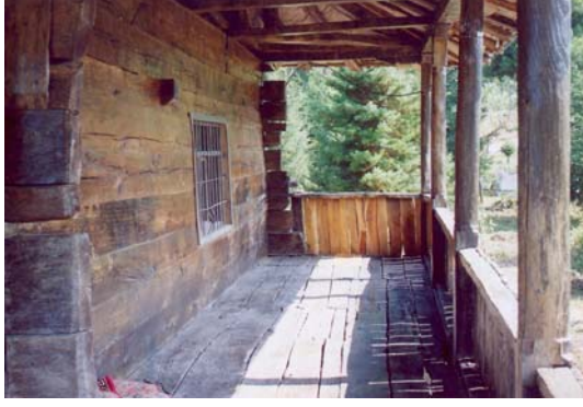
Resim: 9- Ordu/İkizce Laleli (Eski) Camii'nin Batı Revakı