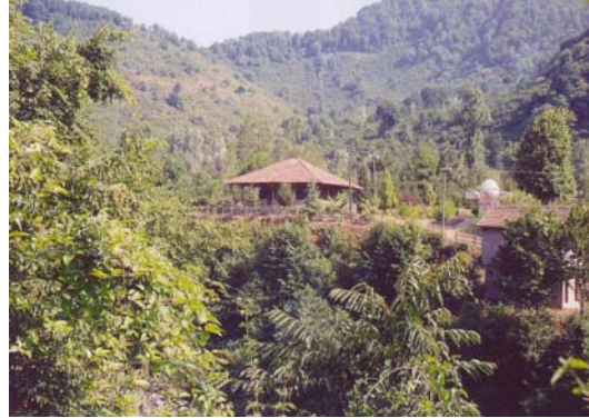
Resim: 2- Ordu/İkizce Laleli (Eski) Camii'nin Genel Görünüşü