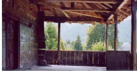
Resim: 8- Ordu/İkizce Laleli (Eski) Camii'nin Kuzey Revaki