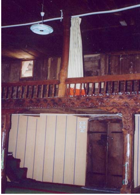
Resim: 13- Ordu/İkizce Laleli (Eski) Camii'nin Kadınlar Mahfili