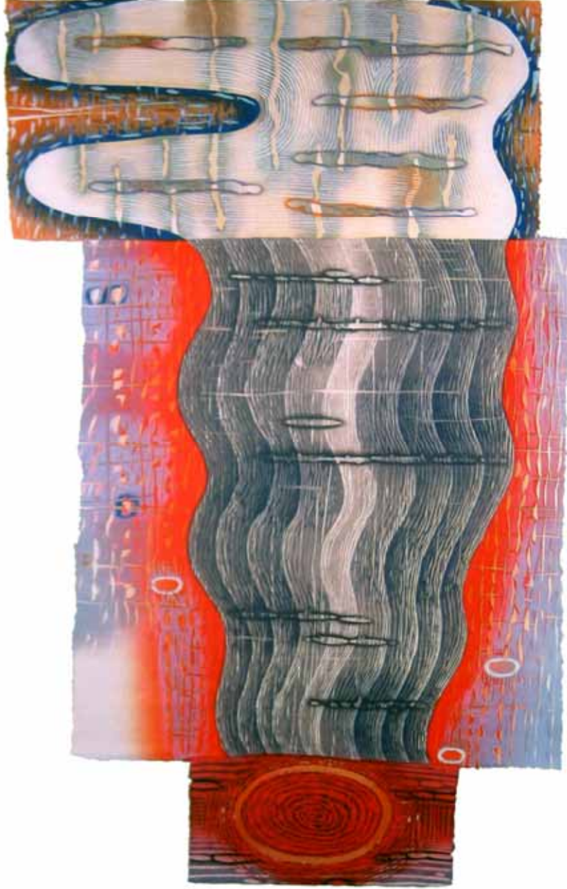
Foto 3. Karen Kunc, Gök Gürültülü Akıl, 1999, ağaç baskı, 106 x 58 cm