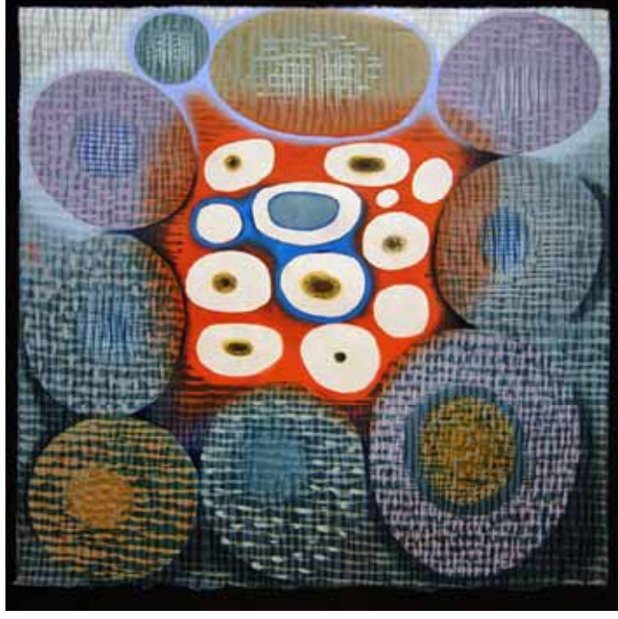
Foto 4. Karen Kunc, Bir Gökçisminin Teması, 2008, ağaçbaskı, 45x45cm