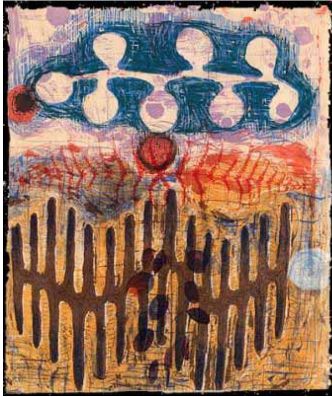
Foto 2. Karen Kunc, Eğreltiotu Yaprağı, 2000, Kitakata üzerine vitrografi, 52cm x 42.5cm