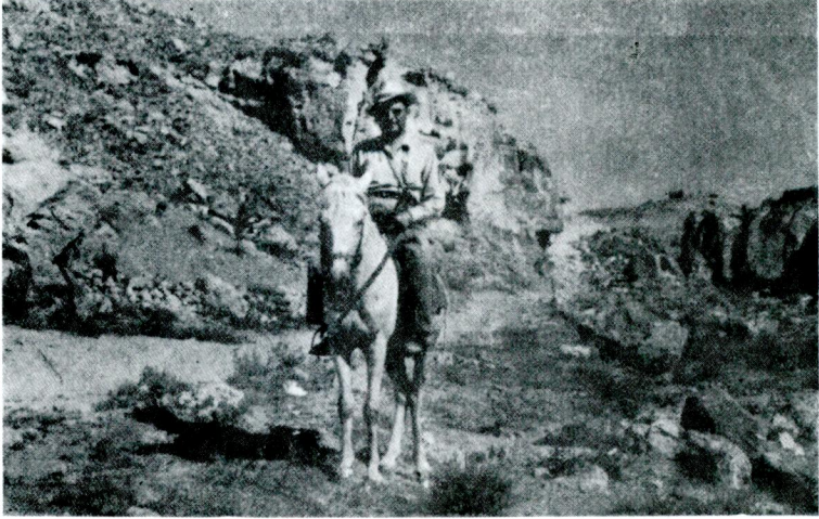
Muzaffer Şenyürek kazı çevresinde bir gezi sırasında