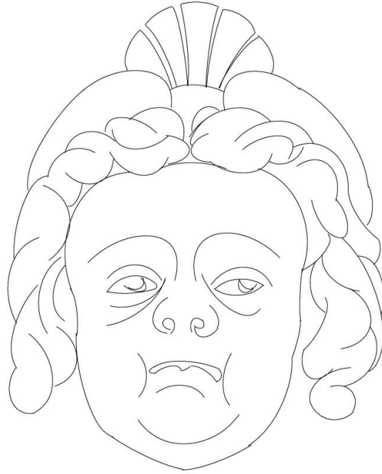
Çizim 3 Çiçek Pasajı masklarından.