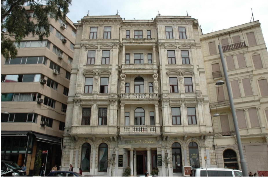
Foto. 9 Büyük Londra Oteli'nden görünüm.