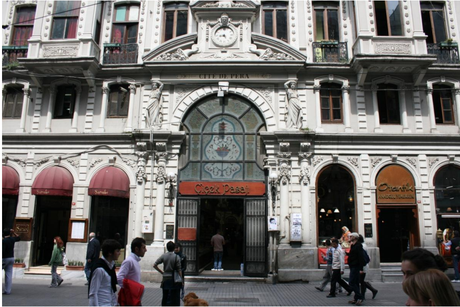
Foto. 2 Çiçek Pasajı giriş kapısından görünüm.