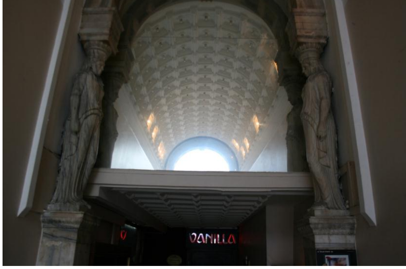
Foto. 11 Alkazar Sineması karyatitlerinden görünüm.