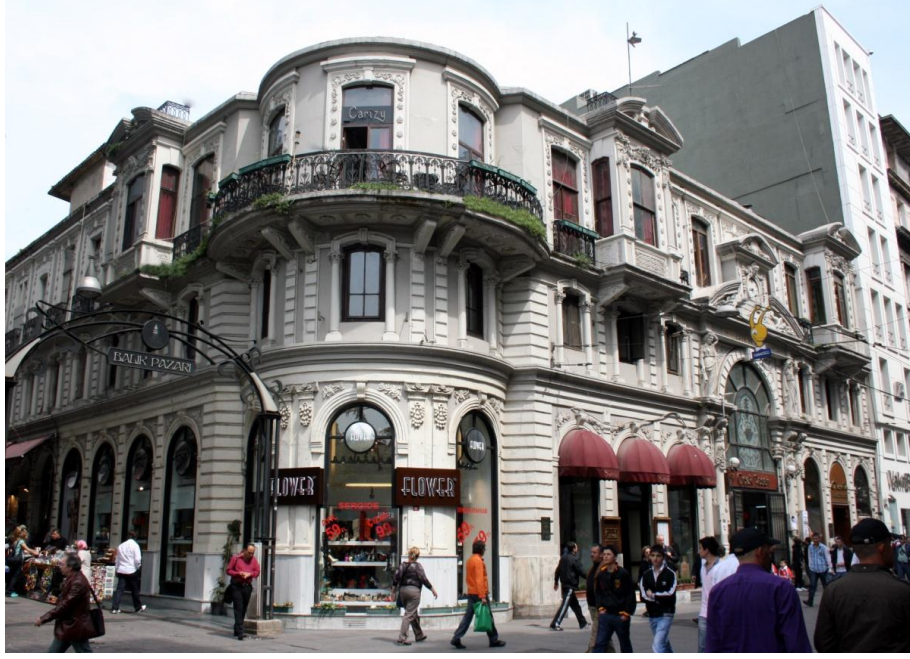
Foto. 1 Çiçek Pasajı'ndan genel görünüm.