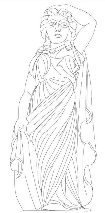
Çizim 2 Çiçek Pasajı karyatitlerinden.