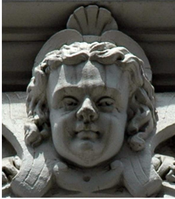
Foto. 8 Çiçek Pasajı masklarından ayrıntılı görünüm.