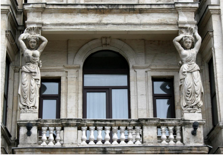
Foto. 10 Büyük Londra Oteli karyatitlerinden görünüm.