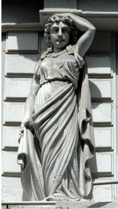
Foto. 6 Çiçek Pasajı karyatitlerinden görünüm.