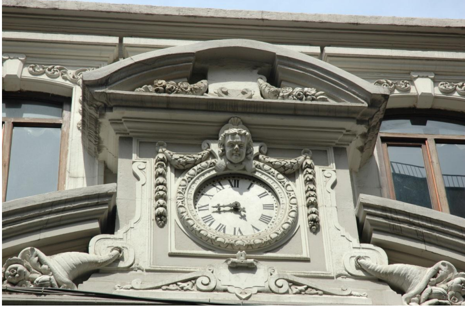
Foto. 7 Çiçek Pasajı masklarından görünüm.