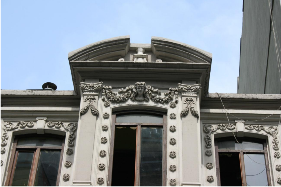
Foto. 4 Çiçek Pasajı süslemelerinden görünüm.