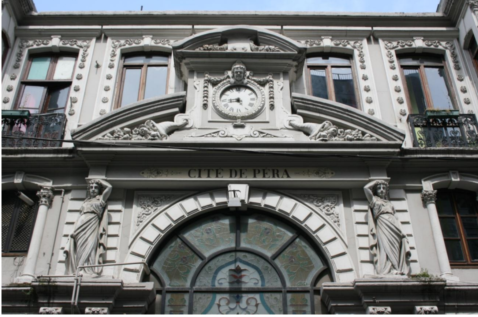
Foto. 3 Çiçek Pasajı süslemelerinden görünüm.