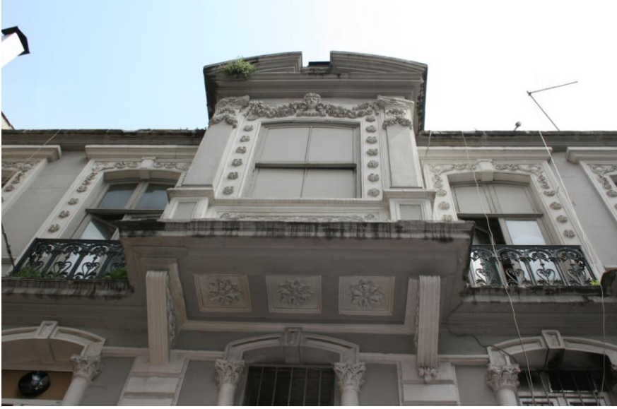
Foto. 5 Çiçek Pasajı kuzey cepheden görünüm.