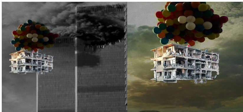
Görsel 4. Tammam Azzam, Bon Voyage:New York, 2013.

Tammam Azzam, ülkesindeki çatışmalar ve savaştan dolayı ülkesini terk etmek zorunda kalarak önce Dubai'ye oradan da Almanya'ya göç etmiş bir Suriye yakın dönem sanatçısıdır. Azzam, hibrit bir sanat anlayışına sahip olmakla beraber melez bir form inşa etmiştir. Bundan dolayı yakın dönem çalışmalarında, ülkesindeki politik ve toplumsal karışıklıkları ve Suriye'yi büyük yıkımlara götüren şiddet sarmalını araştırmak amaçlı dijital medya ve sanat tarihinde yer alan önemli çalışmalardan referanslar bulunmaktadır. Azzam, global ikonografiden (medyalaştırılmış görseller, sanat tarihine referanslar vb.) alıntılar yaparak veya esinlenerek dijital biçimlerini sosyal bağlantılarla sistemli bir şekilde paylaşmaktadır. Sanatçının Suriye Müzesinde yer alan çalışmaları, Suriye gerçekliğini kıyaslamakta, güncel gelişmelere veya konulara ilgiyi, anlayışı ve görünümü analiz etmekte ve sanatın sorgulayıcı özelliđini ortaya koymaktadır ( https://en.syriaartasso.com/artists/tammam-azzam/ ).