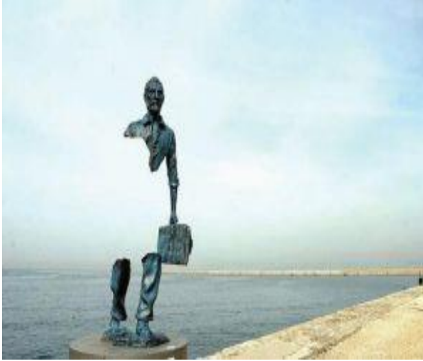
Görsel 6: Bruno Catalano, 2013, Marsilya, Fransa, Gezinler serisinden