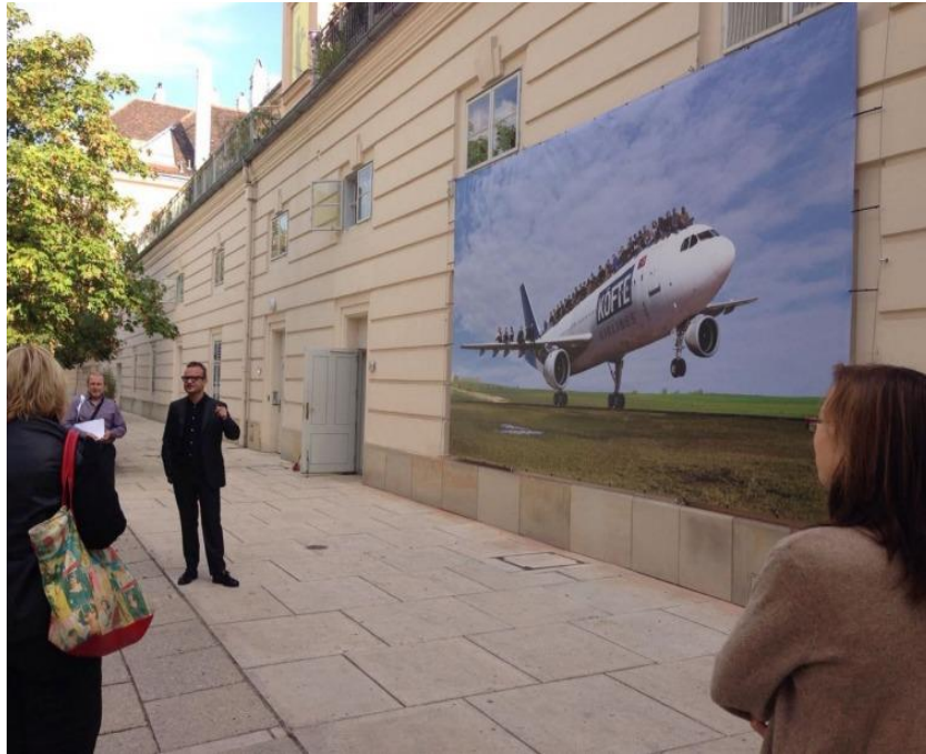
Görsel 1. Halil Altındere, Köfte Airlines, Viyana, 2016, Fotomontaj.

Sergide yer alan "Köfte Airlines" çalışmasında Altındere, İstanbul-Tekirdağ yolu güzergahında yer alan bir uçak restoranı mekan olarak kullanmıştır. Altındere daha önceden görüştüğü 45 mülteciyi, restoran formuna dönüştürülmüş bir uçağın gövdesinin üstüne konumlandırarak fotoğraflamıştır (Hanson, M. 2018). Çalışmada Altındere, günümüz sanat pratikleri anlayışıyla uyumlu olarak, ne ile yapıldığının değil neden yapıldığı ve hangi önemli sosyal mesajı, mantığı içinde barındırdığı vurgusunu öne çıkaran bir sanatsal pratikle göç ve göçmen sorunsalını gözler önüne sermeyi amaçlamıştır (Çeber, 2018; Elmas & Erikan, 2022).