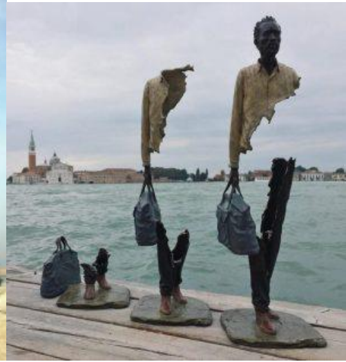
Görsel 7: Bruno Catalano, 2013, Parçalar, Venedik.