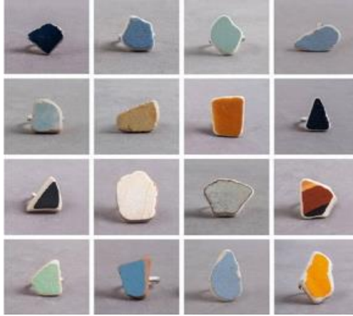
Görsel 13: Constriction Waste , Noga Berman, 2012

Noga Berman da seramik atıkları en minimal hali ile takıya uyarlayan isimlerden biridir. İsrail sokaklarından topladığı atık seramik parçalarını en yalın hali ile kullanan sanatçı 'Constriction Waste' adlı yüzük serisi yapmıştır.