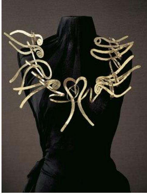
Görsel 3 : 'Arp ve kalp', Alexander Calder, 1937

Calder'in basit malzemelerle yapmış olduğu takılar bu güne kadar ulaşmış ve üzerinde tartışılan birer sanat eseri olmuşlardır.