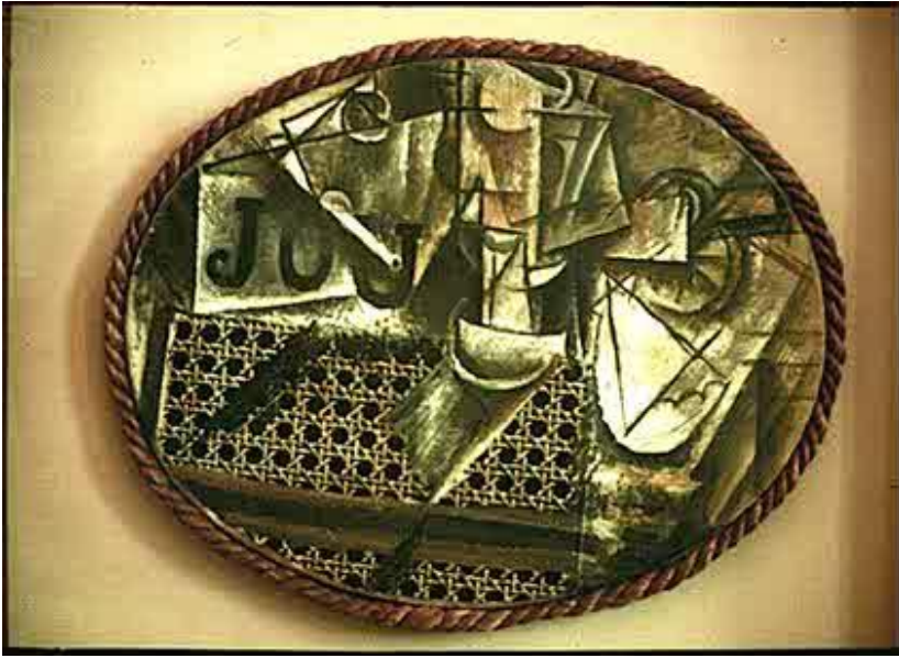
Görsel 4: Hazır İskemleli Natürmort

20. yy da sanatta sıkça karşılaştığımız atık nesnelerin kullanımı Kübizm öncülerinden Picasso ile başlayıp Dadaizm ile birlikte farklı bir boyut kazanarak devam etmektedir. Postmodern bir söyleme sahip Andy Warhol ile çağdaş bir yorum kazanmaktadır. 1912 yılında Picasso tarafından yapılan ‘Hazır İskemleli Natürmort’ adlı çalışma atık malzeme ile yapılmış sanata verilebilecek iyi örneklerdendir. Çalışmada atık hasır parçası ve halat kullanılmıştır. ‘Bu çalışma sanat dışı malzemenin kullanıldığı ilk yapıt olarak gösterilmektedir’(Kaptı, 2005:3)