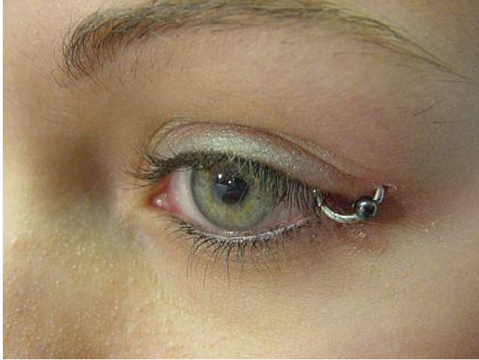
Görsel 1: Göze Takılan Takı Örneği

‘Takı “takmak” fiilinin kökünden türemiş bir kelimedir. Ziyet eşyası, mücevher diye adlandırdığımız takılar; metal, değerli ve yarı değerli taşlar, süs taşları, tahta, cam, seramik, toprak, kemik, fildişi, deri v.b. gibi maddelerden yapılan insanların baş, kulak, burun, dudak, boyun, gövde, kol, parmak, bel ve ayak bileği gibi vücudun belirli bölümlerine taktıkları süs eşyalarıdır’(Özdemir ve Dudaş, 2013:2). Ancak bu tanım günümüzde eksik olarak kalabilir çünkü takıyı takmak için tanımlanmış bir alana ihtiyaç yoktur. Buna örnek olarak vücudun her yerine takılabilen ‘piercingler’ verilebilir.