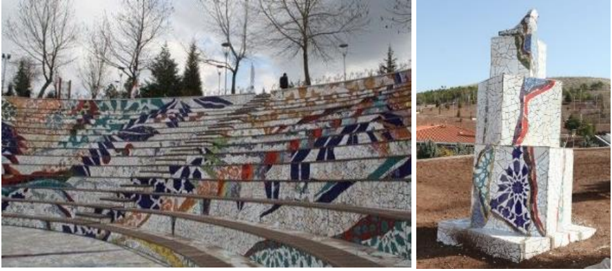
Görsel 10: Seramik Park Eskişehir 2014

( http://sanatsayfasi.com/haberler/eskisehir-cagdas-seramik-acik-hava-muzesi-aciliyor )