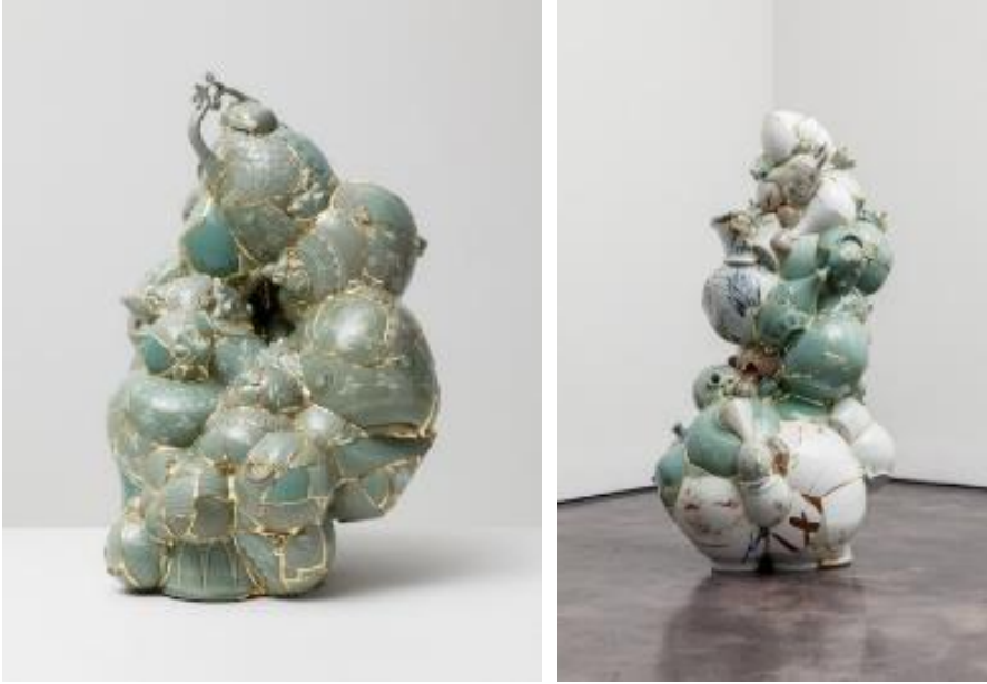
Görsel 6: Dönüşmüş Vazolar, Yeessookyung, 2013

olarak adlandırılabilir. Bu atık seramikler kimi zaman onarılarak kimi zamanda bambaşka bir nesneye dönüştürülerek yeni bir yorum kazanırlar. Bu bağlamda eserler üreten sanatçılardan 1947 Kore doğumlu Yeessookyung ‘biyomorfik mutant heykel’ olarak adlandırdığı çalışmalarında kırık seramik parçaları kullanmıştır. ‘Seramik parçalarından yaptığı ilk çalışma 2001 yılında İtalya’daki bir bienalde sergilenmiştir’ 7 Eserlerinde kırık seramik parçalarının dışında epoksi ve altın kullanmaktadır.