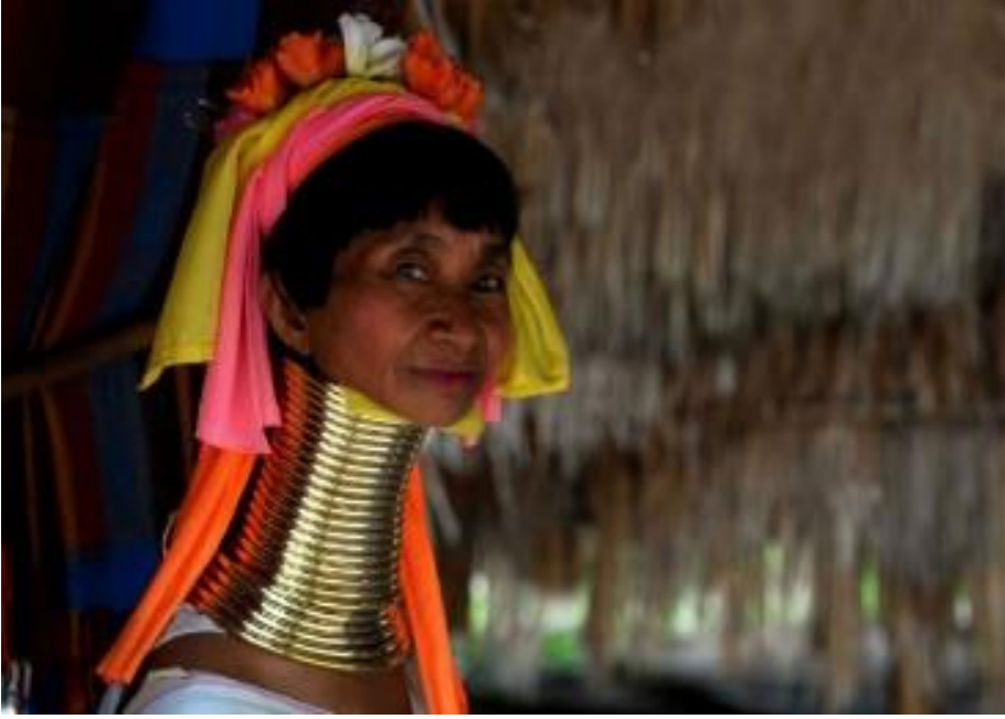
Görsel 2: Afrika Takı Geleneği

http://blog.mizu.com/taki/takilar-ve-kulturlere-gore.html