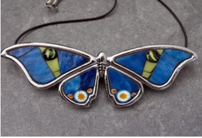
Görsel 12: Blue Morpho , Eve Lynch, 2011

http://www.behance.net/gallery/Mosaic-Jewelry/613796