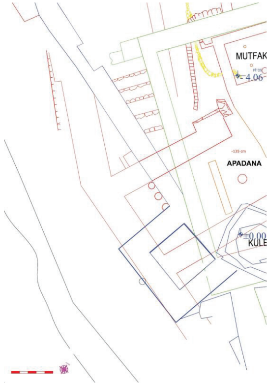
Çiz. 2: Apadana Batı Duvar Dışındaki Urartu Yapıları Planı