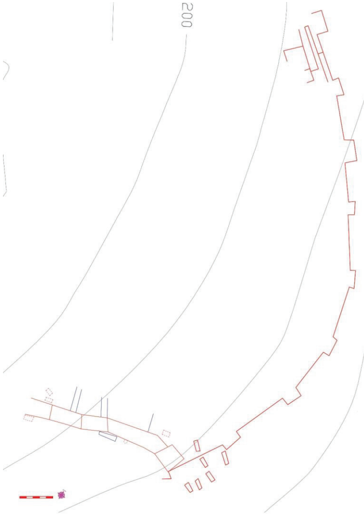
Çiz. 3: Doğu Dış Sur Duvarlarının Planı