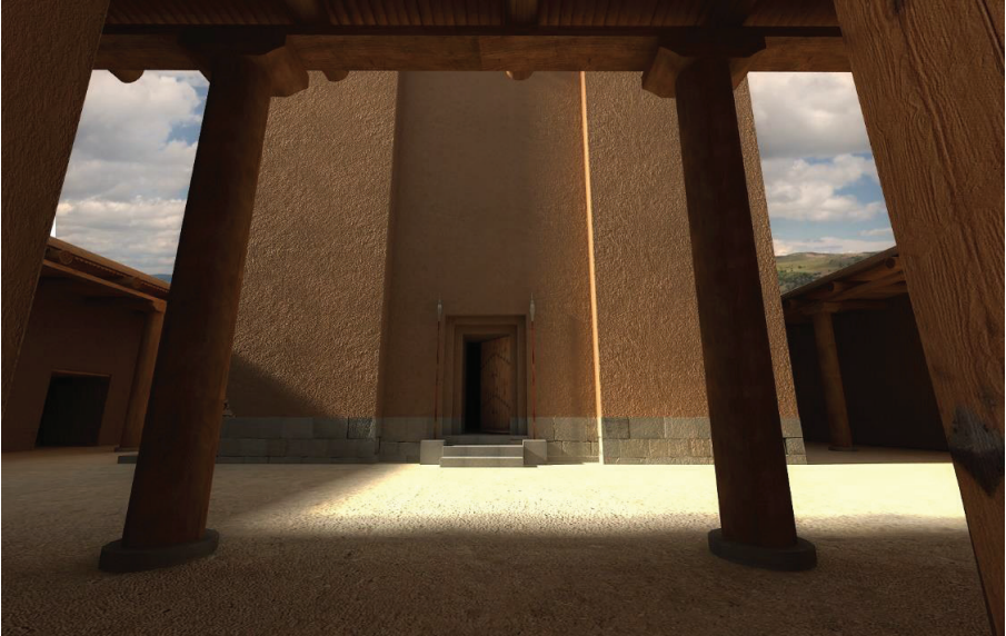
iz. 5: 3D modelleme alıřmaları