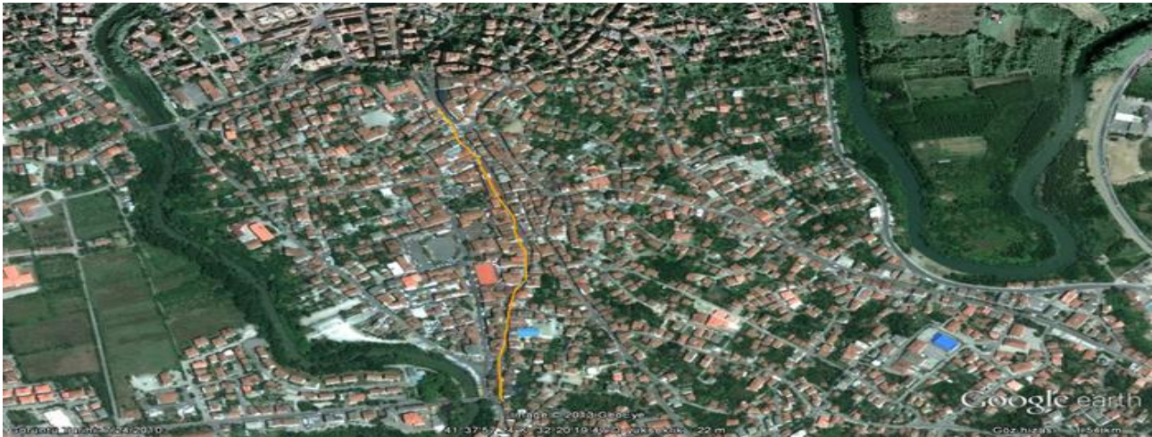
Fotoğraf 2- Zonguldak: Gözlemin Yapıldığı Caddeler (Bülent Ecevit, Gazi Paşa Caddesi ile Emral Çarşısı)