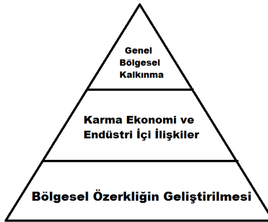
Şekil 1. Endojen kırsal kalkınma araçları (Salkım, 2014: 58).

Endojen kırsal değerlendirme yaklaşımı biyoçeşitliliğin artırılmasına ve çevresel tahribatın azaltılmasına önem vererek önceki yaklaşımların eksikliğini belirtmiş, aynı zamanda sosyal kalkınmaya da vurgu yaparak bu konuya ilişkin adımlar atılması gerektiğinin de önemini vurgulamıştır (Salkım, 2014: 59).