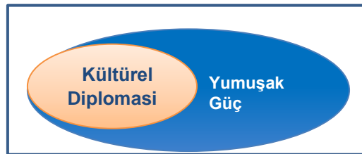
Figür 3. Yumuşak Güç-Kültürel Diplomasi bağlantısı

Bu bağlamda, Figür 3’de görüleceği üzere, aslında kültürel diplomasi yumuşak güce ait alanın içinde yer alan bir alt-unsur olarak görülebilir. Esasında, kültürel diplomasiye tümüyle yumuşak güç kapsamının içinde yer aldığını saptamak yanlış olmayacaktır. Bir yandan, yumuşak güç ve kültürel diplomasi birbirine oldukça yakın iki kavram olarak ele alınmaktadır. Dış politika alanında sıkça kullanılan bu iki kavram arasında birbirini tamamlar niteliktedir.