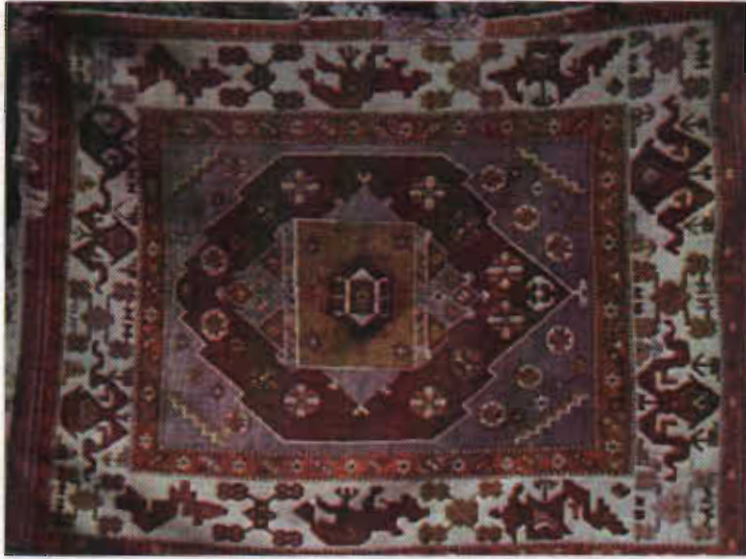
Resim 13 –Karabulut halı, XVIII-XIX.yy. Yunddağ köyleri (İzmir), b.deniz, 1985.