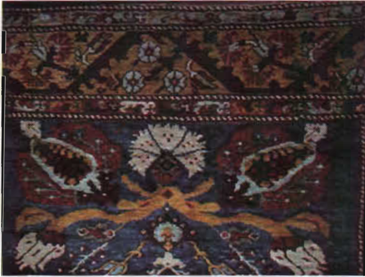
Resim 14 –Kula halısı, yılan motifi, XVIII-XIX. yy. Kula (Manisa) Kurşunlu Camı, b.deniz, 1984.