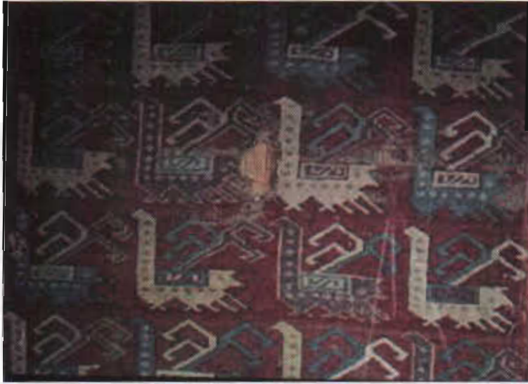
Resim 2- "Horozlu halı", XIV-XV. yy. Konya-Koyunoğlu Müzesi.