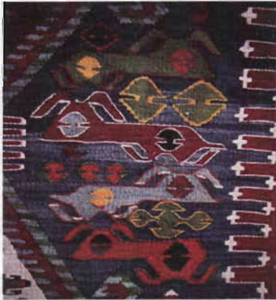
Resim 6- Enikli kilim, enik (kopek yavrusu) motifi, ayrıntı, XX.yy. başı, Aksaray-Milletbahçesi Cami, 400 x165 cm. b.deniz.1982.