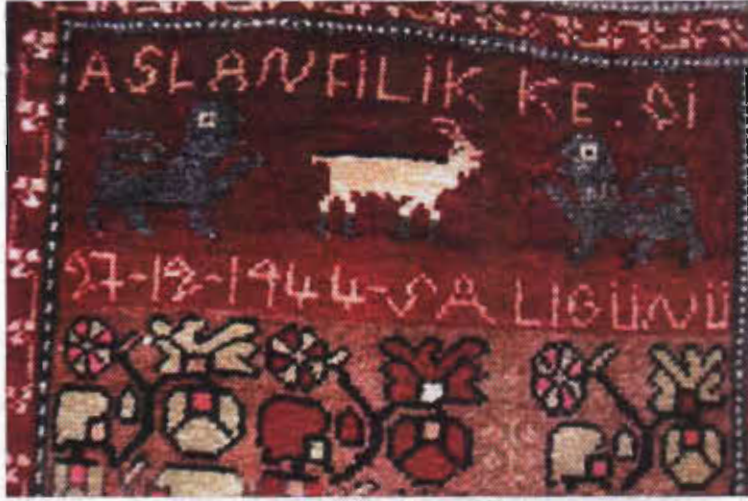
Resim 11- Seccâde halısı, XX.yy.başı, Sivas, b.deniz. 1988.