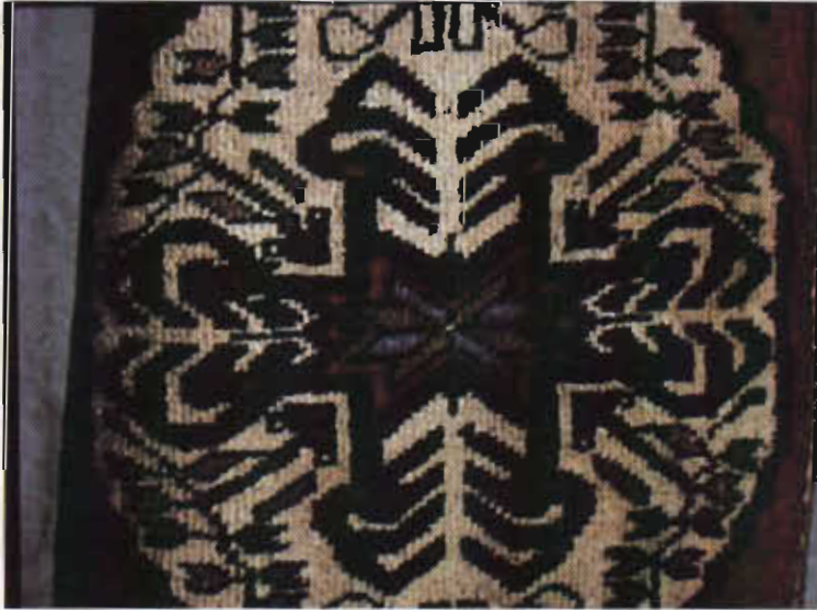
Resim 10- Yastık halısı, akrep motifi, Ansama Köyü (Aksaray), XX.yy.başları, b.deniz, 1979.