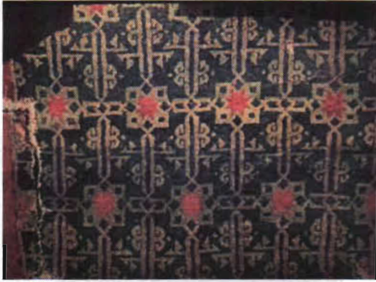
Resim 1- Selçuklu dönemi halısı, XIII. yy. T.İ E.M. (Gönül Öney arşivi).