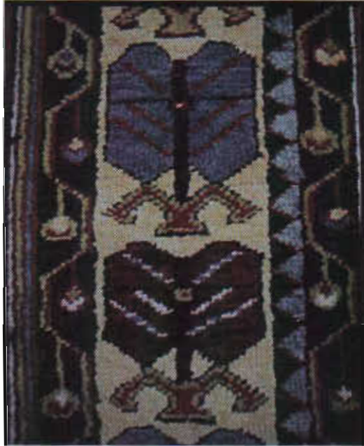
Resim 8- Somya halısı, kenar suyu, İnsan motifli, XX. ortası. Anıma (Aksaray) Köyü Cami, b. deniz. 1979.