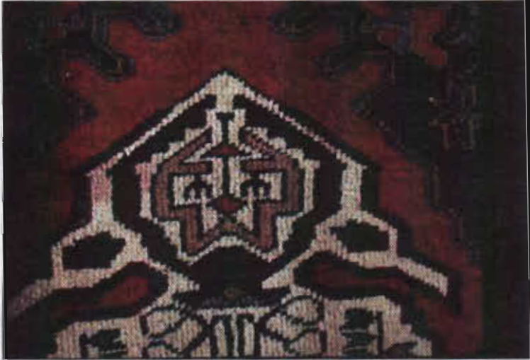
Resim 12- Yastık halısı, köpek figürü, XX.yy. başı, Anısama (Aksaray), b. deniz, 1979.