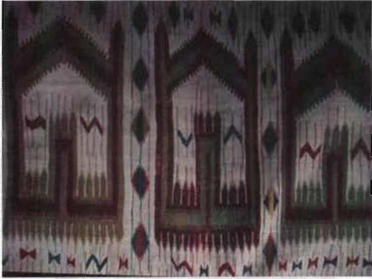
Resim 5- saf seccâde (namazlık), XVIII-XIX. yy. Ereğli (Konya) Ulu Cami, b. deniz. 1985.