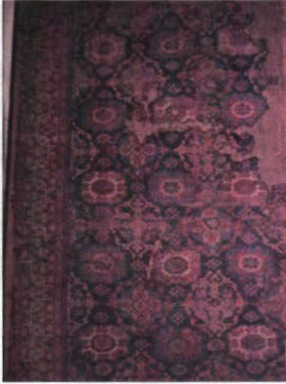
Resim 3- Erken dönem Osmanlı halısı (I.grup), XV-XVI.yy. T.İ.E.M..