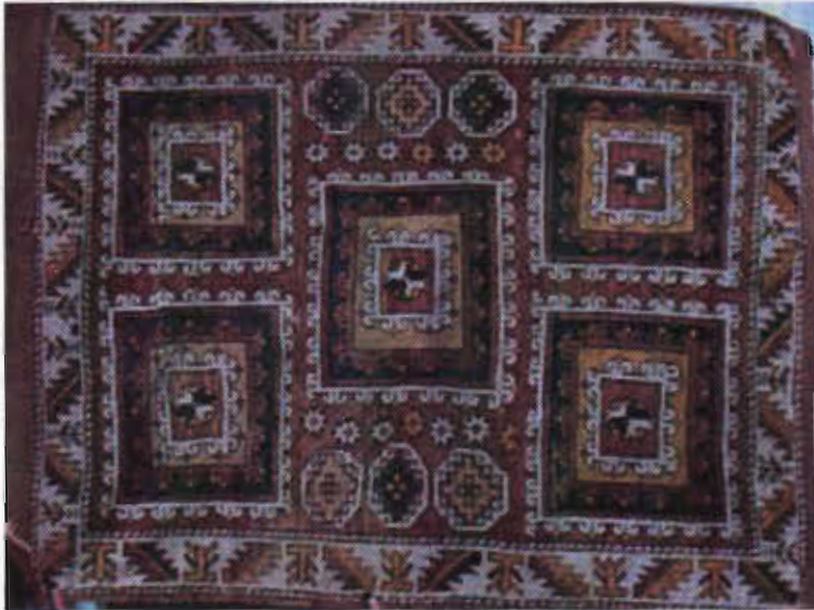
Resim 4- Altın tabak halı, XVIII.yy. Ayvacık (Çanakkale)- Burgaz Köyü Cami, 130 x 186 cm. b.deniz. 1990.