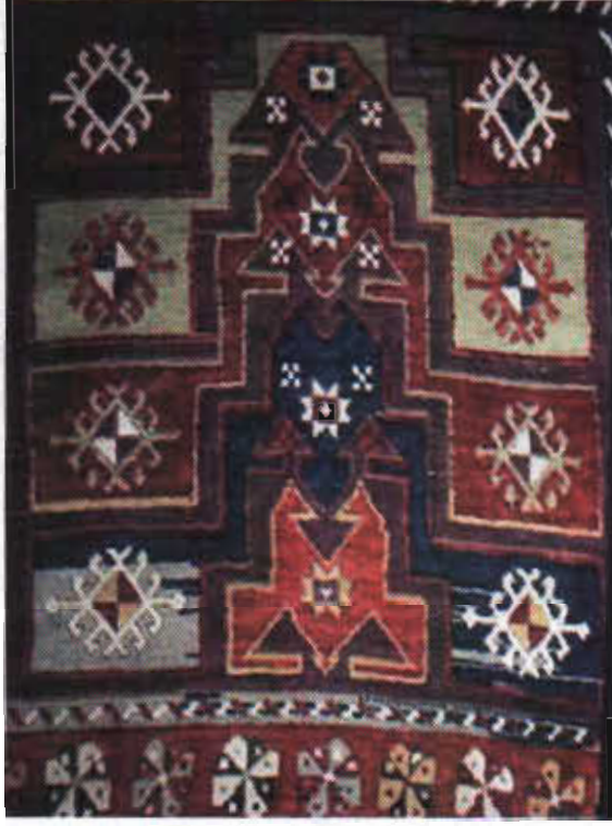
Resim 7-Hataplı (deve semeri) halı, XVII-XVIII.yy. Eski-Aksaray Ulu Cami, b.deniz. 1984.