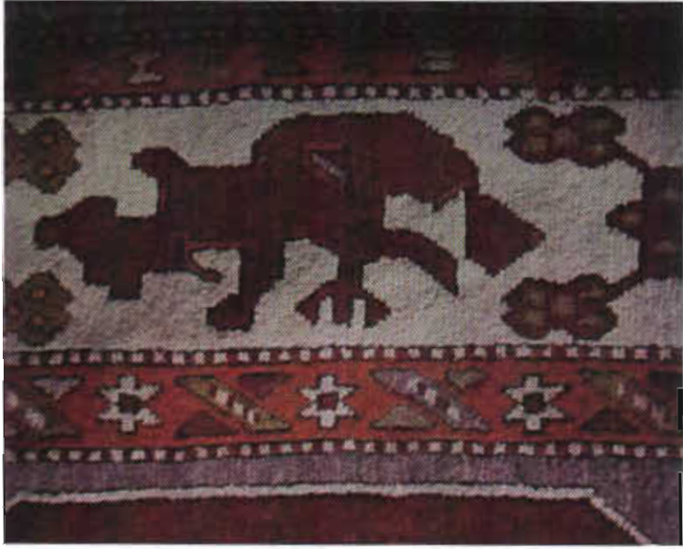
Resim 15- Karbulut halı, detay, deve motifi, XVIII-XIX.yy. Yunddağ Köyleri (İzmir), b.deniz, 1985.