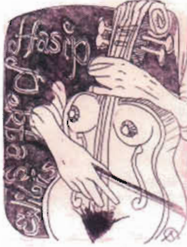
Resim 11: Salih Denli, Türkiye, C4+C5, (90x70)mm , 1999