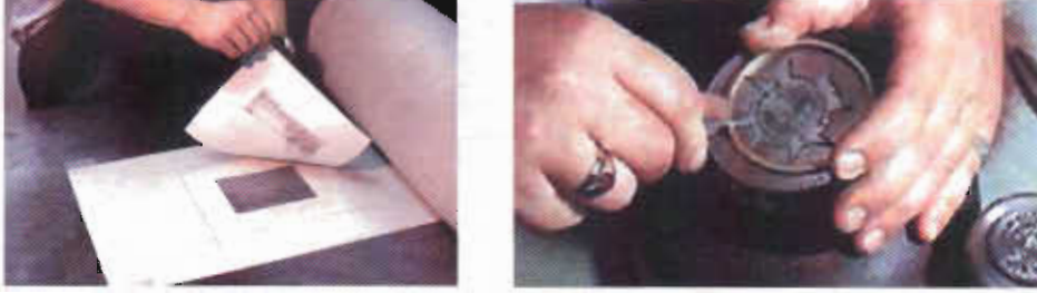
Resim 3: Çukur baskı (intaglio) ve kuru kazıma (drypoint) çalışması.

Gelişiminin ilk yıllarında exlibrisler, Gutenberg tarafından yeni icat edilmiş olan basım metotlarının da yardımıyla, ahşap üzerine oyulup şekillendirilerek basılmaya başlanmıştı. Kuru kazıma (drypoint) ya da çukur baskı (intaglio) yapıldı; bu teknikte ya bakır ya da çelik levha kullanarak, oyma kalemi veya asit indirme (etching) yöntemi kullanılmıştır.