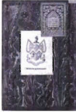
Resim 1: Kitabın iç kapağına yapıştırılmış bir exlibris.

16. yüzyılda, kağıt üzerine basılan ve kitap kapağının iç yüzüne kola ile yapıştırılan exlibrislerden bağımsız olarak, genellikle arma tarzı motifleri olan ve kitabın cilt kenarına yapıştırılan exlibrislerle aynı işlevi gören “süperlibros” lar; kitap pulları (bookstamps) da bulunmaktaydı.