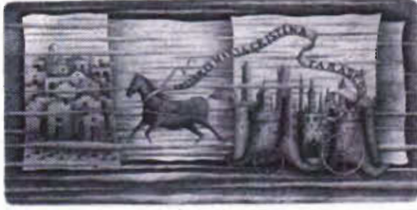
Resim 10: Pietro Tarasco, İtalya, C3 , (44x98)mm

Kompozisyonda yer alan yazının, exlibristeki varlığı nedeniyle okunabilir olmasının yanı sıra biçimiyle ve ritmiyle de kompozisyonun ahenkli bir tamamlayıcısıdır. Bu durum, exlibris sanatçısının / tasarımcısının hiç bir zaman gözardı edemeyeceği sorumluluğudur.