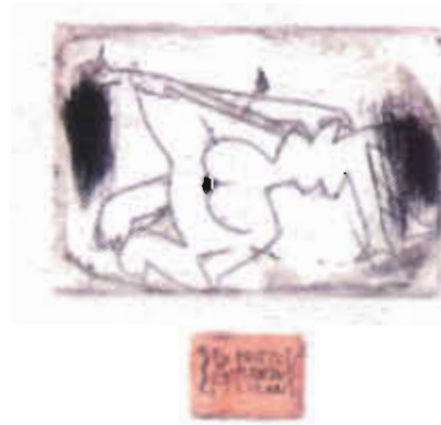
Resim 7: Zoran D. Jovanović, C3+C4, (146x145)mm, 1995

Yazı, exlibristeki konumuyla iletişimin temel bir ögesidir. Ait olduğu kişiyi bildirmesinin yanı sıra, uyarlanmış anatomik biçimiyle özel anlamlar iletebilir. Bu anlamlar, birer niteleme olabileceği gibi bir duyguyu, bir fikri ya da bir kültürü anlatabilirler. Yazı ögesi, görüntüyle birlikte kullanılıyorsa, görüntünün plastik yapısından bağımsız değildir; bütünün bir parçasıdır. Yazı; sanatçı tarafından, estetik düzen gereği olarak deforme edilebilir; ama bu kendi içinde doğru görülebilen bir deformatsyondur.