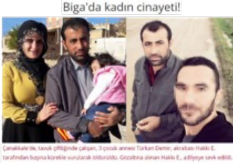
Görsel 6. Olay Gazetesi

Kaynak: http://www.canakkaleolay.com/Biga-39-da-kadin-cinayeti--57240