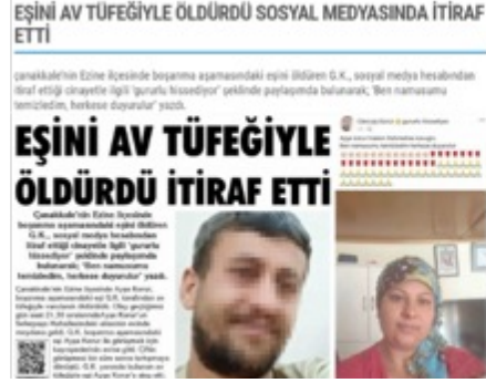
Görsel 11. Boğaz Gazetesi 2. Haber