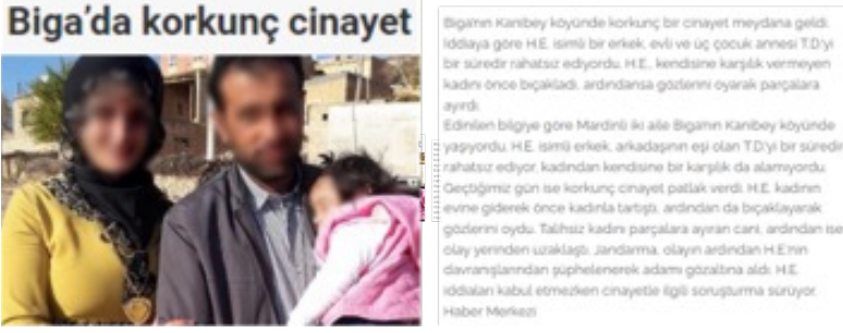
Görsel 3. Kalem Gazetesi