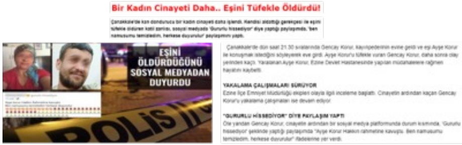
Görsel 14. Aynalıpazar Gazetesi

Ayrıca haber içeriğinde diğer birçok haber gibi cinayetin aldatma gerekçesi ile işlendiği belirtilmekte, bu ifade ile fail korunmakta ve failin kendi hukukunu uygulamasında destekleyici bir tavır sergilenebilmektedir.