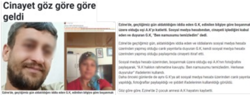
Görsel 12. Gündem Gazetesi

düğü fotoğraf kullanılırken failin sosyal medya hesabındaki küçük ve sansürlenmiş fotoğraf haricinde herhangi bir görsele yer verilmemiştir. Diğer yandan ikinci haberde failin fotoğrafının konulduğu ama bu sefer de blur yöntemi ile gizlendiği; kadının ise yüzünün net bir şekilde görüldüğü bir fotoğraf seçildiği tespit edilmiştir. Ayrıca iki haberde de failin sosyal medya hesabından paylaştığı yazıda kullanıcı adının dahi sansürlendiği görülmektedir. Medya, kadının kimliğini ifşa ederken erkeği korumaktadır. Fakat görselde yalnızca mağdurun fotoğrafının olması toplumun faili daha kolay unutmamasına neden olmaktadır.