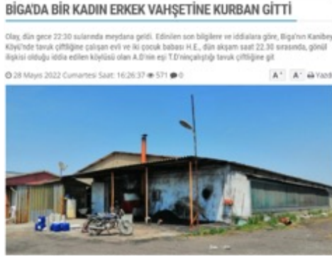
Görsel 4. Boğaz Gazetesi