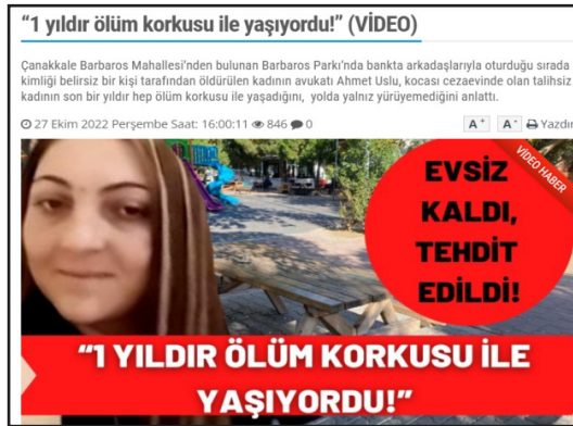
Görsel 17. İşte Çanakkale Gazetesi

26 Ekim 2022 tarihinde Çanakkale Barbaros Mahallesi'nde bir kadın cinayeti işlenmiş ve işlenen kadın cinayeti yerel gazetelerden yalnızca 11'inde haber yapılmıştır. 3 haberin başlığında ”videolu” betimlemesine yer verildiği kayıt altına alınmıştır.