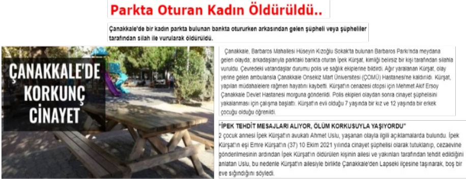
Görsel 20. Aynalıpazar Gazetesi

Haberde “gecenin sessizliğini silah bozdu” ifadesi cinayeti süslü bir dil ile ele almaktadır. Kitap cümlesinden alıntı tarzında olan bu ifade, cinayetin ciddiyetini sarsmakta, adeta cinayete güzelleme yapmaktadır. Ayrıca işlenen cinayet için “benzeri daha önce yaşanmamış olay” olarak bahsedilirken, zanlının bir ilki gerçekleştirdiği ve cinayet işleminin değil işlediği cinayetin benzersiz olmasının önemli olduğu vurgulanmaktadır.