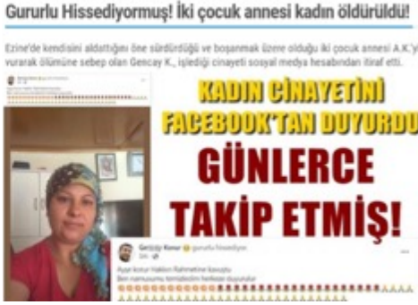
Görsel 10. Boğaz Gazetesi 1. Haber

Çanakkale yerel medya incelendiğinde Ezine’de 9 Ağustos 2022 tarihinde işlenen kadın cinayeti ile ilgili haberlere yalnızca 11 internet gazetesinde yer verildiği kayıt altına alınmıştır. Haberlerde cinayetin boşanma ve aldatma gibi gerekçelerle işlendiği vurgulanmıştır.