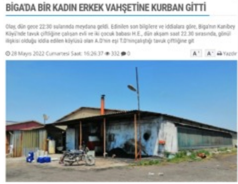
Görsel 5. İşte Çanakkale Gazetesi