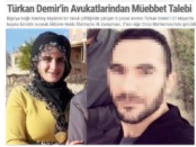
Görsel 7. Gazete Lapseki