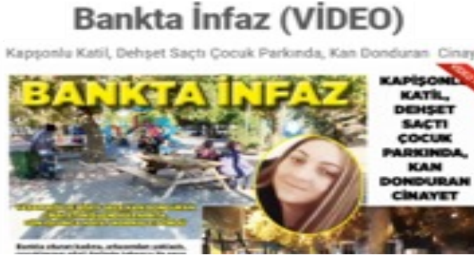
Görsel 19. Vitamin Gazetesi

Haber genel olarak incelendiğinde cinayet haberinin hikâyeleştirildiği, olay örgüsünün detaylıca, gerekçelere bağlanarak ve geçmişe dayanarak anlatıldığı görülmektedir. Kadının Lapseki’ye taşınmasının “sığınmak” olarak ele alınması ve evinin talan edilerek hiçbir eşya alamaması detayının verilmesi olayı duygusallaştırmaktadır. Bu detaylar okuyucunun zanlıya değil, mağdura odaklanmasına, mağdurun hayat hikâyesine duygusal yaklaşmasına neden olmaktadır.