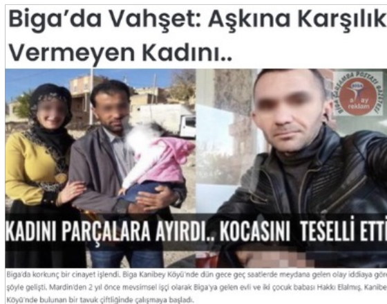
Görsel 2. Çarşamba Postası Gazetesi