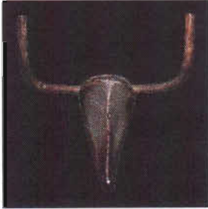
Resim-4: P.Picasso Boğa Başı 1943

Picasso, özellikle resmin iki boyutlu olmasından dolayı, resimde bulamadığı biçimleri, heykel çalışmalarında bulmaya çalışmaktadır. Picasso'nun bu dönemdeki çalışmaları, üçüncü boyutun yapay olarak ortaya çıkmasına neden oldu. Belki de bu sonuç, resim sanatının iki boyutlu olması nedeniyle sanatçının kendisini ifade etmesine yetmediği için, tam olarak sanatçıyı tatmin etmiyordu. Picasso, hacim ve boyutla ilgili düşüncelerini, heykel aracılığıyla gerçekleştirmeye eğilim göstermekteydi. Heykelin bir sanat dalı gibi böyle bir isteğin gerçekleşmesinde, geniş sınırsız potansiyele ve estetik olanaklara sahip olması, bu isteklerin gerçekleşmesine olanak sağlamaktaydı. Picasso "aramıyorum buluyorum" sözü birazda gözüün önüne kadar gelmiş olanakların bir amaç için değerlendirilmesini vurgular. 14 (Res.4).