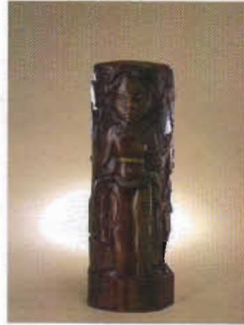
Resim-3. Paul Gauguin Figür 1892

Bunlardan diğeri P.Gauguin, 10 renkte ve biçimde sanatçının doğa karşısındaki mutlak özgürlüğünün ilk bayraktarlığını yapanlardandır. P. Gauguine göre asıl olan, sanatçının kendi duygu ve düşüncelerini biçimlendirmesidir. 11 (Res.3).