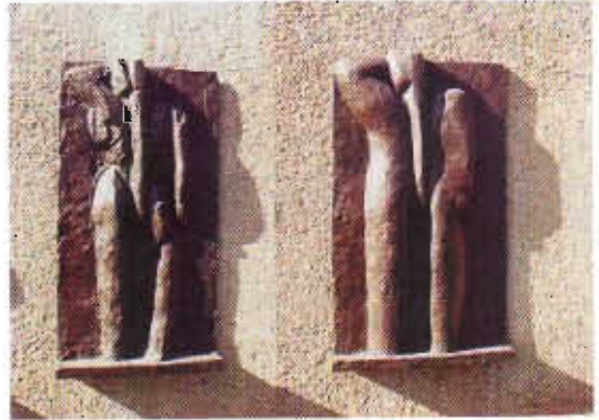
Resim-5: H.Matisse Sırt soyutlaması 1916-1930

Yine geleneksel malzemelerle beykel yapan diğer modern sanatçılardan Henry Moore küde içerisinde iç boşluğu kullanan ilk sanatçı olmuştur. 18 Bununla birlikte modern heykel sanatında boşluk, yepyeni bir heykel ögesi olmuştur. Henry Moore halk sanatlarını iyi incelemiş, geleneksel malzemeyi kendine özgü ışık, kütle ve mekan zenginliği içerisinde biçimlendirmiştir. 19 Örneğin: Moore'nın "Yatan Figür" çalışmaları buna iyi bir örnek teşkil eder ( Res.7).