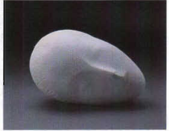
Resim-8- C.Brancusi, Uyuyan 1909-1910

adlı yapıtı, sadeleşmenin belirgin olduğu yapıtlarından birisidir (Res.8).