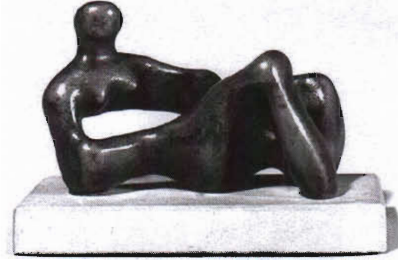
Resim-7- H.Moore, Yatan Figür.1938

Yaratıcılık ilhamını doğadan alan Moore ( Çakıl Taşları, Kemikler, Dağlar ), Astek ve İnka sanatını da incelemiştir. H. Moore, "Heykelde önemli olan nasıl yapıldığı değil, malzemenin arkasındaki ruhtur. Bazen malzeme, düşünceye yardım edebilir, ama bu, düşüncenin özgürlüğüne engel de olabilir. İyi bir heykel kapalı olmalıdır bir tepenin yamacından yuvarlandığında hiçbir parçasını kaybetmemelidir." sözleriyle heykel sanatını anlatmaktadır. 20