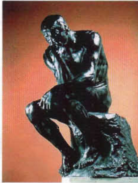
Resim-6. A.Rodin Düşünen Adam 1880