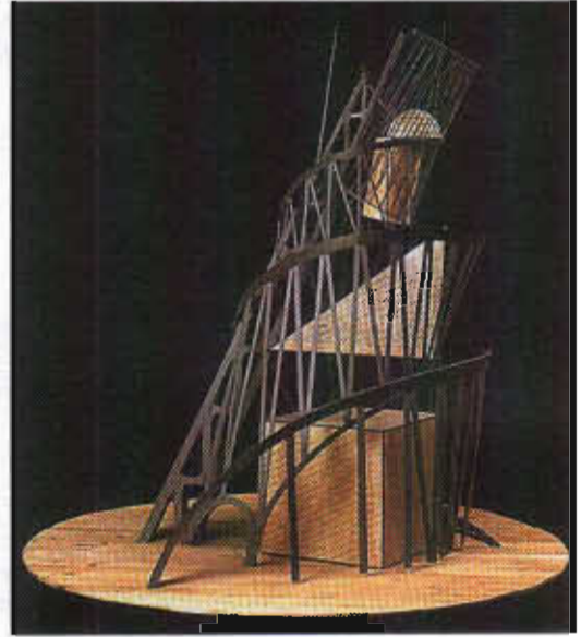
Resim-1:V.Tatlin,3.Enternational Anıtı için maket,1920

Örneğin: Boradin'in ünlü bir kimyacı olmakla birlikte çok sesli müzik alanında ünlü bir besteci gibi de isim yapmıştır. 5 Yine mühendis eğitimiyle heykel yapan V. Tatlin 3. Enternasyonal Anıtı için maket çalışmasını inşa yöntemiyle oluşturmuştur. 6 ( Res. 1 ).