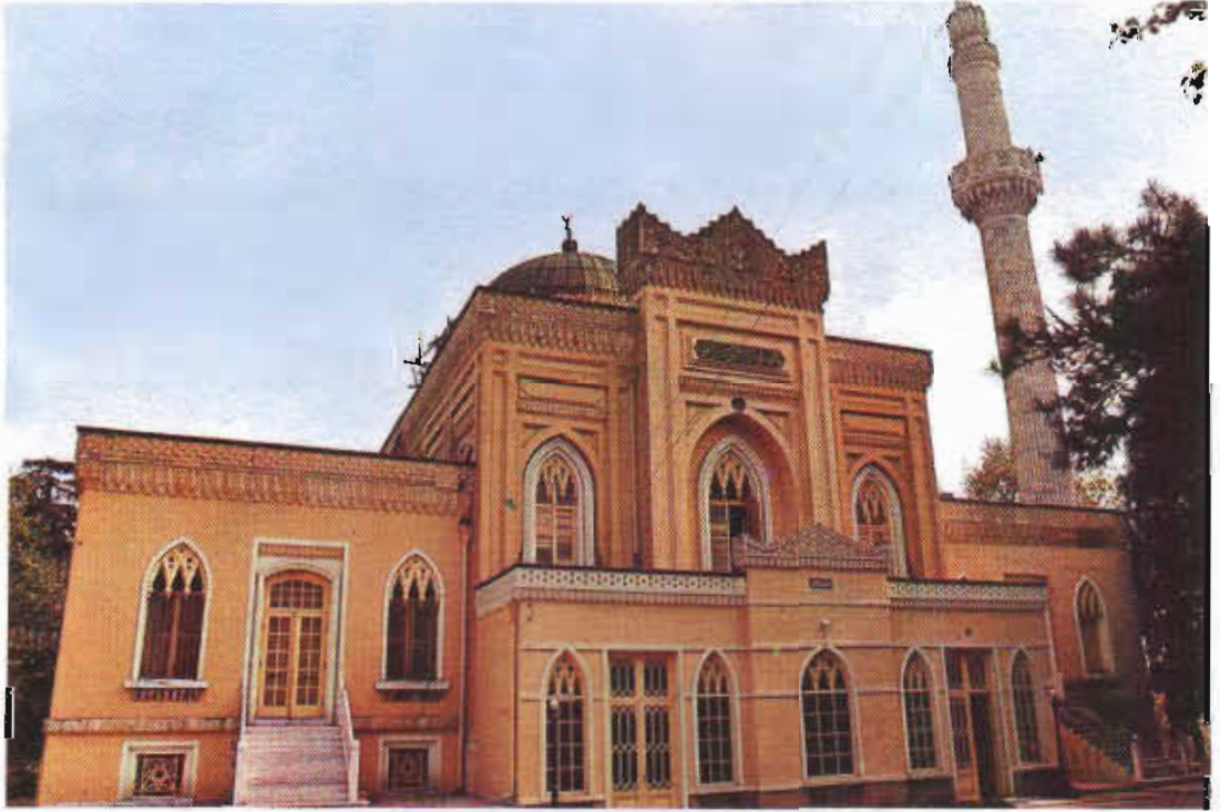
Resim 5: Yıldız Hamidiye Camii

Sultan Abdülaziz'in desteği ile "Şirket-i Nâfia-i Osmânî" adıyla İmparatorluğun ilk inşaat şirketini de Sarkis Balyan kurmuştur. İnşaat işlerinde kullanılan ve Avrupa'dan getirilen malların yurtiçinde üretimi için bir şirket kurulmasını 9 Eylül 1872 tarihli bir layiha ile saraya sunmuş 15 ve 5 Ağustos 1873'de nizamnamesi hazırlanarak faaliyete başlamıştır. 16 Ayrıca kendisine teminat talep etmeksizin Mersin-Tarsus-Adana ve Bandırma-Balıkesir-Karacabey arasında demiryolu inşası ve bunların işletmesi için 99 yıllık imtiyaz tanınmış, İstanbul-Bandırma arasında vapur işletme ruhsatı da verilmiştir. 17