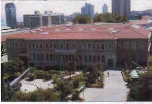
Resim 4: Mekteb-i Harbiye (Askeri Müze)

Yapıların gerçek mimarları ile planını uygulayanlar farklı kişilerdir. Ermeni kalfalar inşa ettikleri yapıların çoğunluğunda mimar değil müteahhitlik işlevi