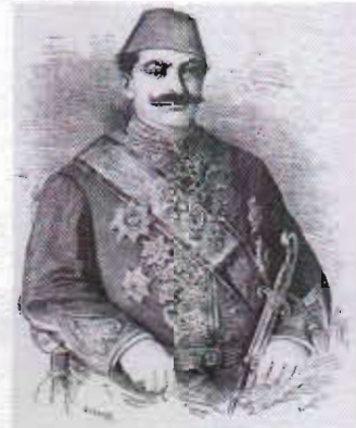
Resim 1. Sarkis Balyan (Pars Tuğlacı'dan)

ve Kevork Pamukçıyan 5 aynı tarihlerde Sarkis Balyan'ın Paris'te mimarlık eğitimi aldığını ve 1855'te École des Beaux-Arts'dan mezun olduğunu belirtmektedirler. Oysa elde ettiğimiz belgeler, Sarkis Kalfa'nın aynı tarihlerde İstanbul'da olduğunu ve mimarlık eğitimi almadığını göstermektedir. Aygül Ağır'ın École des Beaux-Arts ile yaptığı bir yazışma da bu belgeleri desteklemektedir. Ağır'a École des Beaux-Arts'dan gelen 4 Mayıs 1999 tarihli mektup Balyan Ailesi'nin hiçbir ferдинin bu okulda eğitim almadığını bildirmektedir. 6