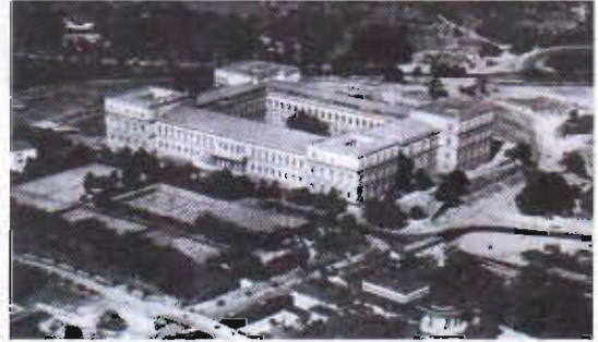
Resim 3: Taşkılla (Mecidiye Kışlası)

münakasa (açık eksiltme) adı verilen bir ihale sistemine geçilmiştir. Ancak bu sistemde gelir seviyesi düşük olan yerli mimarlar yanında maddi birikimleri bulunan ve finans kaynaklarına yakınlıkları ile tanınan Ermeni kalfalar öne çıkmıştır. Bina planları ihalelerden önce hazırlanmaktadır.