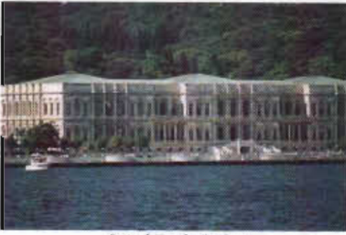
Resim 6: Yeni Çırağan Sarayı