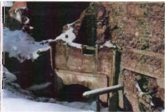
Şekil 24: Erzurum Mirza Mehmet Mahallesinde Tandırbaşı (Yıkıldı)