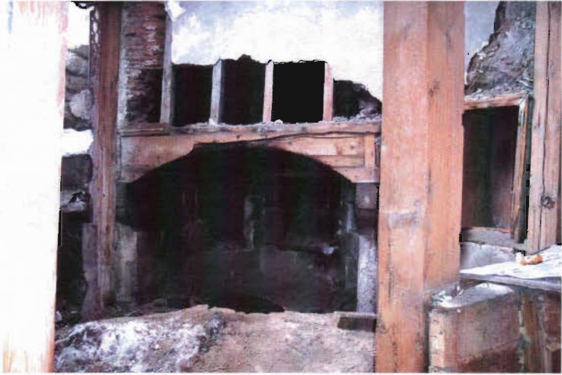
Şekil 22: Erzurum Avni Beyin Evinde Tandırbaşı