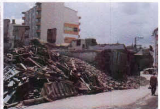
Şekil 21: Erzurum Mebdi Efendi Mab. Sıvırcık Sok. Yıkılmış Bir Ev