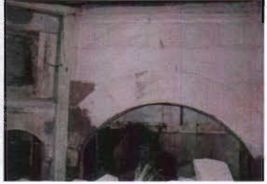
Şekil 17: Erzurum Faik Albayrak Evi Tandırbaşı (Yıkıldı)