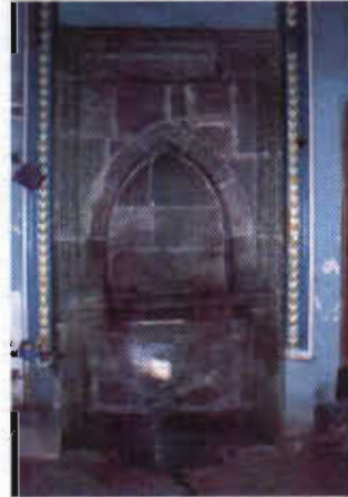
Şekil 9: Erzurum B.Ceylan Evinde Kurun-Çeşme