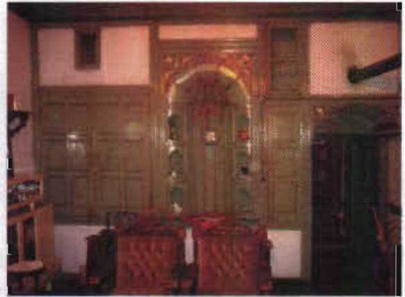
Şekil 15: Erzurum Somunoğlu Evinde Tandrevine Açılan Oda