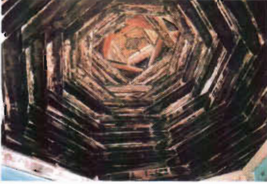
Şekil 16: Erzurum Fikri Evin Evinde Kırılgaç Örtü