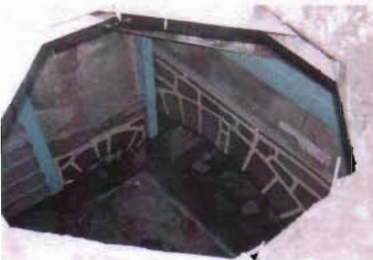
Şekil 20: Erzurum Mebdi Efendi Mab. Sıvırcık Sok. Tandırbaşı (Yıkıldı)