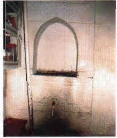
Şekil 7: Erzurum Kemal Akkur Evinde Kurun