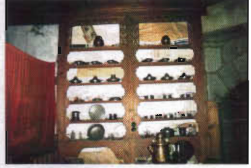
Şekil 11: Erzurum Somunoğlu Evinde Terekler