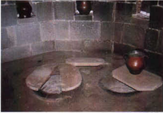
Şekil 6: Erzurum Somunoğlu Evinde Tandırbaşının İçten Görünüşü