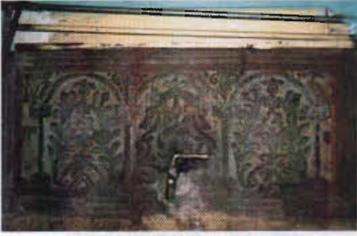
Şekil 10: Erzurum Fikri Evin Evinde Kurum