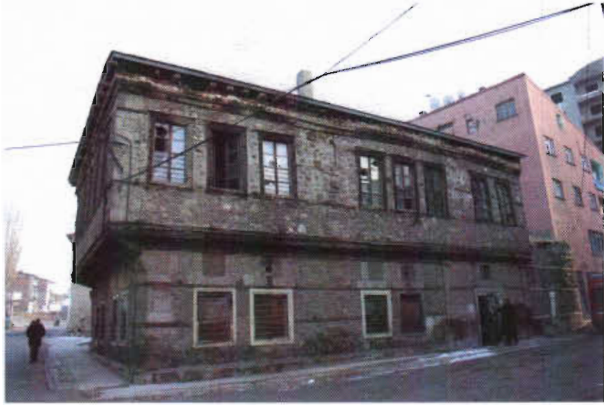
Şekil 2. Erzurum Abdülhamit Bey Konağı Genel Görünüşü