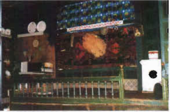
Şekil 13: Erzurum Hanaağası Evinde Seki