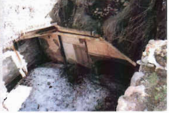
Şekil 19: Erzurum Çögenderli Evinde Yıkık Tandır Evi