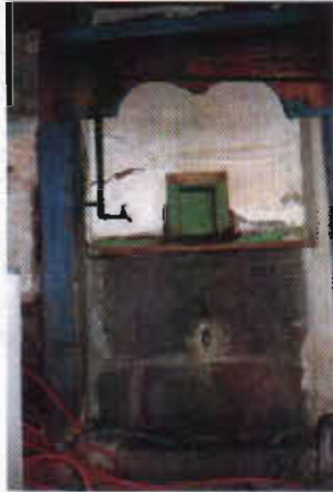
Şekil 8: Erzurum Muhsin Efe Evinde Kurun