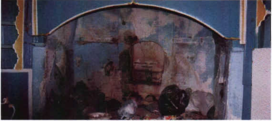
Şekil 5: Erzurum B.Ceylan Evinde Tandırbaşı