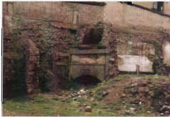
Şekil 23: Erzurum Palandöken Caddesi Üzerinde Tandırbaşı (Yıkıldı)