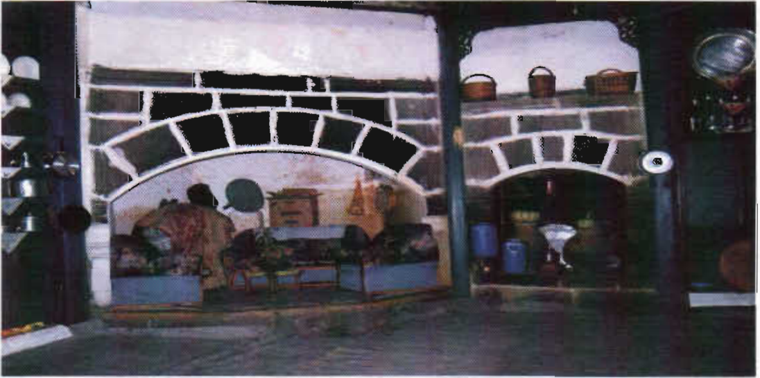
Şekil 4 Erzurum Hanağası Evinde Tandırbaşı ve Küçük Ocak