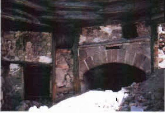
Şekil 18: Erzurum Abıskahılar Evinde Yıkık Tandır Evi