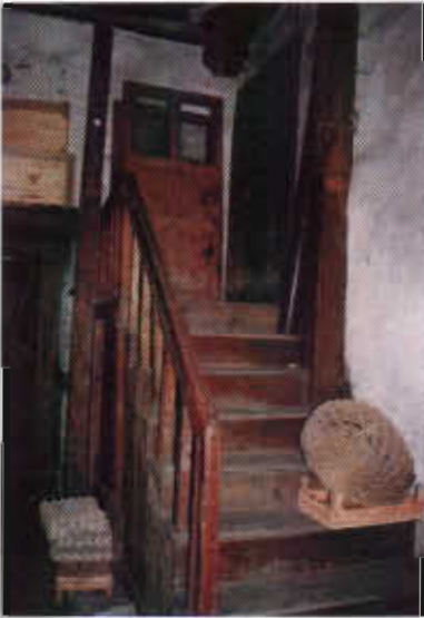
Şekil 14: Erzurum Mustafa Torun Evinde Kiler-Ambas