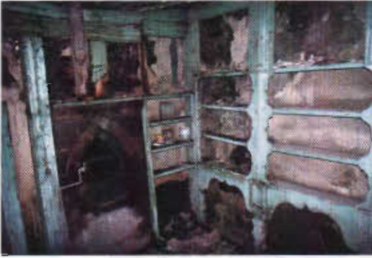
Şekil 12: Erzurum Abdülbamit Bey Konağı Tandrevinde Terek