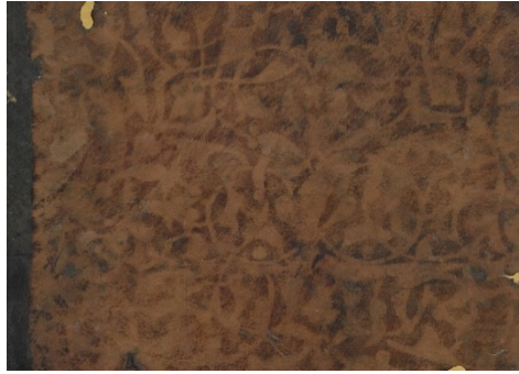
Görsel: 23, Örnek: 4, Sünen, 864/1459, TIEM: 1621, Arka İç Kapak Detay.

Deriyle kaplanan iç kapaklar rûmîlerle ve bitkisel motiflerle bezenmiştir (Görsel: 23).