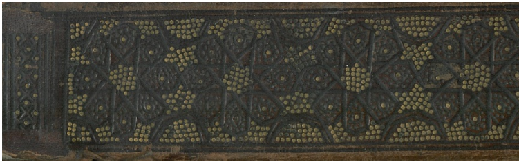
Görsel: 16, Örnek: 3, Vefeyâtü'l-A'yân ve Enbâü Ebnâi'z-Zamân, 839/1435-1436, TİEM: 2146, Sertab.

Sertabın üst kenarında kapaklarda kullanılan zencirek görülmektedir. Alt kenarı kabaca tamir edildiğinden buradaki zencirek görülmemektedir. Ancak üslûp birliği açısından burada da aynı zencirek kullanılmış olmalıdır. Zemin sekiz kollu altı adet yıldız ve bunların uzantılarıyla doldurulmuştur. Merkezdeki yıldızların içinde sadece altın nokta bulunurken, uzantılarındaki beşgenlerde çok sayıda altınsız noktanın ortasında bir tane altın nokta görülmektedir. Diğer geometrik formların içi ise yine tamamen altın noktalarla doldurulmuştur. Böylece sekiz kollu yıldızlar ve uzantılarındaki beşgenlerle oluşturulan sekizgenler ön plana çıkarılmıştır (Görsel: 16).