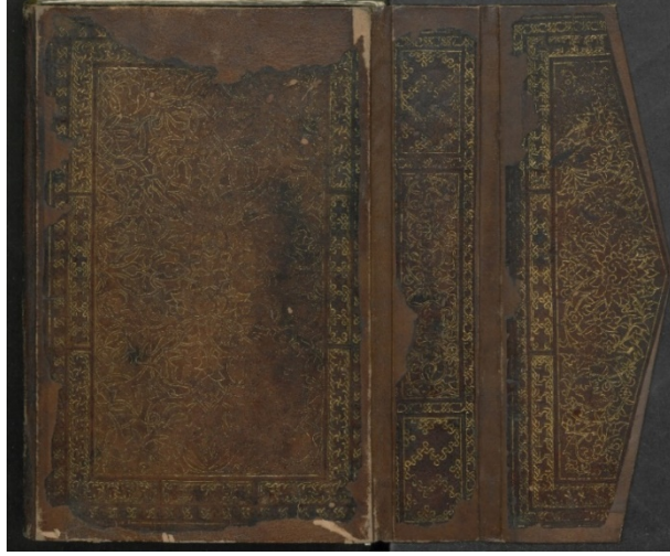
Görsel: 24, Örnek: 1, Fusûlü'l- Bedâyi , 824/1421, TIEM: 1817, Arka Kapak, Sertab, Mikleb.