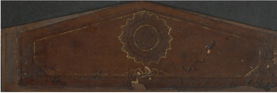
Görsel: 10, Örnek: 1, Fusûlü'l- Bedâyi, 824/1421, TİEM: 1817, Mikleb İçi.

Miklebin hem köşebentleri hem de şemsesi kapak içlerindekiyle aynıdır. Şemsenin sağ tarafına yerleştirilmiş iki yarım tepelikli salbekte bir bezeme oluşturulmuştur (Görsel: 10).