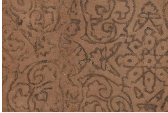
Görsel: 18, Örnek: 3, Vefeyâtü'l-A'yân ve Enbâü Ebnâi'z-Zamân, 839/1435-1436, TİEM: 2146, Ön İç Kapak.

İç kapaklar deriyle kaplanmıştır ve bezenmiştir. \frac{1}{4} simetrik bitkisel olarak tezyin edilen iç kapaklarda ayrıca sekiz kollu yıldız ve bu kolların uzantılarındaki beşgenlerle oluşturulmuş sekizgenler de görülmektedir (Görsel: 18). Bu bezemelerde ilk iki örneğin aksine erkek kalıp kullanılmıştır.