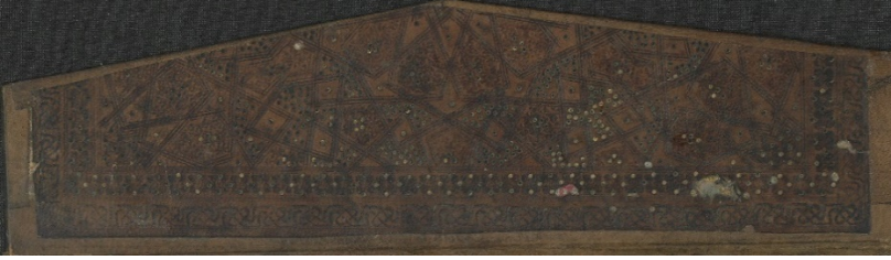
Görsel: 22, Örnek: 4, Sünen, 864/1459, TIEM: 1621, Mikleb.

Cildin tamirinde kullanılan deriyle kaplanan sertab bezemesizdir. Mikleb gerek zencirekleri gerekse zemin bezemesiyle kapaklarla aynıdır (Görsel: 22).