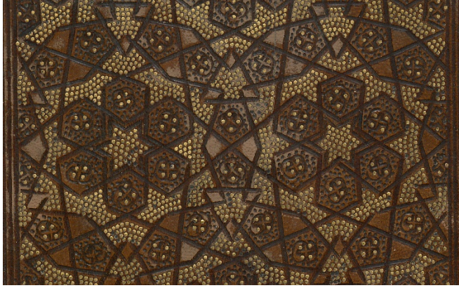
Görsel: 15, Örnek: 3, Vefeyâtü'l-A'yân ve Enbâü Ebnâi'z-Zamân, 839/1435-1436, TİEM: 2146, Arka Kapak, Detay.

Sertabın üst kenarında kapaklarda kullanılan zencirek görülmektedir. Alt kenarı kabaca tamir edildiğinden buradaki zencirek görülmemektedir. Ancak üslûp birliği açısından burada da aynı zencirek kullanılmış olmalıdır. Zemin sekiz kollu altı adet yıldız ve bunların uzantılarıyla doldurulmuştur. Merkezdeki yıldızların içinde sadece altın nokta bulunurken, uzantılarındaki beşgenlerde çok sayıda altınsız noktanın ortasında bir tane altın nokta görülmektedir. Diğer geometrik formların içi ise yine tamamen altın noktalarla doldurulmuştur. Böylece sekiz kollu yıldızlar ve uzantılarındaki beşgenlerle oluşturulan sekizgenler ön plana çıkarılmıştır (Görsel: 16).