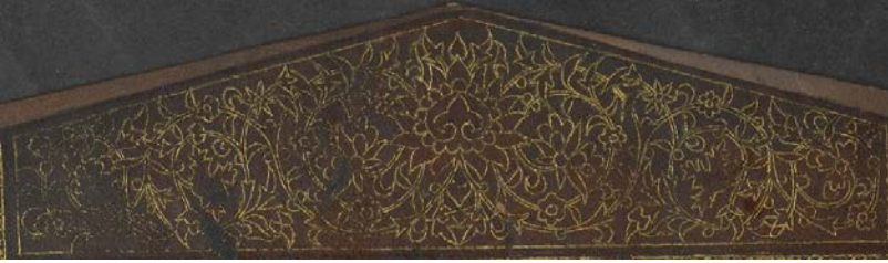
Görsel: 6, Örnek: 1, Fusûlü'l- Bedâyi , 824/1421, TİEM: 1817, Mikleb, Detay.

Mikleb kapaklar gibi tam zeminli olarak bezenmiştir. Buradaki bezeme ise kapaklardan farklı olarak ½ simetrlili hatayı grubu motiflerden oluşmaktadır (Görsel: 6).