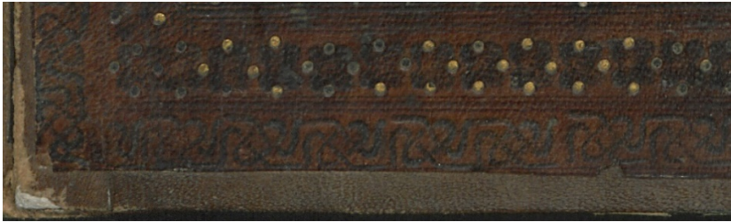
Görsel: 19, Örnek: 4, Sünen , 864/1459, TIEM: 1621, Ön Kapak Zencirek Detay.

Ön ve arka kapak aynı tezyin edilmiş olup, bu kapaklarda iki sıra zencirek bulunmaktadır. İlk olarak geometrik karakterli bir zencirek bulunmaktadır. İkinci olarak ise dört kollu yıldızlı zencirek görülmektedir ve bu yıldız kollarının arasına birer tane altınlı nokta yerleştirilmiştir. İki zencirek de altınlanmamıştır (Görsel: 19).