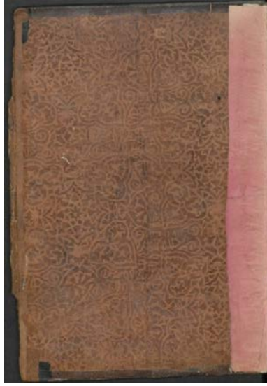
Görsel: 27, Örnek: 2, El- Câmîu's- Sahîh, 833/1430, TİEM: 1601, Arka İç Kapak.