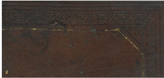
Görsel: 7, Örnek: 1, Fusûlü'l- Bedâyi , 824/1421, TİEM: 1817, Arka İç Kapak, Zencirek, Köşebent, Detay.

İç kapaklar deriyle kaplanmıştır. Bezemeli olan bu kapaklarda öncelikle bir sıra geometrik karakterli zencirek görülmektedir. Düz cetvelli köşebentlerin içinde ise üçgen şeklinde bir düğüm deseni bulunmaktadır. Zencirek gibi köşebentler de altınlanmamıştır. Köşebentlerden sonra görülen bir sıra altınlı cetvel bütün kapağı çevrelemektedir (Görsel: 7).