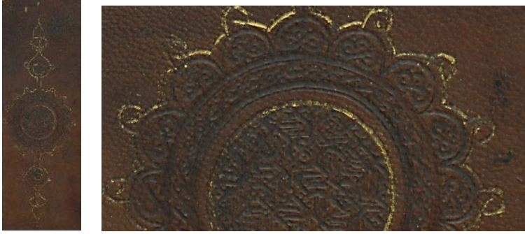
Görsel: 8, Örnek: 1, Fusûlü'l- Bedâyi , 824/1421, TİEM: 1817, Arka İç Kapak, Şemse, Salbek, Detay.

Salbekten sonra on altı dilimli yuvarlak bir şemse bulunmaktadır. Nispeten küçük olan şemsenin merkezindeki yuvarlağın içi soğuk olarak bırakılan geçmelerle doldurulmuştur. Bu yuvarlak bir sıra altın tahrirle çevrelenmiştir. Sonrasında ikişer sıra soğuk tahririn arasına yerleştirilen ince sarmal zencirek görülmektedir. Bu zencirekten sonra gelen on altı dilimin içi düğüm motifiyle bezenmiştir. Şemse, dilim ortalarında düğüm bulunan bir sıra altınlı tahrirle sonlandırılmıştır (Görsel: 8).