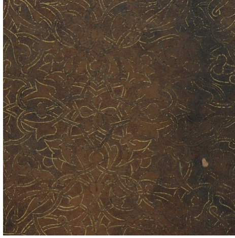
Görsel: 3, Örnek: 1, Fusûlü'l- Bedâyi, 824/1421, TiEM: 1817, Arka Kapak, Zemin Detay.

Bezemeli olan sertapta bir sıra zencirek bulunmaktadır. Kapaklarda bulunan zencirek burada da uygulanmış olup sertap bu zencirekle üç dikdörtgen paftaya ayrılmıştır. Kenarlardaki iki küçük paftanın içi altınlı-altınsız geçmelerle tezyin edilmiştir. Ortadaki uzun paftada ise boyuna simetrik hatayı grubu motifler görülmektedir. Bu motiflerin arasında kalan boşluklar yine iğne perdahıyla doldurulmuştur (Görsel: 4).