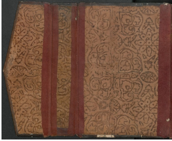
Görsel: 29, Örnek: 3, Vefeyâtü'l-A'yân ve Enbâü Ebnâî'z-Zamân , 839/1435-1436, TİEM: 2146, Arka İç Kapak, Sertab-Mikleb İçi.