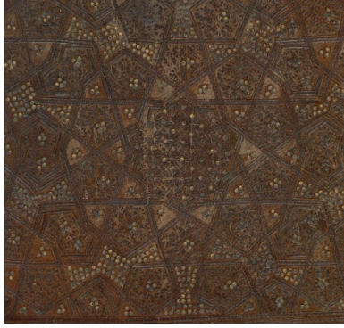
Görsel: 12, Örnek: 2, El- Câmiu's- Sahîh, 833/1430, TIEM: 1601, Arka Kapak, Detay.

bezenmiştir. Bütün tezyinat beraber değerlendirildiğinde altınlu noktaların sık kullanıldığı paftaların ön plana çıkarıldığı görülmektedir (Görsel: 12).