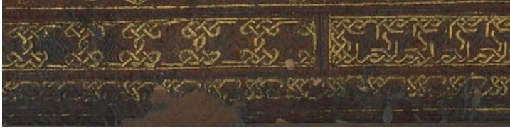
Görsel: 5, Örnek: 1, Fusûlü'l- Bedâyi , 824/1421, TİEM: 1817, Mikleb, Zencirek, Bordür, Detay.

Mikleb kapaklar gibi tam zeminli olarak bezenmiştir. Buradaki bezeme ise kapaklardan farklı olarak ½ simetrlili hatayı grubu motiflerden oluşmaktadır (Görsel: 6).