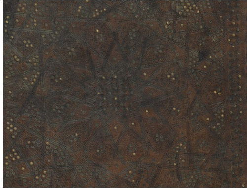
Görsel: 21, Örnek: 4, Sünen, 864/1459, TİEM: 1621, Arka Kapak Şemse Detay.

Tam zeminli geometrik karakterli olan kapakların merkezinde on iki kollu bir yıldız bulunmaktadır. Bu yıldızın içinin köşebentler gibi bezendiği tahmin edilmektedir. Bu yıldızın uzantılarıyla oluşturulan ikinci on iki kollu yıldızın içinde sadece birer tane altınlı nokta bulunmaktadır. Zemin bu yıldızın uzantılarıyla oluşturulan geometrik formlarla doldurulmuştur. Burada görülen beşgenlerin içleri gülçelerle ve dörder tane altınlı nokta ile doldurulmuş izlenimi vermektedir. Diğer formların içinde ise altınlı ve altınsız noktalar bulunmaktadır (Görsel: 21).