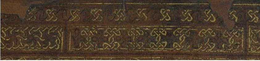
Görsel: 1, Örnek: 1, Fusûlü'l- Bedâyi, 824/1421, TİEM: 1817, Arka Kapak, Zencirek-Bordür Detay.

Cildin kapakları farklı tezyin edilmiştir. Kapaklarda altınlı ve altınsız cetvellerin arasında iki sıra zencirek-bordür bulunmaktadır. Bunlardan ilki geometrik karakterli bir zencirektir. İkinci sırada ise altınlı ve altınsız cetvelerle dikdörtgen paftalara ayrılmış örgülü bir bordür bulunmaktadır. Aynıymış gibi görünmesine rağmen iki kapakta kullanılan zencirek ve örgülü bordür farklı tezyin edilmiştir (Görsel: 1, 2).