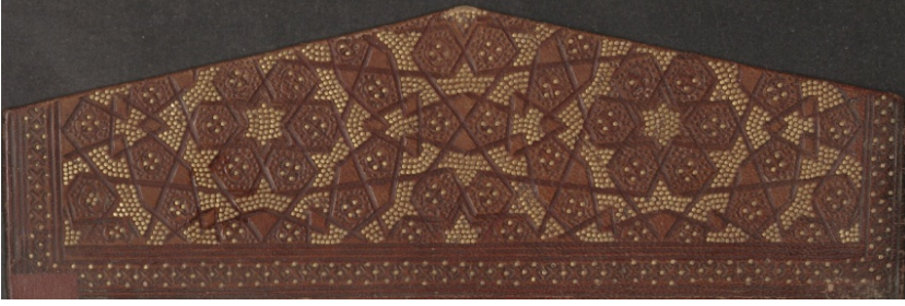
Görsel: 17, Örnek: 3, Vefeyâtü'l-A'yân ve Enbâü Ebnâi'z-Zamân, 839/1435-1436, TİEM: 2146, Mikleb.

İç kapaklar deriyle kaplanmıştır ve bezenmiştir. \frac{1}{4} simetrik bitkisel olarak tezyin edilen iç kapaklarda ayrıca sekiz kollu yıldız ve bu kolların uzantılarındaki beşgenlerle oluşturulmuş sekizgenler de görülmektedir (Görsel: 18). Bu bezemelerde ilk iki örneğin aksine erkek kalıp kullanılmıştır.