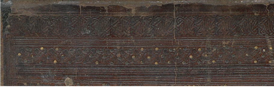
Görsel: 11, Örnek: 2, El- Câmîu's- Sahîh, 833/1430, TIEM: 1601, Arka Kapak, Zencirek, Detay.

Cildin ön ve arka kapağı aynı tezyin edilmiş olup, bu kapaklarda iki sıra zencirek bulunmaktadır. İlk olarak soğuk olarak bırakılan geometrik karakterli bir zencirek kullanılmıştır. Bu zencirekten sonra ise altta ve üstte alınlık olarak dört kollu yıldız motiflerinin peş peşe vurulmasıyla oluşturulan bir zencirek görülmektedir. İçleri taramalı olan bu yıldızların kolları arasına birer tane altın- lı nokta yerleştirilmiştir (Görsel: 11).