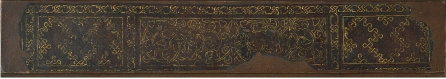
Görsel: 4, Örnek: 1, Fusûlü'l- Bedâyi, 824/1421, TiEM: 1817, Sertab.

Bezemeli olan sertapta bir sıra zencirek bulunmaktadır. Kapaklarda bulunan zencirek burada da uygulanmış olup sertap bu zencirekle üç dikdörtgen paftaya ayrılmıştır. Kenarlardaki iki küçük paftanın içi altınlı-altınsız geçmelerle tezyin edilmiştir. Ortadaki uzun paftada ise boyuna simetrik hatayı grubu motifler görülmektedir. Bu motiflerin arasında kalan boşluklar yine iğne perdahıyla doldurulmuştur (Görsel: 4).