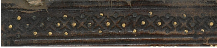
Görsel: 14, Örnek: 3, Vefeyâtü'l-A'yân ve Enbâü Ebnâ'i'z-Zamân , 839/1435-1436, TIEM: 2146, Arka Kapak, Zencirek, Detay.

Cildin ön ve arka kapağı aynı tezyin edilmiştir. Bu kapaklarda öncelikle dört kollu yıldızlı zencirek bulunmaktadır. Yıldız kollarının arasına birer tane altınlı nokta yerleştirilmiştir. Bu zencirekte bir önceki örneğin aksine yıldız motiflerinin içi taranmamış ve boş bırakılmıştır (Görsel: 14).