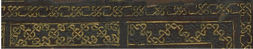
Görsel: 2, Örnek: 1, Fusûlü'l- Bedâyi, 824/1421, TİEM: 1817, Ön Kapak, Zencirek-Bordür Detay.

Kapaklarda zemin tamamen bezenmiş olup, merkezde çapraz olarak iç içe geçmiş iki tane dört kollu yıldız motifi görülmektedir. Zemin bu şekilde oluşan sekiz yıldız kolundan çıkan rûmîler ve hatayilerle, \frac{1}{4} simetrlili rûmîli ve hatayili olarak tezyin edilmiştir. Zemindeki bütün motifler altın tahrirlidir. Motiflerin içi boş bırakılırken motif araları iğne perdahıyla doldurulmuştur (Görsel: 3).