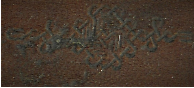
Görsel: 9, Örnek: 1, Fusûlü'l- Bedâyi, 824/1421, TİEM: 1817, Sertab İçi Detay.

Mikleb içi bezemelidir ve burada iki farklı zencirek kullanılmıştır. Miklebin alt ve üst kenarlarında kapaklarda görülen zencirek, sağ kenarında ise ince sarmal zencirek bulunmaktadır. Bu zencireklerin her ikisi de altınlanmamış ve soğuk bırakılmıştır (Görsel: 10).