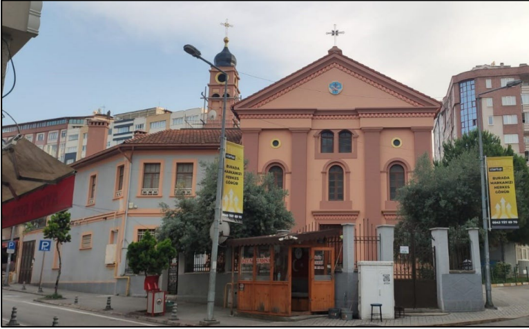
Resim 1. Mater Dolorosa Kilisesi