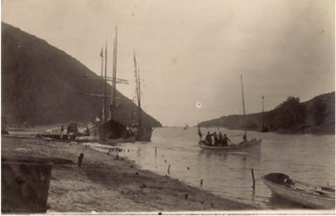
Res.2-Bartsin Boğazi- Ticari Liman yapılmadan önce (1930)