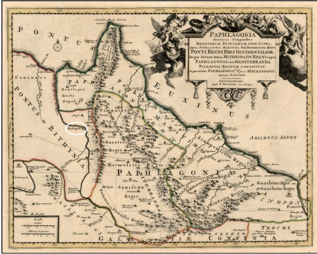
Harita 1-Paphlagonia Bölgesi (Mortier 1700)