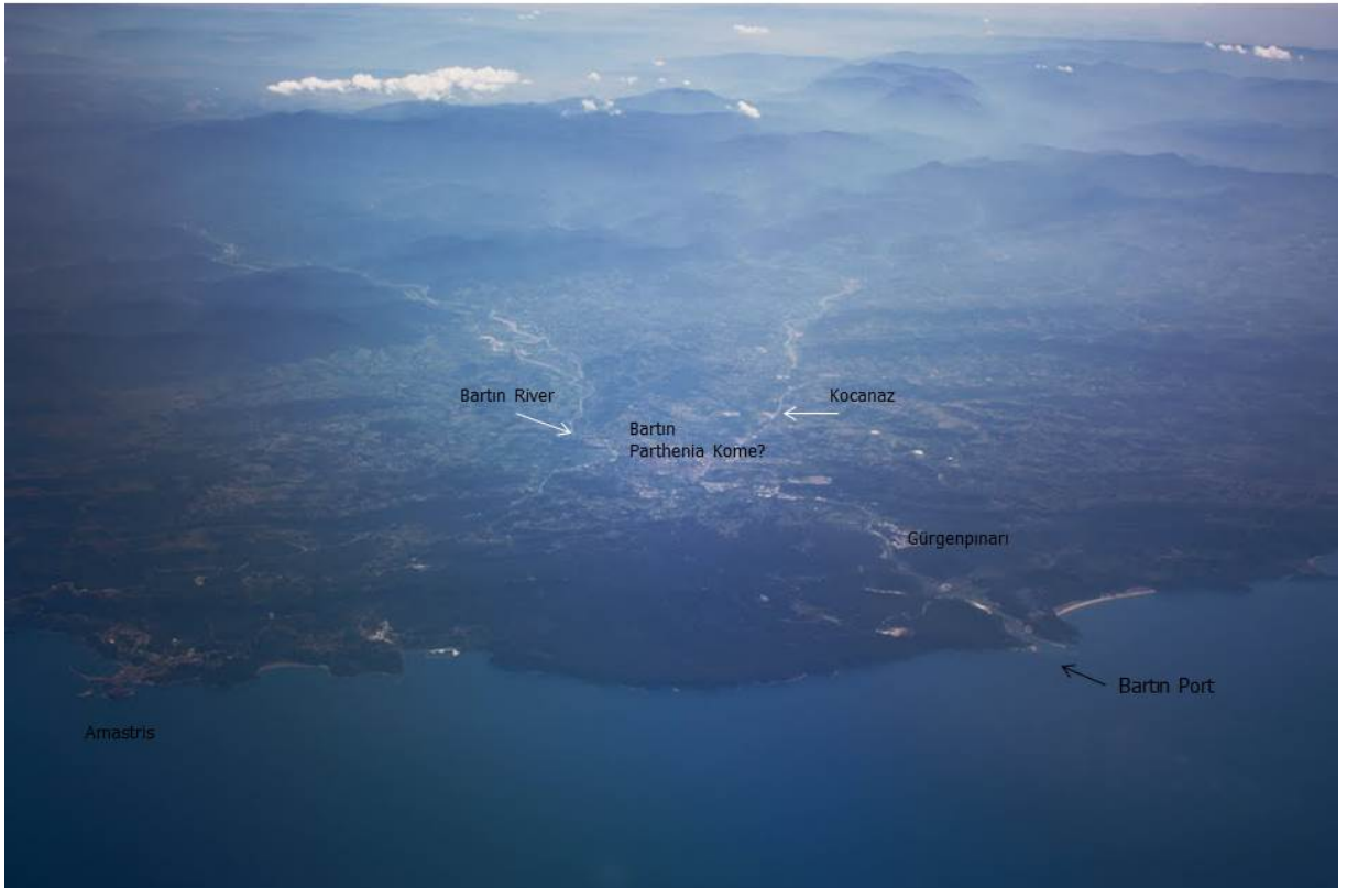
Res.5-Bartın Limanı- Bartın Şehir Merkezi-Bartın Nehri