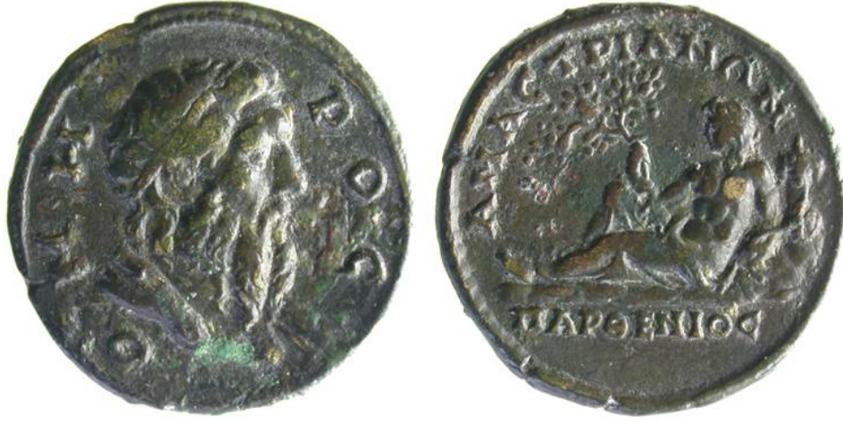
Res.4- Amastris Sikkeleri üzerinde ön yüzde Homeros ve arka yüzde Parthenios nehri betimlenmiştir.