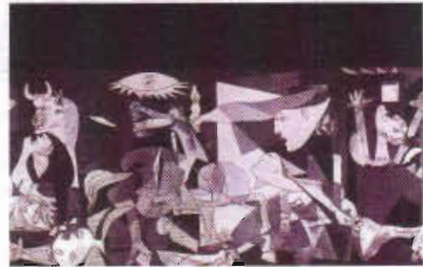
Resim 5. Picasso. "Guernica", 1937, T. Ü. Y. B., 350x780 cm

Belleğin çağrışımlarla geri getirdiği imgeler ve olaylar geçmişe aittir. Çağrışımla geri gelerek şimdiki zamana girerler. Çünkü bellek şimdiki zamandadır. İmgeleri ise geçmiş zamandadır. Bellek, insanı geçmiş zamana götürmez, geçmiş çağrışımlarla şimdiki zamana getirir. İmgeleri çağrıştırmaya, anımsatmaya ile düşünülür kılması ve asıl gerçeğin parçalarını şimdikiye getirmesi işlevleriyle bellek, hareketli bir çok ayakta oluşmuş bir sistemdir. Bellek yoksa sistem de yoktur. Bellek yoksa, ne geçmiş vardır ne de tarih. 4