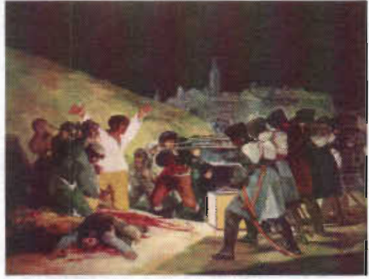
Resim 4. Picasso. "Guernica", 1937, T. Ü. Y. B., 350x780 cm

Oysa insan, bellek sayesinde dünyayı, canlıları, nesnelere, insanları, kendini hep aklında tutar ve dünya bir kaos olmaktan çıkar.