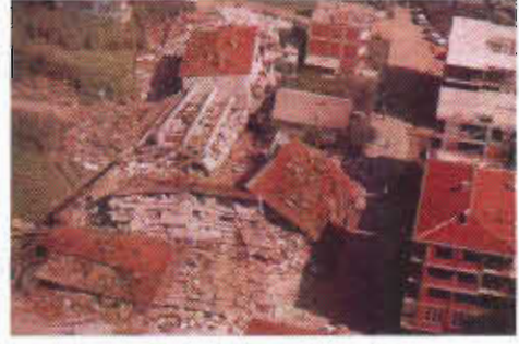
Resim-3: Depremden bir görünüm

Bellekte çağrışıma giren imge, kendi gerçek anlamını bulur çıkarır ve tekrardan onu geçerli hale getirir. Eğer herhangi bir çağrışım olmaz ise imgenin gerçek anlamı olduğu yerde öylece kalır. "Bellek, bir tür kurtarma edimini akla getirir. Anımsanan şey hiclikten kurtarılmış demektir. Unutulan şeyse terkedilmiştir." 3 Önemli bir olayın ya da nesnenin kalıcı olabilmesi için, imgelerinin belleğe iyice kazınması gerekir. Böylece o olay ve o nesne daha sonra anımsanacak ve yaşamaya devam edecektir.