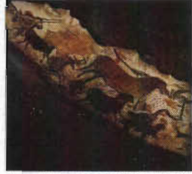
Resim-1. Lascaux Mağarası'ndan bir görünüm.

İlkel insan öldürmek istediği hayvanı daha önce doğada görmüş ve onun görsel imgesini belleğine kazımış, daha sonra da mağaranın duvarına resmetmiştir. "Erken eski taş devrindeki mağara resimleri ile heykellerin 'doğaya bakılarak' değil, bellekten yapıldığını bilim saptamış bulunmaktadır." 1 Bu resimler hem açlık hem de korku sonucu oluşan büyüsel olayların eserleridir. Karşı karşıya kaldığında vahşi bir hayvandan korkan insan, onu mağara duvarlarına resmederek elindeki silahlarla ona saldırmış, onun duvar üzerinde öldüğünü düşleyerek kendi kendini ona karşı cesaretlendirmiş, duvardaki resim üzerinde çeşitli büyüler yaparak da hayvanı etkilemeye çalışmıştır. Aslında bu büyülemede hayvanın etkilenmesi gibi bir şey söz konusu değildir. Asıl büyüleme insanın kendisine yapmıştır. Böylece insan bilinçaltına giren korkuyla yüzleşir ve onu yenerek bilinçaltından atar. Duvardaki resme saldırmayı onu yaralar ve böylece de vahşi hayvanı öldürebileceğinin farkına varır. Bu durum, insanın kendi kendini güdülemesi ve kendi korkularını yenmesidir (Resim 1).