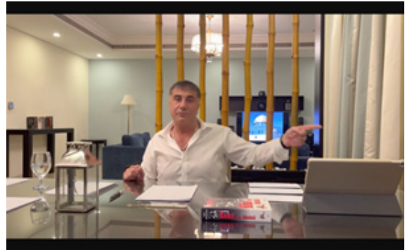
Resim 3 Sedat Peker'in ilgili videosundan bir görüntü

Byung-Chul Han'ın belirttiği gibi “yaşanan iletişimsel eylem krizinin izi, ötekinin meta düzeyde ortadan kaybolduğu kavrayışına dek sürdürülebilir.