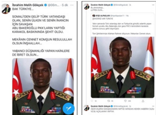
Resim 1 Melih Gökçek'in paylaşımı (18.08.2022)