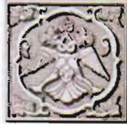
Çizim: 1- Sungurbey Camii Kuzey Taçkapı'daki Çift Başlı Kartal Figürü.