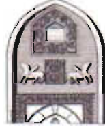
Çizim: 13- Kayseri-D ner K mbette At Fig r .