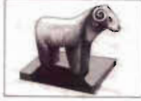
Çizim: 16- Koç Heykeli / Üçpınar Köyü - Tercan- Erzincan.