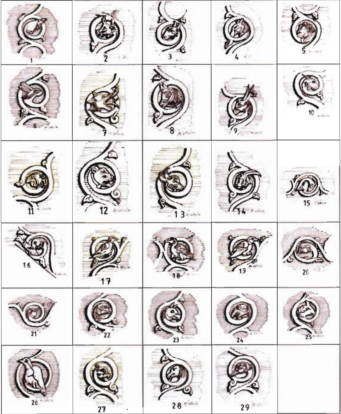
Çizim: 3- Sungurbey Camii Doğu Taçkapı'daki Panolardaki Hayvan Figürleri