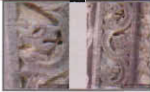
Resim 17: Bünyan Ulu Camii'nden Aslan Figürü.

Resim: 11, 12, 13, 14, 15, 16 - Doğu Taçkapının Sol Tarafındaki Panodan Ayrıntı (Orj. 2002).