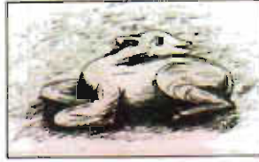
Çizim: 14- Niksar-breęi B y k Tekkesi'nde Geyik Fig r .