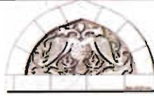
Çizim: 7- Niğde Hüdavent Hatun Türbesi'nde Çift Başlı Kartal Figürü.