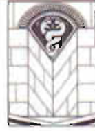
Çizim: 12- Erzurum Emir Saltuk K mbeti ırtma Niş Alınlığındaki Ejder Fig r .