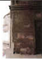
Resim: 5- Sungurbey Camii Doğu Taçkapı'daki Pano ve Mukarnas Kavsaralı Mihrabiyelerden Görünüm (Orj. 2002).