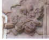
Resim: 18- Sivas-Gökmedrese'deki Türk Hayvan Takvimi Figürleri.