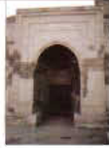
Resim: 4-Sungurbey Camii Doğu Taçkapı (Orj. 2002).