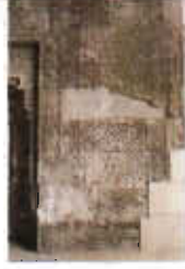
Resim: 6- Sungurbey Camii Doğu Taçkapı'nın Sağ Tarafındaki Panodan Görünüm.