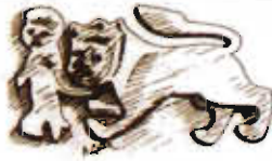
Çizim: 8- Urfa-Harran Kapısı'ndaki Zincirli Aslan Figürü.