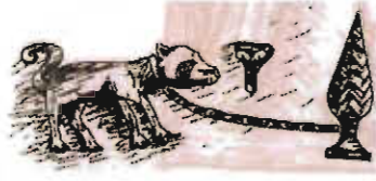
Çizim: 15- Tokat Paşa Hanı Giriş Eyvanı'ndaki Köpek Figürü.