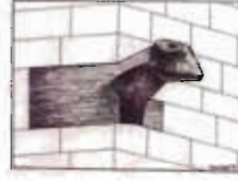
Çizim: 17- Ev Duvarında Koç Heykeli / Üçpınar Köyü - Tercan - Erzincan.