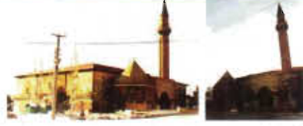
Resim: 1- Sungurbey Camii Genel Görünüm (Orj. 2002).