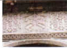
Resim: 3- Sungurbey Camii Kuzey Taçkapı'daki Çift Başlı Kartal Figürü (Orj. 2002).