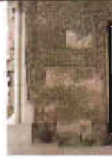
Resim: 7- Sungurbey Camii Doğu Taçkapı'nın Sol Tarafındaki Panodan Görünüm.