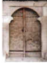
Resim: 2- Sungurbey Camii Kuzey Taçkapı'dan Görünüm (Orj. 2002).