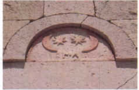
Resim 6: Ay Yıldız Motifi ve 1308 H. Tarihi