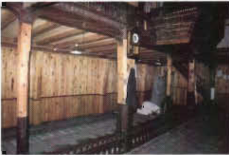
Resim 18: Mahfile Çıkış