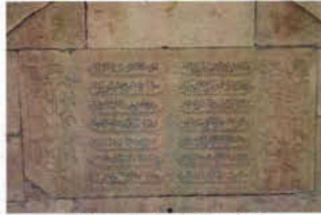
Resim 24: Çeşme Kitabesi