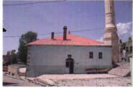
Resim 2: Konursu Camii Doğu Cephesi