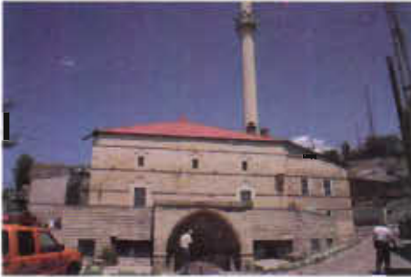
Resim 5: Güney Cephe