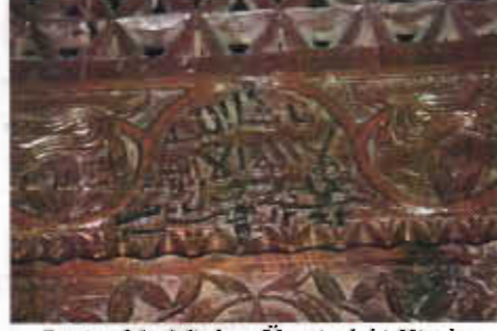
Resim 21: Minber Üzerindeki Kitabe