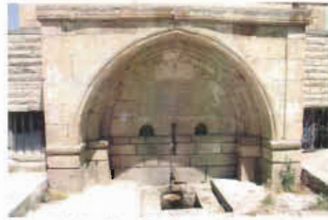
Resim 23: Ulu Camii Çeşmesi