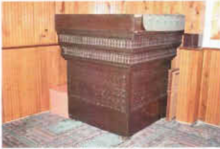
Resim 22: Vaaz Kürsüsü