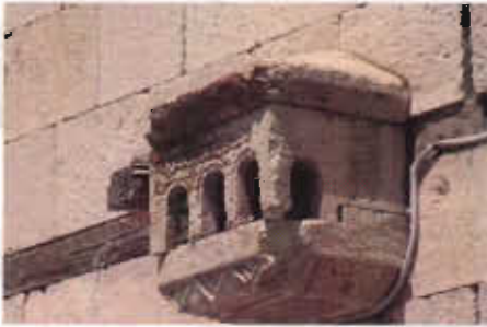
Resim 11: Kuşevi