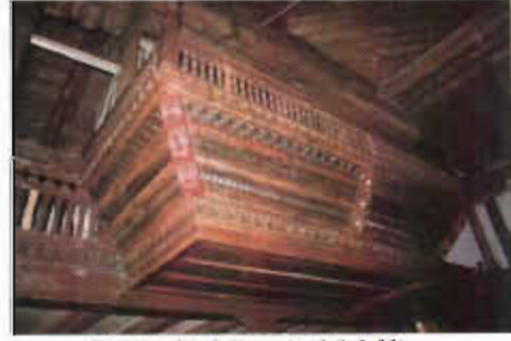
Resim 17: Müezzîn Mahfili