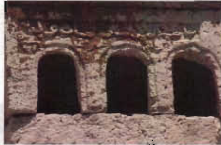
Resim 12: Kuşevi Üzerindeki Kitabe