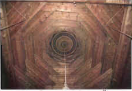
Resim 14: Kurlangıç Örtü