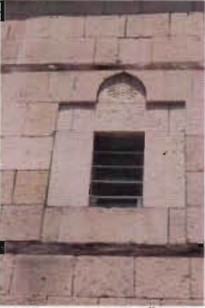
Resim 9: Güney Cephe Üst Orta Pencere