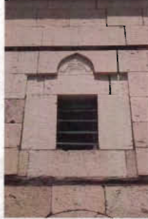
Resim 10: Güneydoğu Üst Pencere