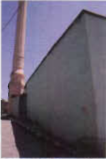
Resim 3: Kuzey Cephe