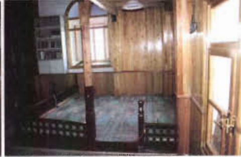
Resim 19: Güneybatı Köşedeki Mahfil