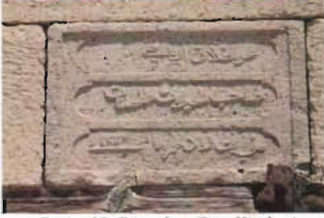
Resim 13: Güneybatı Dua Kitabesi