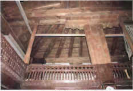
Resim 16: Ahşap Tavan