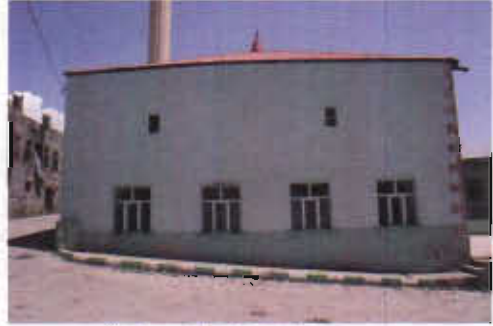
Resim 4: Batı Cephe