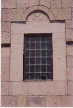
Resim 7: Güney Cephe Penceresi