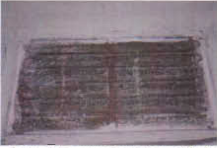
Resim 1: Konursu Cami Yapım Kitabesi