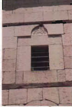
Resim 8: Güneybatı Üst Pencere