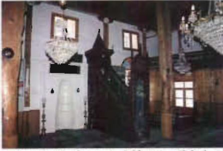
Resim 20: Caminin Mihrap ve Minberi