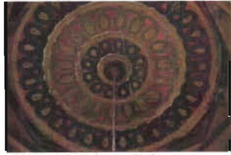
Resim 15: Kalemîşi Süsleme