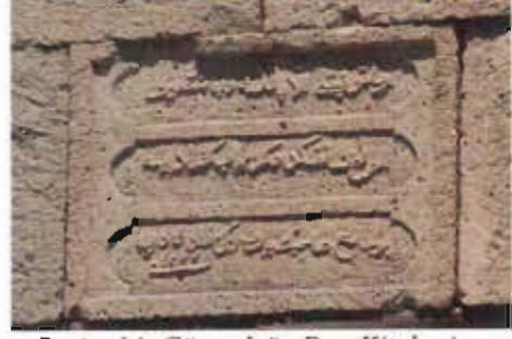
Resim 14: Güneydoğu Dua Kitabesi