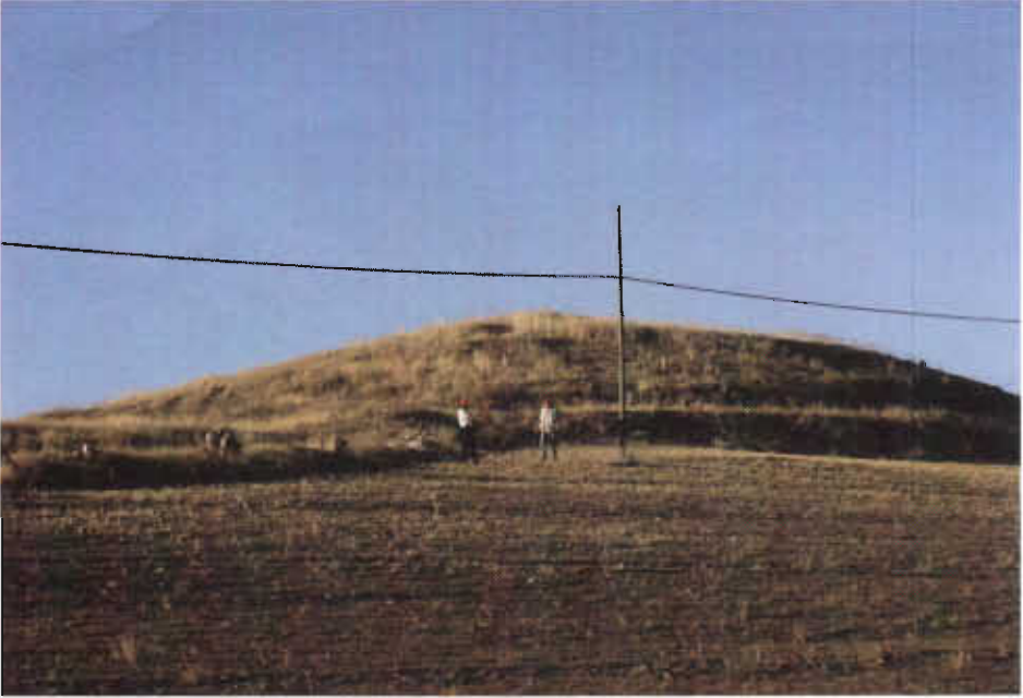
Resim - 16 Karakilisetepede Höyüğü