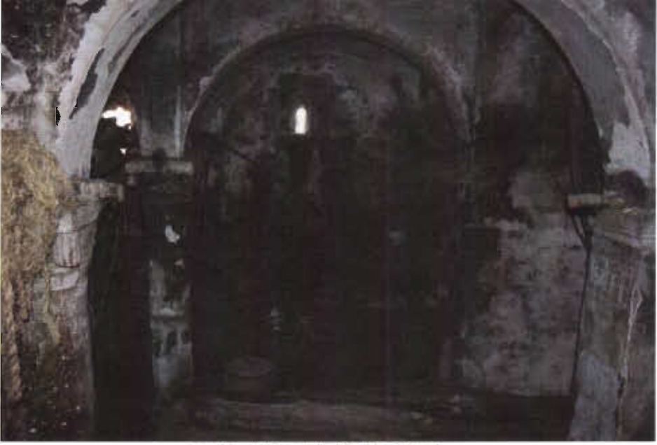
Resim - 15 Yaylım Köyü Kilisesi