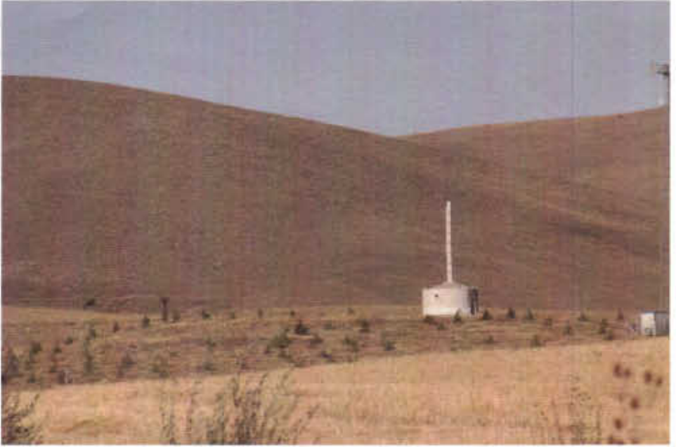
Resim - 12 Salyazı Höyüğü