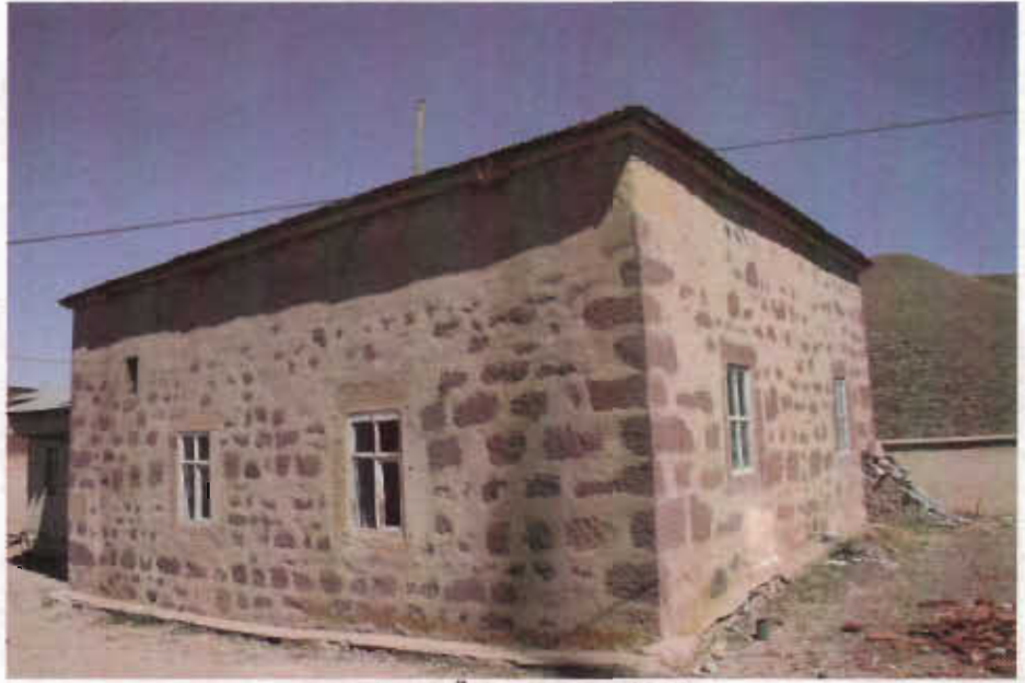
Resim - 5 Özbeyli Köyü Camii