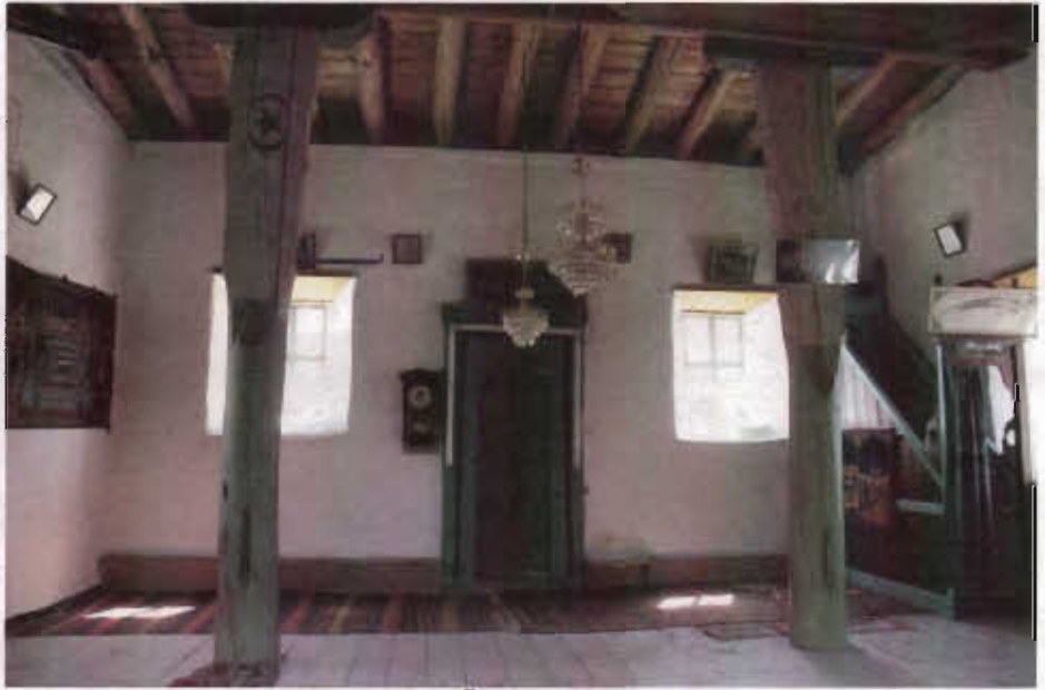
Resim - 6 Özbeyli Köyü Camii