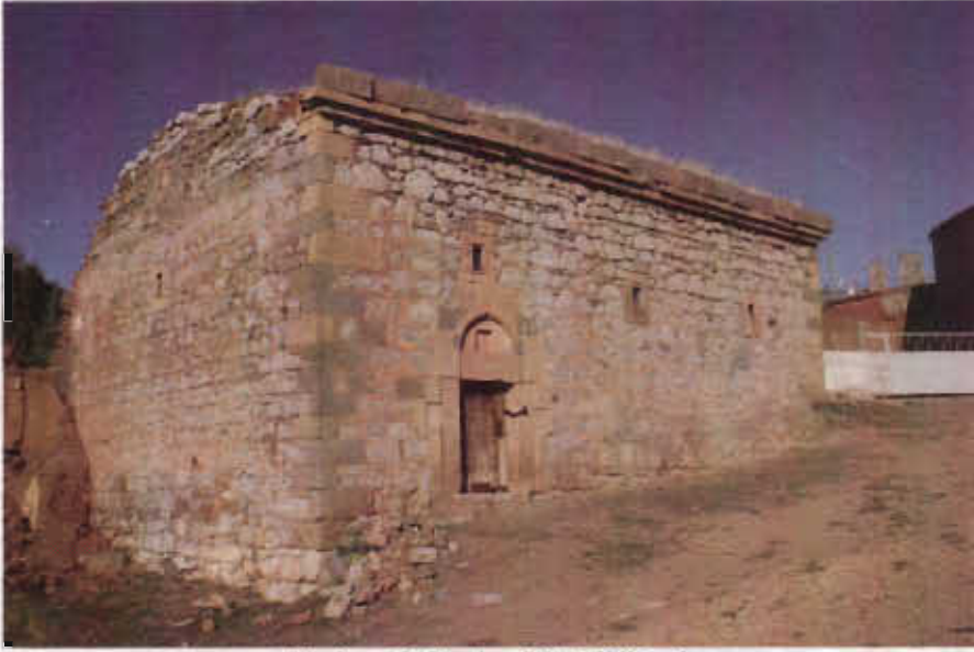
Resim - 13 Yaylım Köyü Kilisesi