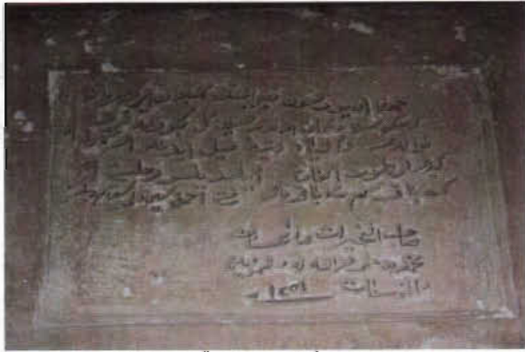
Resim - 8 Örenşar Camii İnşa Kitabesi