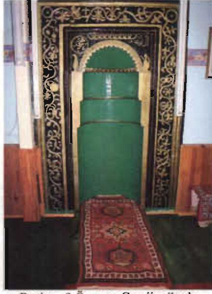
Resim - 9 Öreňsar Camii mihrabı