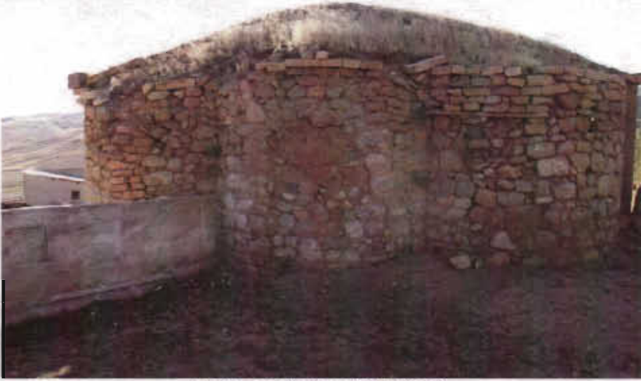
Resim - 14 Yaylım Köyü Kilisesi