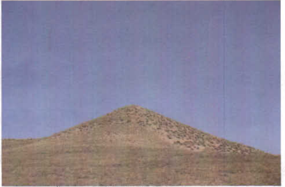
Resim - 4 Maltepe Höyük