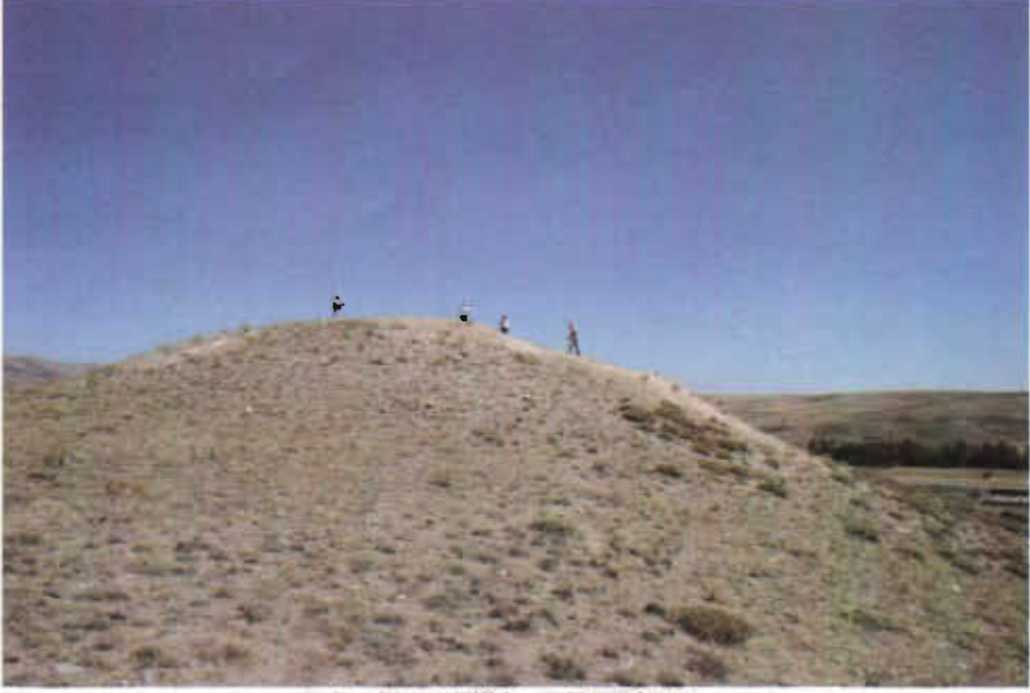
Resim - 1 Tilkitepe Tümülsü