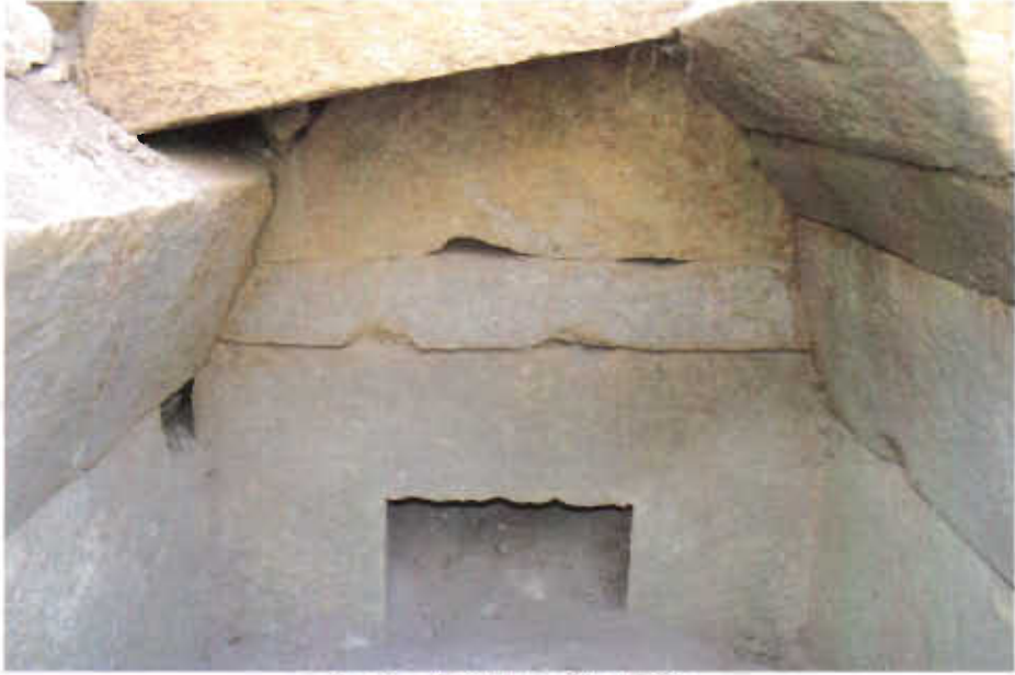
Resim - 2 Tilkitepe Tümülsü