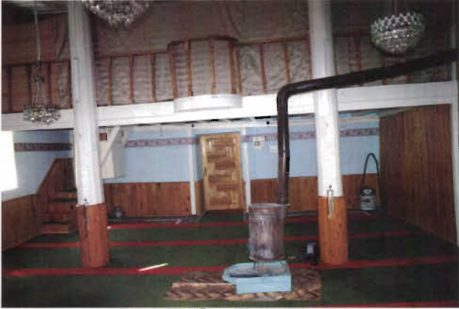
Resim - 10 Öreňsar Camii mahfili