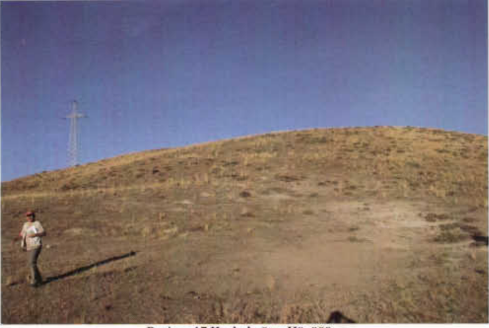
Resim - 17 Kazlarboğazi Höyüğü