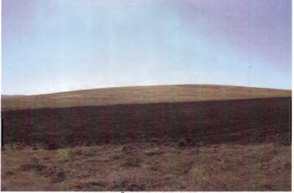
Resim - 11 Öreşar I-II-III Höyükleri