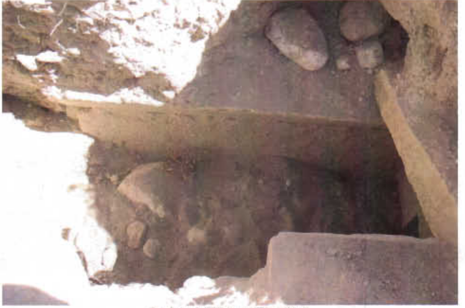
Resim - 3 Tilkitepe Tümülsü