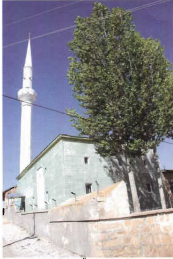
Resim - 7 Örenşar Camii