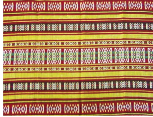
Resim 3: Beledi Dokumaları, Malzeme: İpek Saim Bayrı, 2005.

dokunan Beledi Dokumalarında alt kat astar görevi üstlenmektedir. Desenlerin yer aldığı çizgili kısımlar dışındaki bölümler torba yapıdadır (Resim 3-4). Giysilik, perdelik, çarşaf yüzü olarak dokunan Beledi Dokumalarından günümüzde daha ziyade çanta, dekoratif amaçlı örtü, minder, yastık kılıfı yapılmaktadır. Beledi Dokumalarından son zamanlarda kravat denemeleri de yapılmıştır (Resim 5).