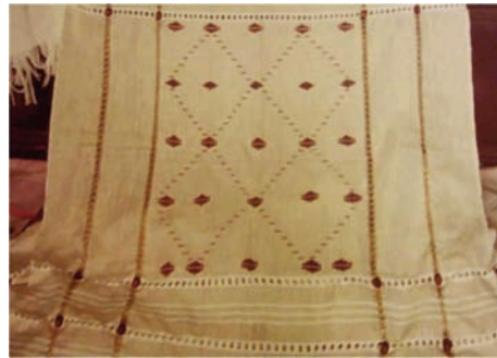
Resim 9: El Dokuma Tezgâhı.