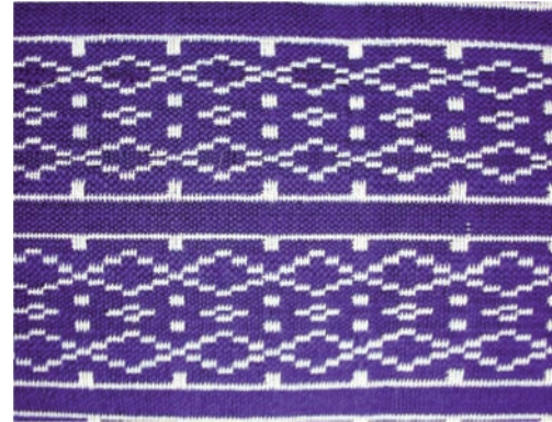
Resim 4: Beledi Dokumaları, Malzeme: Pamuk-orlon, Saim Bayrı, 2005.