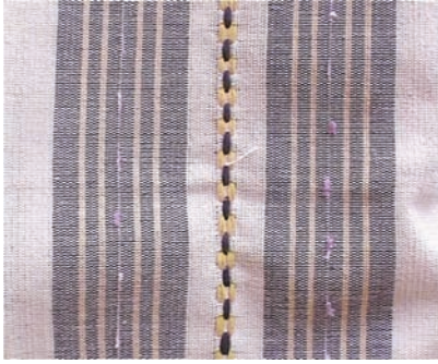
Resim 10: Kızılcaölük Tırnaklısı, Narin Tekstil, Ömer Kartoğan, 2009

Denizli iline bağlı Kızılcaölük’de 600 yıllık bir geçmişe sahip olan dokumacılığın yöreye 1300-1400lerde Kafkaslardan göç ettiği bilinen insanlar tarafından getirilmiş olduğu sanılmaktadır. XVI. asırdan XIX. asrın ortasına kadar ihtiyaçları doğrultusunda düz bez, çul, heybe, kese, çul, giysi amaçlı kumaşlar dokuyan Kızılcaöülüklüler, dokumalarını mekiği el ile atılan ahşap tezgâhlarda dokumuşlardır. XIX. asrın ortasından itibaren desenli alacalar dokumaya başlamışlar, 1870 senesinden itibaren ‘dış elbiselikler’ adı verilen kumaşlar üretmişlerdir. Bugün ise peştamaldan çarşafa, havludan koltuk örtülerine ve dekoratif amaçlı örtülere kadar pek çok ürün dokunmaktadır (Resim 10). Yöre dokumacıları talepler doğrultusunda Kızılcaöülüğe özgü desenlerle birlikte, günün anlayışına uygun yeni desenler de geliştirip, dokumaktadırlar.