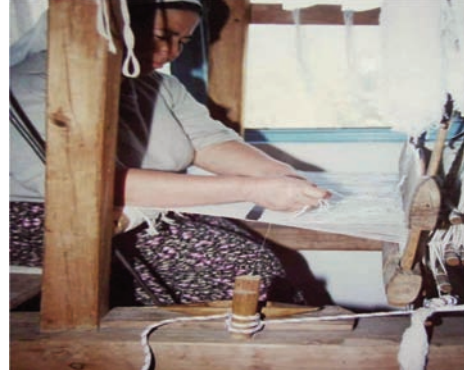
Resim 13: Kamçılı Tezgâh, Üzümlü, 2005.

Düven adı verilen, ahşap, kamçılı iki çerçeveli el tezgâhlarında dokunan DASTAR ve diğer yöre dokumalarının enleri 65- 90 cm arasında değişmektedir (Resim 13).