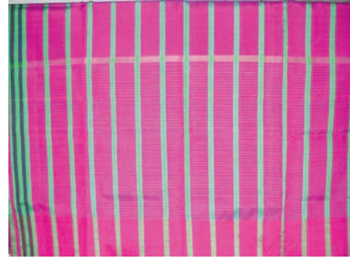
Resim 7: İpek Peştamal, Habip Dışkaya, 2005.

Parça mallardan peştamallar el tezgâhlarında ipekli ve pamuklu olarak dokunmaktadır. Bugün Buldan'da peştamalı %100 ipek olarak dokuyan bir dokumacı kalmıştır. Habip Dışkaya 55 yıldır el dokumacılığı ile uğraşan bugün 80 yaşında olan Dışkaya, dokuduğu ipekli peştamalları zaman içinde Vakko ve Beymen'e satmaya başlamıştır (Resim 7).