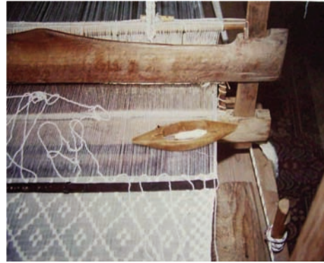
Resim 14: Üzümlü dokuması

Pamuğu geçmişte kendi tarlalarında üretirken, günümüzde genelde Denizliden temin etmektedirler. Üzümlü dokumaları pamuk ipliğinin ham renginde dokunmakta olup, üzerleri ağartılmış pamukla işlenmektedir (Resim 14).