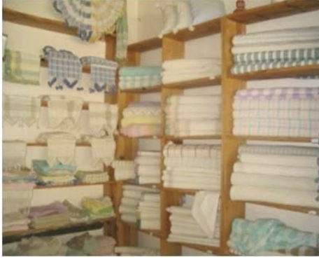
Resim 12: Karacan Atölyesi, 2009.