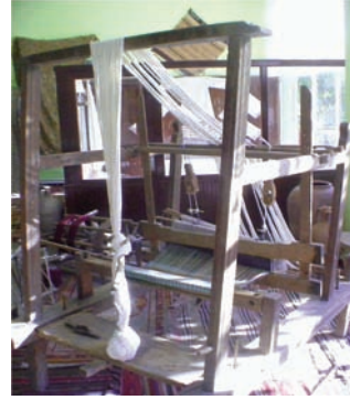
Resim 11: Geleneksel El Dokuma Tezgâhı, Hanife Ahmet Paralı El Dokumaları Tekstil ve Kültür Merkezi, Kızılcaölük, 2010

1940 senesine kadar yoğun olarak kullanılan ahşap tezgâhlar yerini bu tarihten itibaren yarı otomatik tezgâhlara, kısa süre içinde de tam otomatik tezgâhlara bırakmıştır. Yarı ve tam otomatik tezgâhların kullanılmaya başlanması ile birlikte el dokuma tezgâhları unutulmaya yüz tutmuştur (Resim 11).