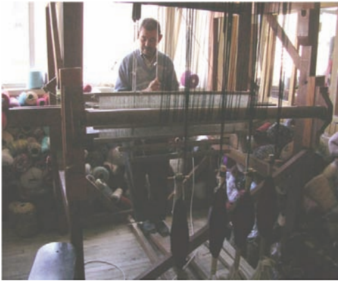
Resim 6: Buldan El Sanatları Merkezi, 2005.

maya başlanmıştır. El tezgâhlarının yerini motorlu tezgâhlar almış, el tezgâhları ile dokuma yapanların sayısı her geçen yıl azalmıştır. 1969 da el tezgâhları ile dokuma yapanların sayısı 1900 iken, 1984 de bu sayı 1500'lere, gittikçe azalarak 432 tezgâha kadar düşmüştür. Bugün Buldan'da aktif durumdaki el dokuma tezgâhı sayısı 40-50 civarındadır (Resim 6). 2005 yılında 180 tanesini jakarlı, geri kalanını armürlü tezgâhların oluşturduğu motorlu tezgâh sayı fabrikalar haricinde evlerde var olanlar ile 3200 idi. Bugün bu sayı başta Çin tehdidi olmak üzere, ekonomik nedenlerden ötürü 1000 adet bile ulaşmamaktadır 10 .