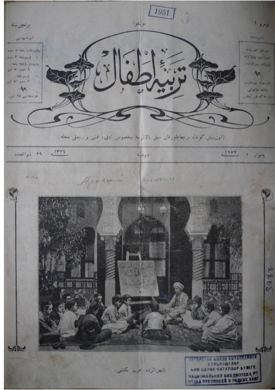
Tebiyetü'l Etfal Dergisi (İsmail Türkoğlu arşivi)

Knigovedeniye , Kuban ve Kubanskaya jizn gibi süreli yayınların editörlüğünü yapmış, 1889’da Moskova Bibliyografya Topluluğu ’nu kurmuş olan Andrey Toropov yönetimindeki bu derginin editor kuruluna seçilen M. Zahid Şamil, uzun yıllar Müslüman bölgelerde basılan yayınların kayıtlarını derledi (Sultanbekov, 2003: 50). Yaklaşık on yıllık çalışmayla 85 dil ve lehçede çıkan 266.000 yayının bibliyografik kaydına yer verilmesi Knijnaya letopis için gerçekten büyük bir başarı oldu.