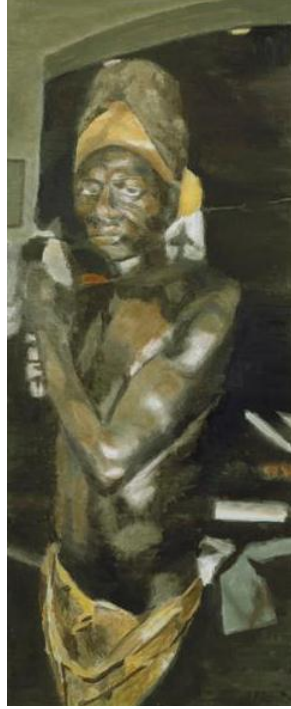
Resim-9. Luc Tuymans, "Heykel", 155x64 cm., tuval üzerine yağlıboya, 2000