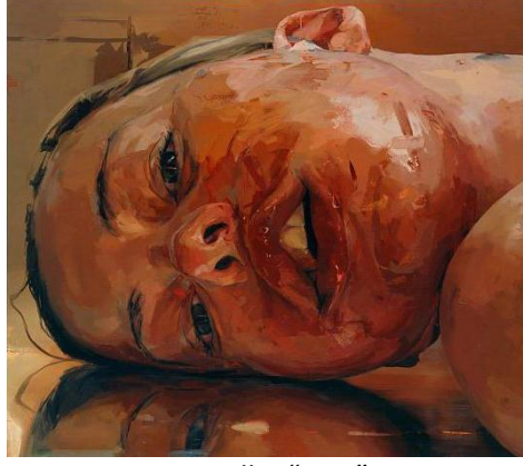
Resim-7. Jenny Saville, "Ters", 320x231 cm., tuval üzerine yağlıboya, 2005

Seville, portre çalışmalarında, insan bedeninin yara alabilirliği teorileri üzerinden rahatsız edici pozlar (ameliyattan çıkmış ya da ameliyata hazırlanan) kullanır, dışavurumcu sayılabilecek fırça vuruşlarıyla espaslar yaratır ve akışkan bir boya katmanı oluşturur. Bu devingen ritim, resimde rahatsız edici bağlamları estetize eden bir uyum yaratır. Oldukça büyük boyutlu resimler karşısında izleyici, kendisini, Paul Ricœur'un 'ters yüz oluş' dediği türden bir trajik eylem olayının ortasında bulur.*