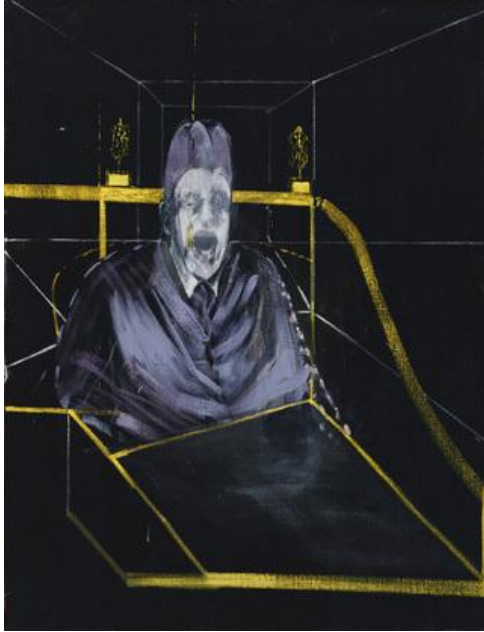
Resim-5. Francis Bacon, "7 Numaralı Portre", 152.3x117 cm., ahşap üzerine yağlıboya, 1953

Birçok resmine kutsal din adamı imgesini çılgın atar vaziyette yerleştiren sanatçı, resim mekânında gerilimler yaratmaktadır. Bacon'un 1946 tarihli "İsimsiz" yapıtı da dâhil olmak üzere birçok kez resimlerinde kesilmiş beden kütleleri kullandığı görülür. Etin nesneleştirilmesine ilişkin olarak kendisini de ölü hayvanlarla kıyaslayan sanatçı, kasaplarda çok vakit geçirerek ete dair hesaplaşmaya din açısından yaklaşır: