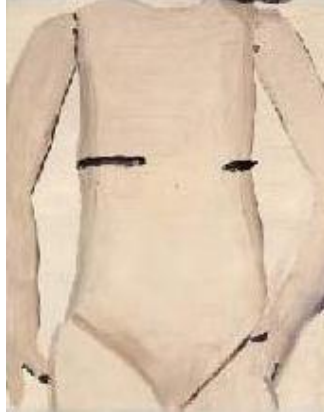
Resim-11. Luc Tuymans, "Beden", 49x35 cm., tuval üzerine yağlıboya, 1990