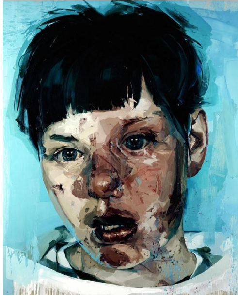
Resim-6. Jenny Saville, “Bakış”, 213.4x243.8 cm., tuval üzerine yağlıboya, 2003

Genç Britanyalı Sanatçılar olarak bilinen sanatçılar içerisinde öne çıkan Jenny Seville*, resimlerinde, insan figürünü yabancılaşmış bir beden olarak değil, kendisini kabul etmiş fakat başka bir şeye dönüşmek isteyen bir organizma olarak görür. Resimlerinde kendisini de bir model olarak kullanan sanatçı, genellikle şişman bayanları, estetik operasyonlarından çıkan insanları, kaza geçirmiş çocukları, komaya girmiş bedenleri konu edinmektedir. Dolayısıyla buradaki beden teorisi, insanın incinebilirliğini, hasar alabilirliğini duyumsatır.