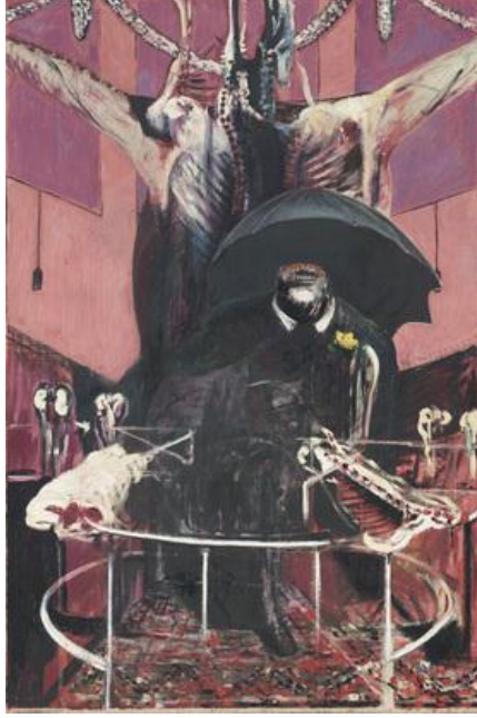
Resim-4. Francis Bacon, "İsimsiz", 197.8x132.1 cm., ahşap üzerine pastel ve yağlıboya, 1946