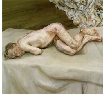
Resim-2. Lucian Freud, "Yataktaki Çıplak Adam", 56,5x61 cm., tuval üzerine yağlıboya, 1987

Freud'un 1987 tarihli yatak serileri başta olmak üzere ve genellikle tüm resimlerinde beden, tıpkı bir atölyede gerçekleştirilen çıplak model çalışmalarını andırır. Ancak buradaki modeller, gündelik yaşamın içinden çıkarılıp bir et yığını olarak sergilenen yabancılaşmış simgesel bedenlerdir. Bireyin yalnızlığına dair keskin psikolojik dürtüleri algılamayı sağlayan yoğun kıvamlı boya katmanları, salaş ve rahatsız edici pozlar ve soğuk renk tonları, biyolojik anlamda yaşayan ama tinsel olarak tükenmiş bir ten teorisi ortaya atar. Modern insanın içine yerleşen yabancılaşma kavramı, Freud'un resimlerinde bedeni cisimleştirir. Üst üste binen ve