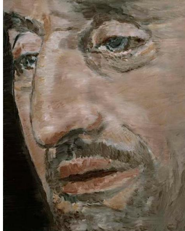
Resim-10. Luc Tuymans, "Burun", 30x24 cm., tuval üzerine yağlıboya, 2002

Tuval üzerinde bedenın etnik ve sosyal kimliđinin baskı yaparak öne ıktıđı, benlik korkularının hissedildiđi resimlerinde titizlikle seilmiş özel soluk renk tonlarını kullanan Belikalı sanatı Luc Tuymans* ise, bedenın politik kimliđini manipüle etmektedir. Örneđin Belika'nın Kongo üzerindeki kolonyalist baskıları sonucunda ortaya ıkan karmaşayı ve bu ikili kltürün biçimlediđi insana dair kareleri anlatı olarak kullanmaktadır. Tuymans'ın portreleri de dahil olmak üzere bir ok resminde yer alan beden heykelsi biçimde ele alınmış ve izleyiciye kendini takdim eder şekilde yerleřtirilmiştir. Anıtsal fakat kusurlu ve köle niteliđi taşıyan bedenler tüm politik içeriđiyle ironik biçimde resim düzleminde nesneleşirler.