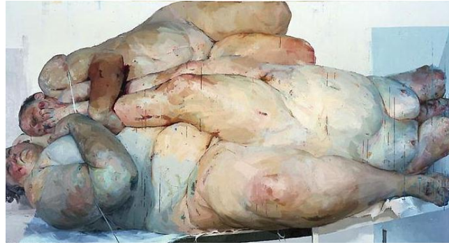
Resim-8. Jenny Saville, "Fullcrum", 261.6x487.7 cm., tuval üzerine yağlıboya, 1999

Seville, portre çalışmalarında, insan bedeninin yara alabilirliği teorileri üzerinden rahatsız edici pozlar (ameliyattan çıkmış ya da ameliyata hazırlanan) kullanır, dışavurumcu sayılabilecek fırça vuruşlarıyla espaslar yaratır ve akışkan bir boya katmanı oluşturur. Bu devingen ritim, resimde rahatsız edici bağlamları estetize eden bir uyum yaratır. Oldukça büyük boyutlu resimler karşısında izleyici, kendisini, Paul Ricœur'un 'ters yüz oluş' dediği türden bir trajik eylem olayının ortasında bulur.*