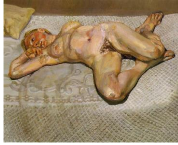
Resim-1. Lucian Freud, "Yataktaki Sarışın Kız", 41x51 cm., tuval üzerine yağlıboya, 1987

1922 doğumlu İngiliz sanatçı Lucian Freud*, yapıtlarında bedeni kimi zaman varoşlardaki evlerin dağınık bir odasına, kimi zamanda gösterişli ama tekinsiz metropol apartmanlarının dairelerine hapseder. Boyayı oldukça yoğun kıvamda kullanması bedendeki gerilimi artırır, tuvalde psikolojik bir tansiyon yaratır. Sanatçı, aynı zamanda bu resimlerinde, geleneksel ressam ve modeli kavramını da çağdaş bir düzleme taşımıştır. Resimlerindeki kurgularda yer alan hayvanlar bile adeta psikolojik bir baskıya maruz kalır.