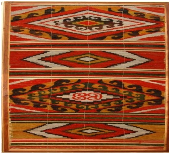
Foto. 2- Geometrik, Kilim Desenli Şiğ Dokuma Örneği.

Kazak Türkleri tarihi anlayışlarına göre beş çeşit hayvanı hayatın dayanağı olarak kabul ediyorlardı. “Koçkar Ata, Oysıl Kara, Zengi Baba, Kambar Ata, Şeksek Ata” bunlar; koyun, deve, sığır, at ve keçinin pirleri olarak bilinirlerdi. “Koçboynuzu, Kırık boynuz, Tek boynuz, Çift boynuz, Devetabanı, Kuşkanadı motifleri” bu düşünceyi ortaya koymaktadır. “Su, İrek, Taşkın ve Derya” motifleri zenginliğin bir işareti olarak kabul edilmiş olup hâlâ günümüzde kullanılan motifler arasındadır 8 . Kamış dokumada genel olarak bu motifler hâkimken, geometrik desenler de kullanılmaktadır (Foto.2).