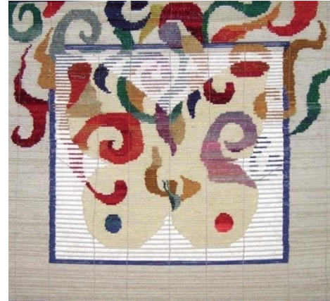
Foto. 3-4- Hayvan Figürlü Şiğ (Kamış) Dokuma Örnekleri (Dr. Kaliolla Ahmetcan).