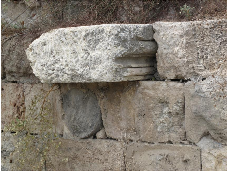
Foto-12. Kalenin Kuzey Sur Duvarında Kullanılan Devşirme Malzemeler.