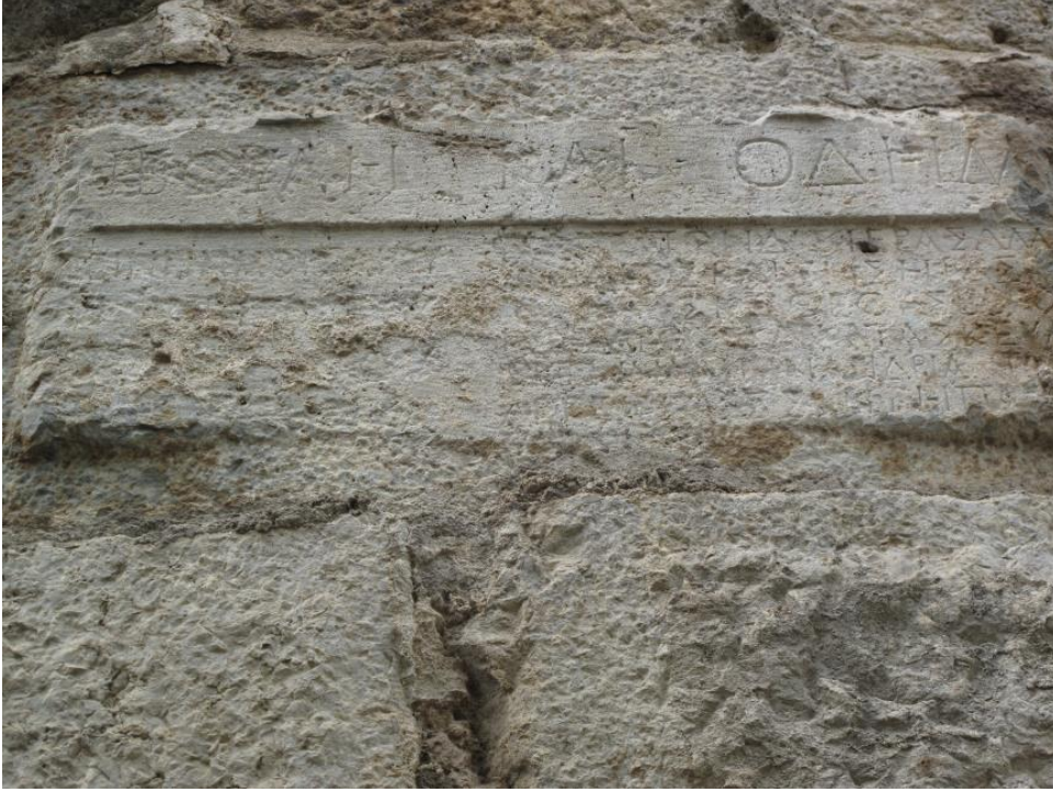
Foto-11. 6. Kısımda Devşirme Olarak Kullanılan Kitabe.