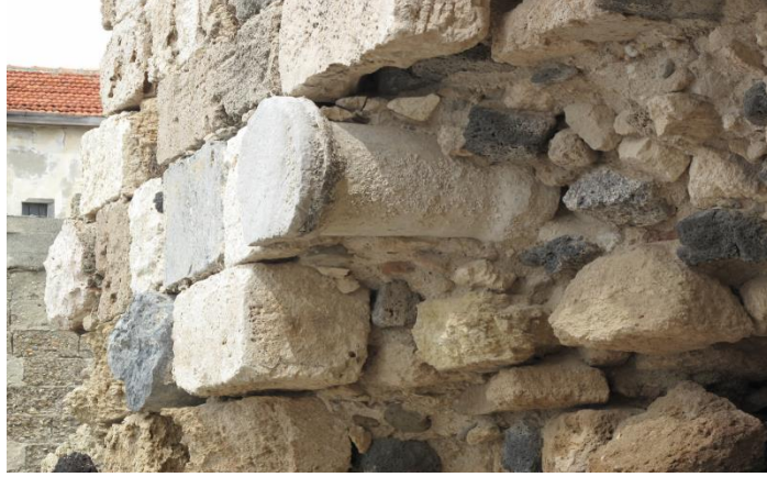
Foto-4. 1. Kısım ile 2. Kısım Arasındaki Roma Mezar Taşı.