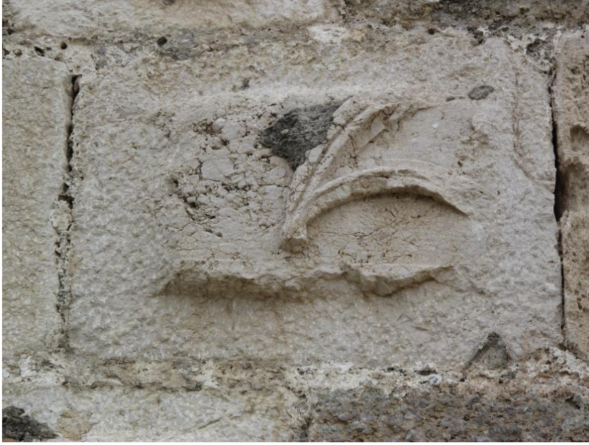
Foto-8. 5. Kısımdaki Palmet Motifli Taş