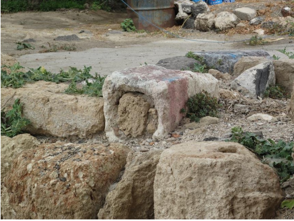
Foto-13. Kale Duvarlarında Kullanılan Dibek Şeklindeki Devşirme Malzeme