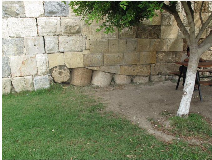
Foto-6. Kısım Batı Duvarındaki Devşirme Malzeme.