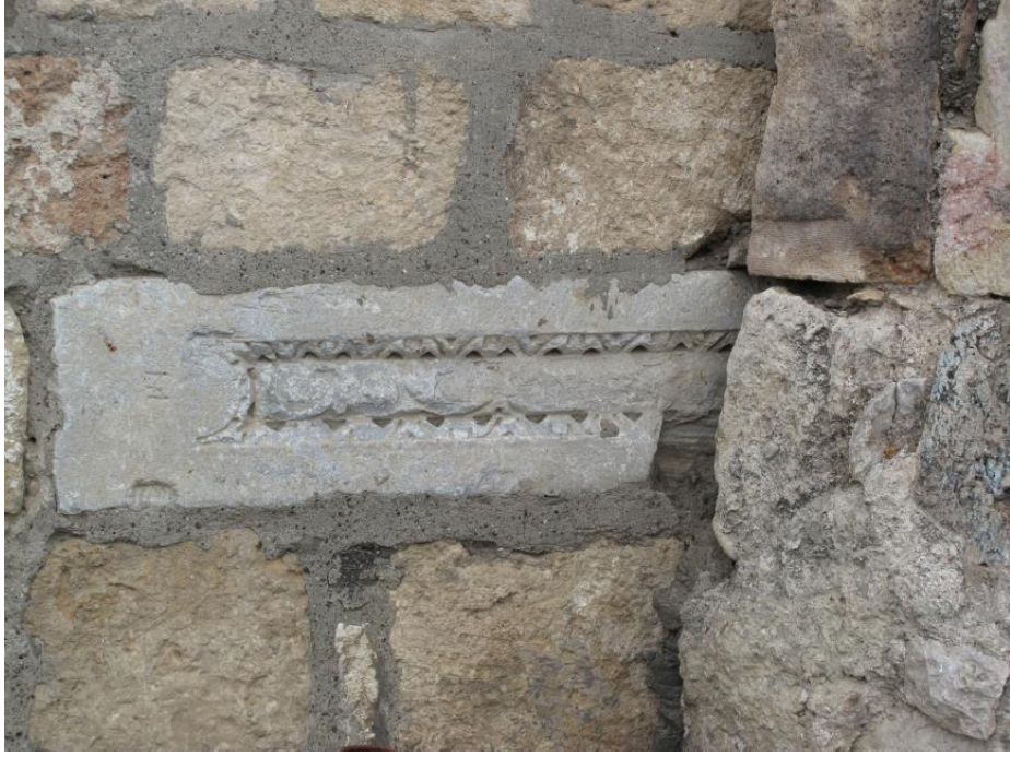
Foto-9. 5. Kısım ile 6. Kısım Arasındaki Lento Devşirme Malzeme.