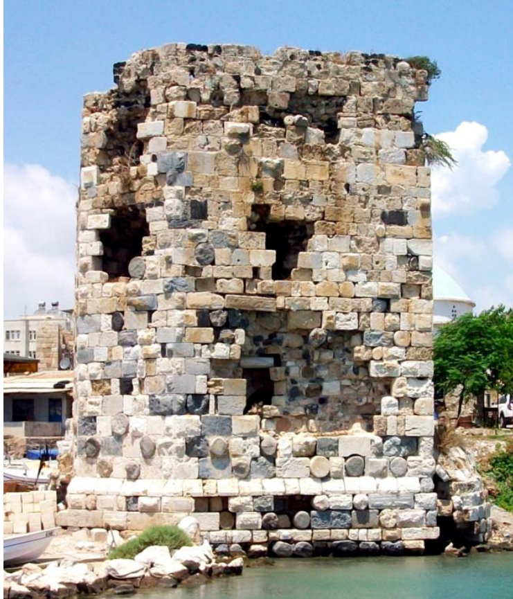
Foto–3. 1.Kısımın Alt tarafında Yoğun Olarak Görülen Devşirme Malzeme