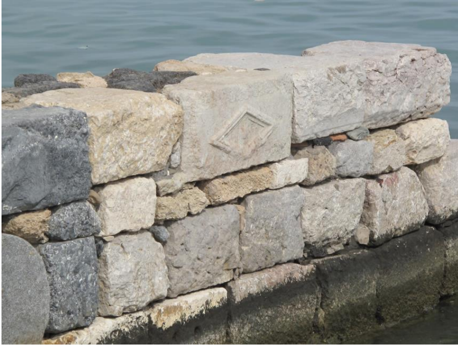
Foto-14. Marko Polo İskelesindeki Baklava Motifli Devşirme Malzeme.