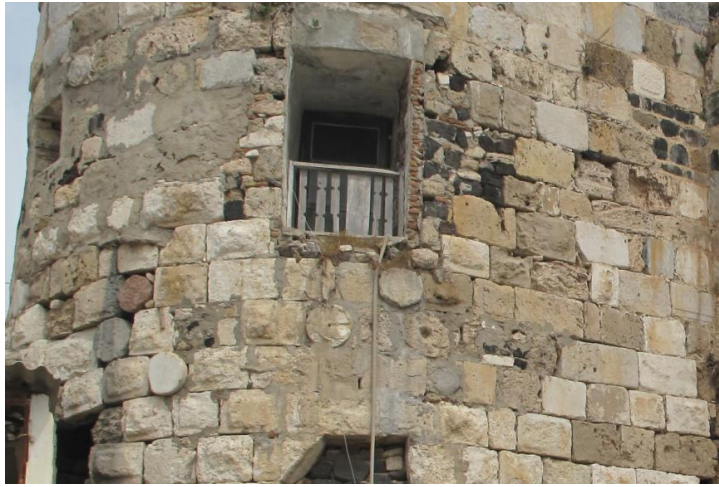
Foto-5. 2. Kısımda Görülen Devşirme Malzeme.