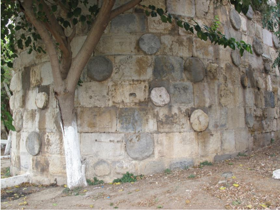
Foto-10. 6. Kısımda Kullanılan Devşirme Malzemeler.