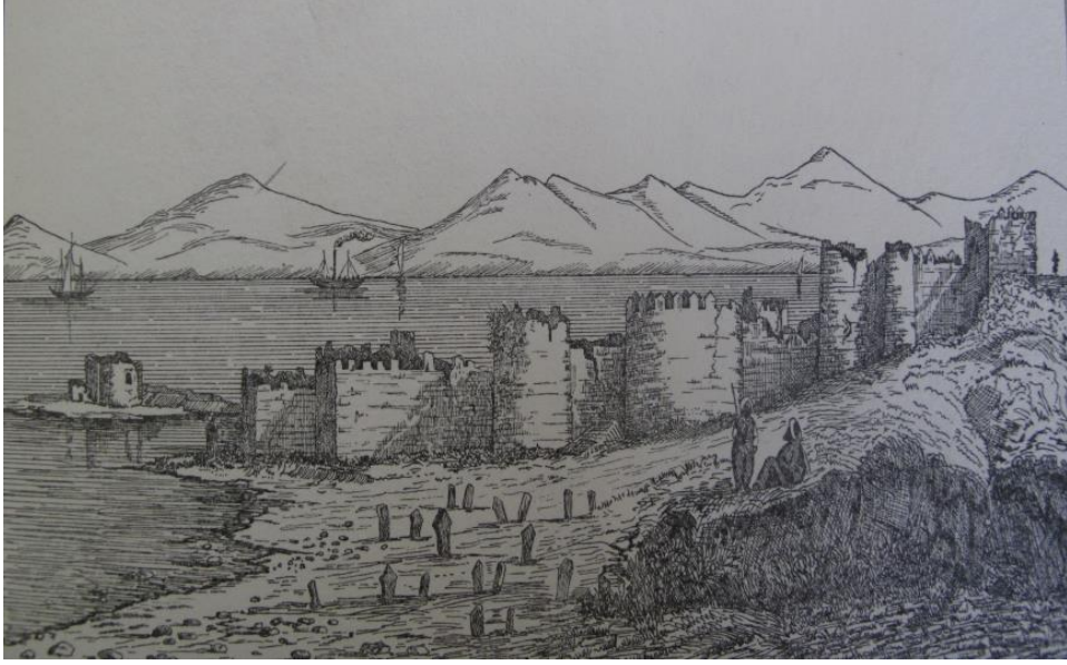
Foto–2. Ayas Kalesi, Langlois'in 1850 Yılında Çizdiği Gravür.