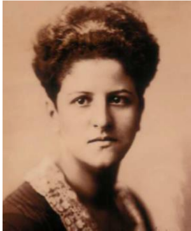
ŞEKİL 1. Şairin gençlik yıllarına ait bir fotoğraf.