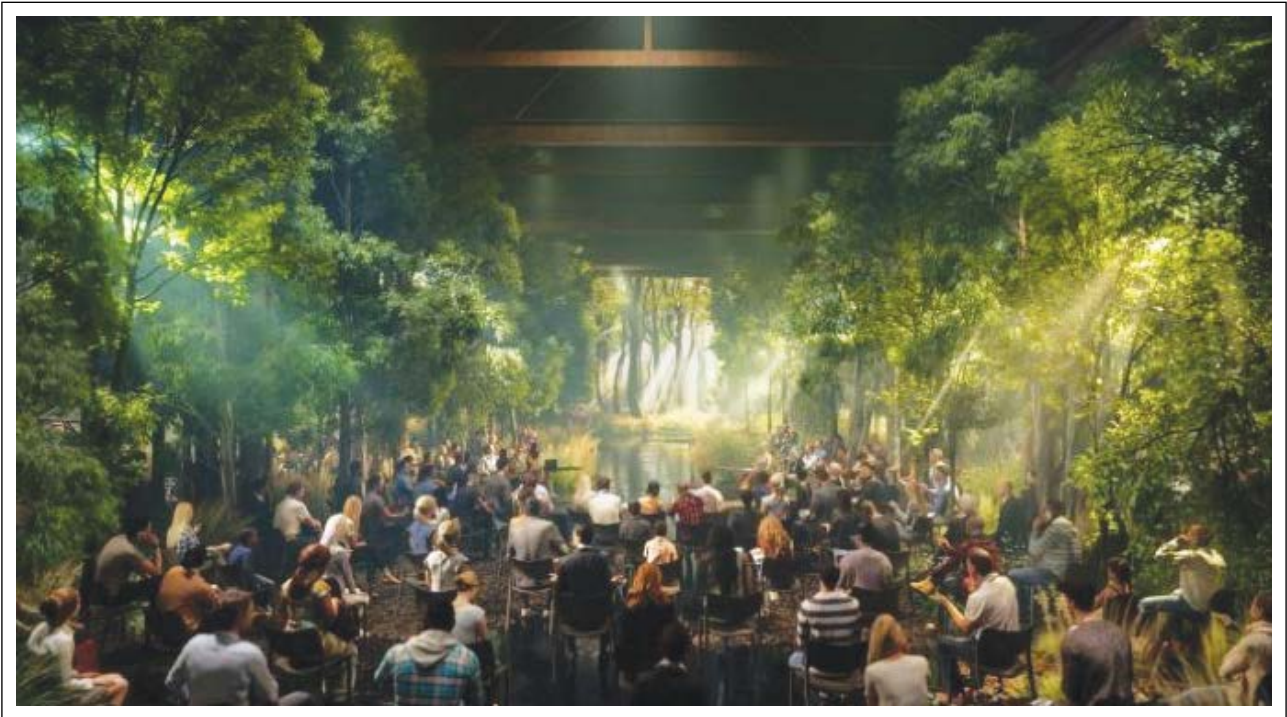
Şekil 10. Es Devlin’in Ağaçlar Konferansı.

Kasım 2021’de Glasgow’da düzenlenen Birleşmiş Milletler iklim konferansı COP26 çerçevesinde sanat ve kültürün rolünü araştıran yeni bir rapor yayımlandı. Küresel iklim konferansında sanatsal ve kültürel aktiviteler yer aldı. Bu anlamda COP, sanatçılara daha çevreyle ilgili yeni bir şeyler yapma şansı verdi (Şekil 10).