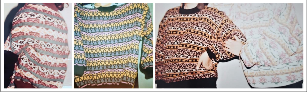
Şekil 4. Penye Triko Kazak Örnekler © Tamer Aslan, SÖKSA 1991–92.