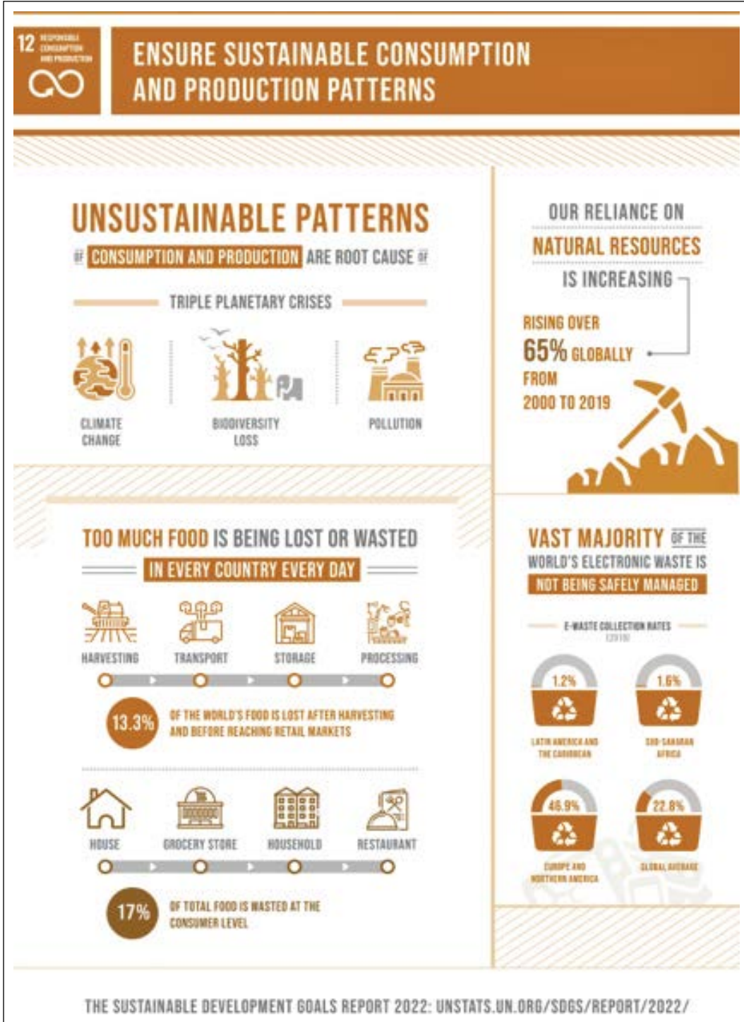
Şekil 1. 2022 Sürdürülebilir Kalkınma Hedefleri Raporu, Madde 12. Sorumlu Üretim ve Tüketim, Sürdürülebilir tüketim ve üretim kalıplarını sağlamak.

rülebilir tüketim ve tüketici davranışları değişim ve gelişimi nedenselliği ele alınmış, çalışmanın ana temasını oluşturan, “Sorumlu Üretim ve Tüketim” sürdürülebilirlik, tüketim ve sürdürülebilir tüketici davranışları ile bu oluşumda sanatın bulunduğu yer ve sürdürülebilir sanat konuları üzerinde durulmuştur.