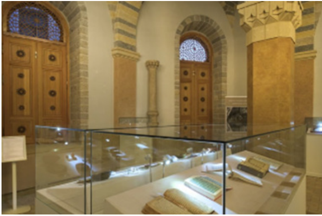
Figür 3: Beyler Camii’nin yeni hali