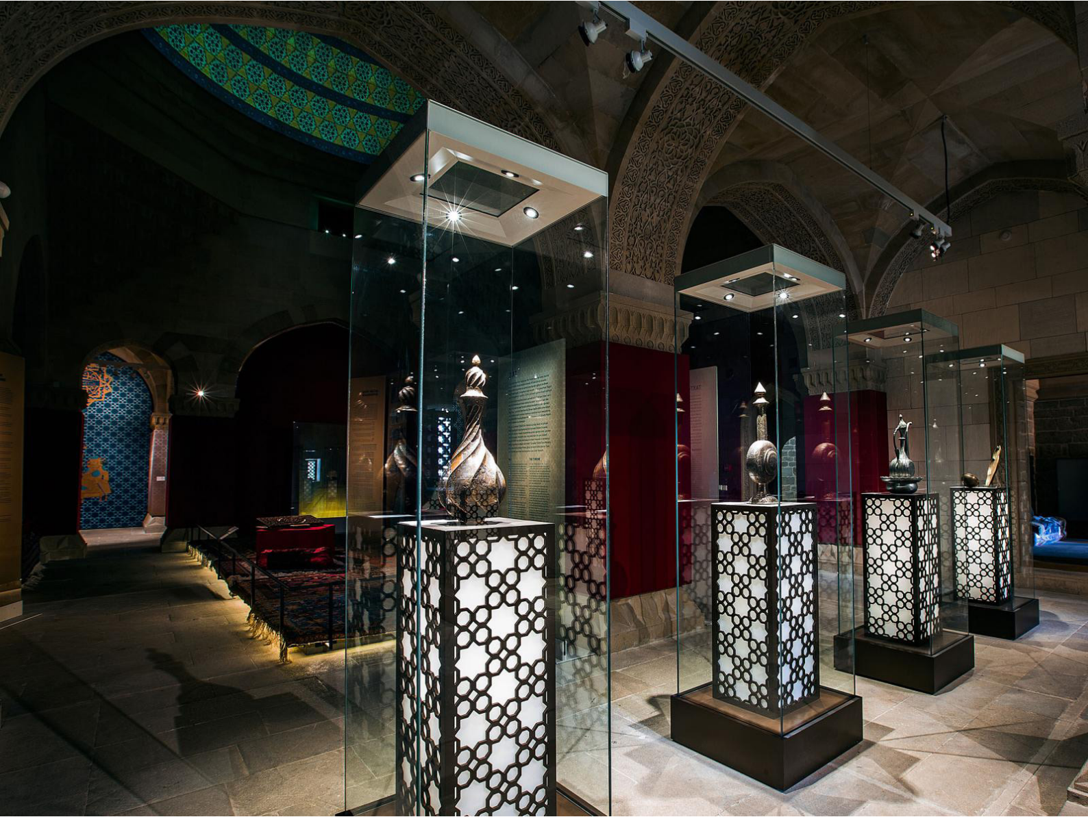
Figür 1: Şirvanşahlar Saray Külliyesinin restorasyondan sonraki hali

kullanılmıştır. Aynı zamanda, saray külliyesinde yeniden yapılanma ve restorasyon çalışmaları da yapılmıştır. 1954 yılından itibaren ise Şirvanşahlar Saray Külliyesi Devlet Tarihi-Mimari Koruma Alanı Müzesi olarak işlev görmeye başlamıştır. Külliye şu anda müze olarak hizmet vermeye devam ediyor. Sarayda turistlere sunulan sergide saray hayatı, mimari, müzik, hat sanatı, etnografya, arkeoloji gibi bölümler yer alıyor. Ayrıca müzede, o zamanlar Şirvanşahların denizden savunma tahkimatı olan "Bayıl Kalesi" sergisi de bulunmaktadır (Figür 1).