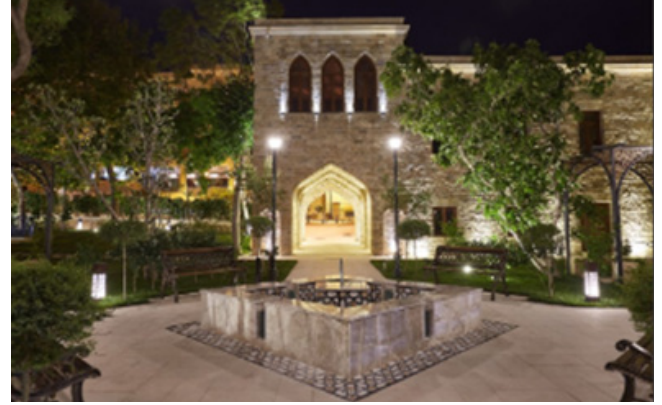
Figür 4: Bakü Han Sarayı Külliyesinin onarım sonrası durumu

ni, yerel halkın yanı sıra turistlerin de ilgisini çekmektedir. Müze bir bütün olarak Bakü hanlarının saray yaşantısını sergilemektedir (Muzeyler hakkında; İbrahimov, 2006, s. 100-112, s. 114-130, s. 138-140; Şirvanşahlar Saray Külliyesi Devlet Tarihi-Mimari Koruma Alanı, 2015; Nezerova, 2019, s. 521-526; “Çin” camii - eski paraların sergilendiği bir yer, 2017; Bakü Han Saray Kompleksi).