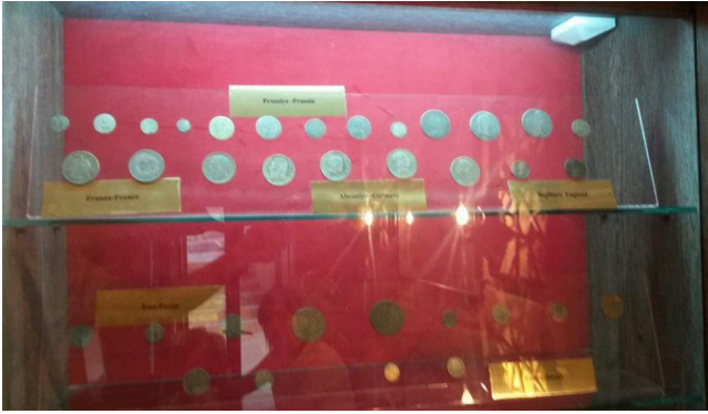
Figür 2: Çin camiinde “Azerbaycan’ın para birimleri” sergisi