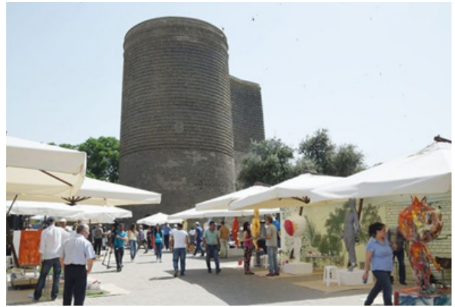
Figür 6: "Kız Kulesi" Uluslararası Sanat Festivali

Uluslararası düzeydeki etkinlikler İçerişehir müzelerinin dünyada tanınması için atılan diğer bir önemli adımdır. Bu tür etkinlikler Kız Kulesi, Şirvanşahlar Saray Külliyesinde yaygın olarak uygulanmaktadır. Böylece 2010 yılından bu yana "Kız Kulesi" Uluslararası Sanat Festivali düzenlenmektedir. Festivalde farklı ülkelerden sanatçılar eserlerini sergiliyor ve burada Kız Kulesi'nin tanıtımı yapılıyor (Figür 6). Festivalde Azerbaycan'ın First Lady'si Mihriban Aliyeva, Haydar Aliyev Vakfı Başkanı Leyla Aliyeva, yabancı ülke temsilcileri katılıyor. 2014 yılında düzenlenen festivalde sokak sanatı, diğer bir deyişle "street art" türleri olarak kabul edilen 3D boyutlu resimler sergilendi.