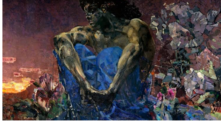
Görsele 6: "Oturan İblis", 1890.

başlayan sanatçı, onu saman içerisinde birçok farklı teknikle betimleyerek her seferinde daha kompleks bir hale getirmekteydi (Reeder,1976, s. 331).