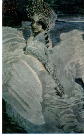
Görsel 8: “Kuğu Prenses”, 1900.

Vrubel’in Rus halkbilimine ait en önemli ve bilinen temalarından biri Kuğu Prenses’dir (Görsel 8). 1900 yılında yapılmış olan bu çalışma, izleyicinin gözünde 1877’deki ilk gösterimi yapılan Tchaikovsky’nin Kuğu Gölü Balesi ile adeta bütünleşmesi sebebiyle özel bir konuma gelmiştir. Yarı kadın yarı kuğu bir görüntüsü olan bu Prenses, sanatçının insan ve doğa arasındaki bağı kurgulayan bir metamorfoz betimlemesidir (Reeder, 1976, s. 330). Soğuk bir kuzey manzarası içerisinde, mücevherlerle kaplı geleneksel Rus başlığı giymiş olan bu genç kızın sahip olduğu görkemli beyaz kuğu kanatları, onun ikili yaşamına vurgu yapar. İri ve izleyiciye doğrudan bakan gözleri, Vrubel’in portreciliğinin en önemli unsurlarından biridir ve kökeni sanatçının Bizans sanatından aldığı etkiye dayanır. Özellikle Aziz Cyrill’de resmettiği bakire tasvirlerinde de bu unsur göze çarpar (Url 3).