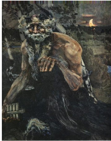
Görsele 7: "Pan", 1889.

Oturan İblis 'te (Görsele 2) Vrubel'in resmettiği, şiirin başlangıcındaki iblisteki boşluk ve ümitsizliğin görsel betimlenmesidir. Kristalleştirilmiş renkler de yine iblise ait soğuk bir cansızlık ve sterillik ortaya koymaktadır. İblisin arzu eksikliği ve potansiyel enerjisi arasındaki çatışma, yüzündeki melankoli, vücudundaki kaslar ve kenetlenmiş parmaklarında ifadesini bulmaktadır (Reeder,1976, s. 331). Şeytani ya da kötücül görünmemekte olan bu figürün güçlü duruşu ve uzaklara bakan ciddi bakışları vardır. Vrubel'in kendisi iblisi, "erkek ve kadın görünüşlerini birleştiren, acı çekmek kadar kötü olmayan ve yaralı bir ruh, güçlü ve asil yönü olan bir varlık" olarak tanımlamıştır. İblisin kötü bir varlık olduğuna dair dini görüşü reddettiğine şahit olduğumuz bu çalışmada sanatçı, iyi ve kötü ya da İsa ve İblis arasındaki sınırların bulanıklaşmasını sağlamıştır (Ural 3). Bu bakış açısıyla bireyin kendisine, onun manevi var oluşuna odaklanmak, dinin belirleyiciliğine tercih edilmiştir.