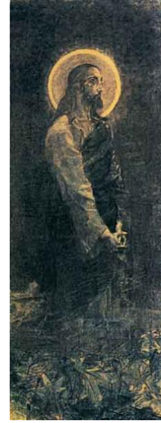
GörSEL 5: "İsa Gethsamene'de", 1888.

Zaman içerisinde gerek doku oluşturmada gerekse ifadeyi ortaya çıkartmada kişisel tarzını yaratan sanatçı, çağdaşlarından ayrılmaktaydı. Sanatında belirli bir renk paleti oturmaya başlıyordu. Bu dikkat çeken renkler; genel olarak mavinin belirli tonları, mor, pembe ve soluk yeşildi ve oluşturduğu mozaik dokusuna katkıda bulunmaktaydı (Reeder, 1976, s. 327).