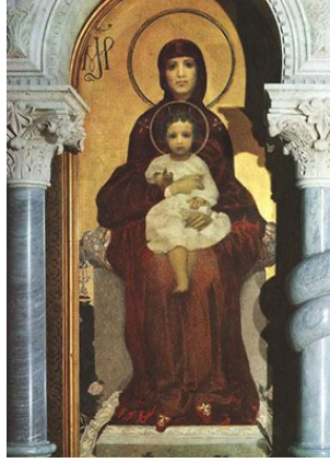
Görsel 1: “Bakire ve Çocuk”, 1884

Sanatçının çoğu çalışmasında bu süslemeci biçimsel tavrın yanı sıra ruhsal yönden zengin içerik ve sembolik anlatım dili göze çarpar.