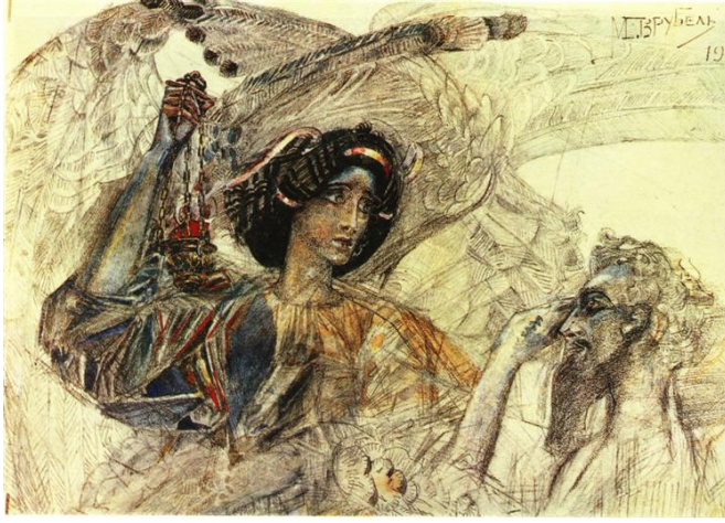
GörSEL 4: "Altı kanatlı Seraphim (Melek)", 1905.