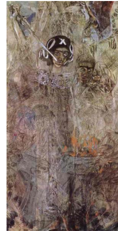
Görsel 3: “Peygamber Ezekeil’in Vizyonu”, 1906.