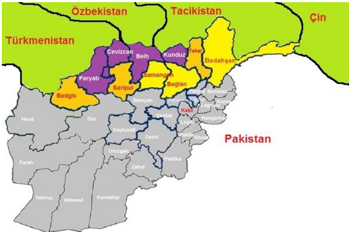
Afganistan Haritasında Güney Türkistan Bölgesi

bu vilayet Afganistan'ın birkaç idari biriminden biri olup günümüzdeki Belh, Cevizcan, Faryab, Saripul, Kunduz ve Bedahşan illerini kapsıyordu. 1890 yılında Katağan-Bedahşan Vilayeti Türkistan Vilayetinden ayrılmış olsa da bu vilayet 1929 yılına kadar idari bir birim olarak varlığını korumuştur. Daha sonra 1946 nüfus sayımı ile beraber Türkistan vilayeti haritadan kaldırılmış ve yerine Katağan vilayeti getirilmiştir. "Katağan, yakın zamana kadar, Afganistan'ın şimdiki Bağlan, Kunduz ve Tahar vilayetlerini içeren tek bir vilayeti idi" (Slobin, 1976, s. 19). Kuzey Afganistan'da geniş ve verimli toprakları kapsayan Katağan vilayeti de 1963 yılında günümüzdeki haliyle Bağlan, Kunduz, Tahar ve Bedahşan vilayetlerine bölünmüştür. Eskiden Türkistan veya Katağan-Bedahşan vilayeti olarak anılan Kuzey Afganistan bölgesi, günümüzde daha küçük birimlere ayrılarak birkaç vilayete ayrılmıştır. Günümüzde Afganistan idari birim olarak 34 vilayete bölünmektedir. Bu 34 vilayetten ülkenin kuzey kısmını oluşturan 10 vilayette Türk nüfusu çoğunluktadır. "Bu bölgede Türkçe bilen biri dil sorunuyla karşılaşmaz" (Oğuz, 2001, s. 44). "Afgan Türkistanı, küçük hanlıklar halinde XIX yüzyılın sonlarına kadar bağımsızlığını korumuş ve Kabil yönetimine tam olarak bağlanmamıştır. Türkistan, Buhara Han'ı ile Kabil Emiri arasında tampon bir bölge idi" (Slobin: 1976, s. 18).