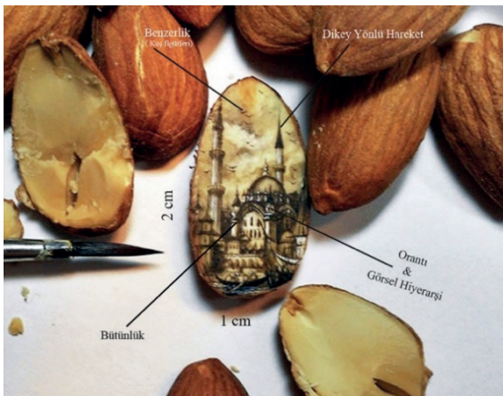
Görüntü 3: Badem İçi (@hasankale_microangelo)

Pirinç farklı kültür, toplum ve inanca göre mitsel anlatıya sahip olduğu bilinmektedir. İslam dininde pirinç bir kudsiyet de atfedilir; gül gibi, onun da Hazret-i Peygamber'in nurundan yaratıldığına inanılır. Yerken salavat getirilir; getirmeyene hatırlatılır. Bu nedenle yemekte tek bir pirinç bile ziyan edilmez. Pilavsız sofraya düşünülmez (Kapucu, 2015). Bu bağlamda Anadolu'da da pirinç çok özel bir yere sahiptir. Sanatçılar toplumların kültürel belleğinin taşıyıcısı olarak kabul edilmektedir. Hasan Kale'de Türk toplumunda özel bir yere sahip olan pirinç tanesine Atatürk portresini çizerek Atatürk'ün hem Türk toplumu için ne kadar önemli ve özel bir kişi olduğunu hem de siyasal ve kültürel bir bellek ikonu oluşuna metaforik yaklaşımda bulunmuştur. Ayrıca pirinç tanesinin aynı zamanda kendi tohumu olması asaleti temsil ederken ve tek taneden birsen fazla tanenin çoğalması bereketi temsil etmektedir. Bu çıkarımdan yola çıkarak Hasan Kale bu çalışmasında Atatürk'ü asalet ve bereketin metaforu olarak çizerek Atatürk'ün hatırası unutulmayacak ve fikirleri de devamlı yenden yeşererek çoğalacak mesajını vermektedir.