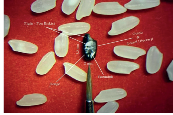
Görüntü 2. Pirinç Tanesinde Atatürk Portresi (@hasankale_microangelo)

Her sanatçının ortaya koyduğu eserler vasıtasıyla kendini ölümsüzleştirme isteği bu çalışma özelinde Hasan Kale'de görülmemektedir. Çünkü sanatçı kısa ömürlü olduğunu bilmesine rağmen çizimini kelebeğe çizerek kalıcı olmayı hedeflememiştir. Çalışmada özellikle tarihi eserleri resmetmesi sanatçının izleyicilere paradoksal içeriğe sahip bir mesaj vermek istediği görülmektedir.