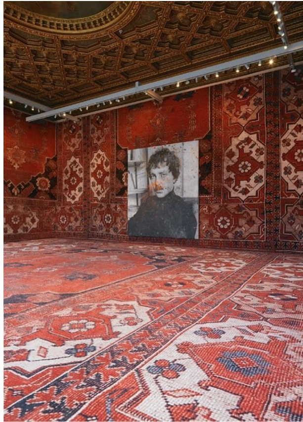
Resim 1 Rudolf Stingel, Untitled (Franz West) 2011 1 (Yellow Trace, 2022a).

Geleneksel anlamdan sıyrılmak suretiyle her iki sanatçıda var olan hazır nesnelere seçen ve yeni yapı içinde farklı bir anlama kazandırmak suretiyle estetik bir sanat anlayışına (klasik akademik kurallara) karşı çıkarak hedef kitlenin aklına ulaşma çabası içindedir. Böylece geleneksel temsilden uzak ancak ondan istifade etmek suretiyle yeni sanat eserine dönüşüm sağlamaktadır. Bu disiplinler arası bir sanat anlayışı ve aynı zamanda transpozisyon ile kullanılabilir sanat malzemesi haline dönüşümdür halının. Heykel sanatı ile mekân anlamında ortak gibi görünse de enstalasyon-yerleştirme sanatı adı altında sanatçıların çalışmaları mekân ile doğrusal bir iletişim kurmaktadır.