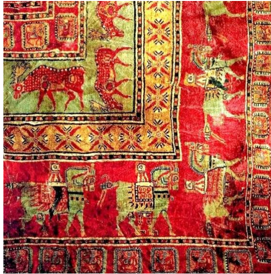
Resim 3 Pazırık Halısı, detay 3

Eski Sovyetler Birliği sınırları içinde bulunan Altaylar bölgesinde Türk tarihi açısından önemli bir keşif gerçekleşmiştir. Araştırmaları Sovyet arkeolog Sergei Ivanovich Rudenko tarafından yapılan, Altaylar bölgesinde M.Ö. III. yüzyıla ait sakinlerinin bırakmış oldukları otuzdan fazla sayıda bulunan beyler zümresine ait kurganlarda, zengin sanat eserleriyle birlikte bir de halı bulunmuştur. 1.89 x2 m boyutlarında bulunan, üzerinde biniciler, sığırlar ve hayâli yaratıklardan griffon figürlerinin yer aldığı bu çok sık dokunmuş halının bir desimetre karesinde 3600 ilmek bulunmaktadır. Kurganlarda bulunan halının Orta Asya ve Anadolu Türk kültüründe manevi dünya içinde anlam ve önemi olduğunun kanıtıdır. “Pazırık Halısı” olarak bilinen dokumanın yüzeyinde yer alan renk ve motiflerin tasarımlarına bakıldığında mekân ve izleyici arasında bir iletişim kurmak amaçlı olduğu anlaşılmaktadır. Türk halı sanatının önemli temel özelliklerini taşıması bakımından incelendiğinde;