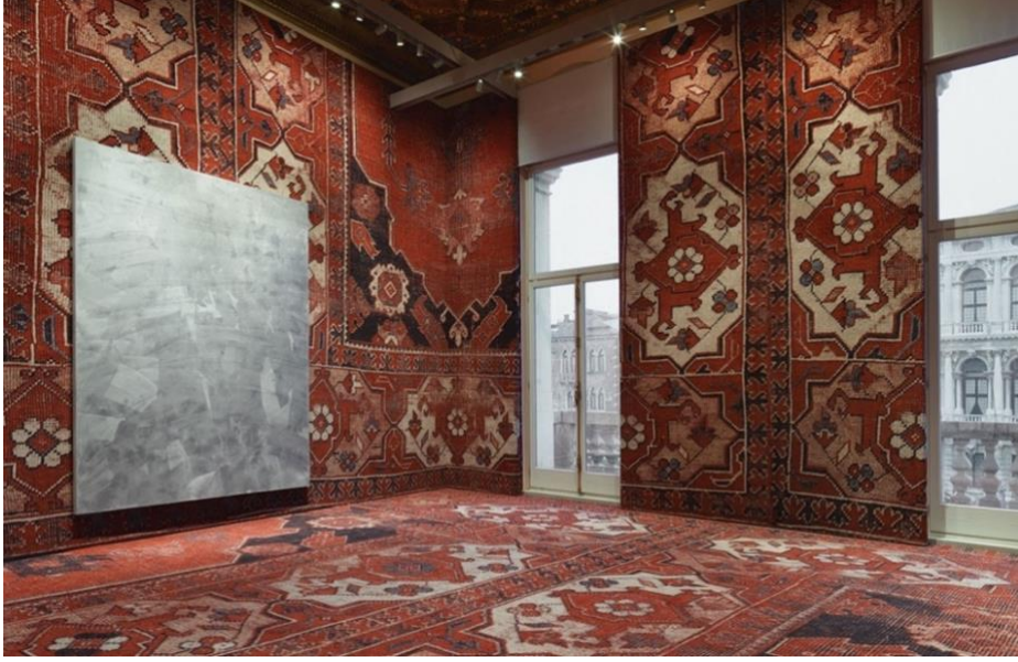
Resim 2 Rudolf Stingel, Untitled 2012. Installation view at Palazzo Grassi 2 (Yellow Trace, 2022b).

Türklerin dünyaya bir armağanı olarak tanımlanan ve Dünya Kültür Mirasına ait en önemlisi ve tekstil malzemesiyle üretilmiş parçalardan birisi de halı sanatıdır. Bulunmuş ilk örneği “Pazırık Halısı” olarak kabul edilmektedir. Orta Asya Türk kültürüne baktığımızda sedir, taht, duvar gibi yüzeyler üzerine uygulama yaptıklarını, yere sermediklerini görürüz. Bin yıla varan yaygın kültürünün mekân içinde kullanımına aslında aslında sanatçı Rudolf Stingel (bilinçli mi bilinmez) sergileme yöntemiyle gönderme yapmıştır. Tekstil ürünü olan yün, ipek, pamuk gibi malzemelerin kök boya gibi doğal-canlı malzemeler ile renklendirilmesine ek olarak kültürümüzün yaratıcı desen tasarımları zenginlik kazandırmıştır. Desenlere yüklenen anlamlar Anadolu insanının üzüntülerini, sevinçlerini, yaşam hikâyelerini farklı ve zengin semboller aracılığı ile halıya aktarmak sureti ile ilginç bir iletişim aracı haline getirmişlerdir. Sosyolojik anlamda önemli bir güç göstergesi, statü işaret, olmuştur.