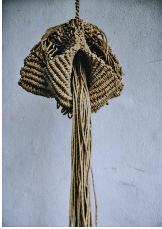
Resim 6 70x 1.45 cm “Amfora”

Düğümleme sadece halı, kilim, zili ve benzeri tasarımlarda yüzey kaplama malzemesi üretiminde kullanılmaz. Aynı zamanda farklı halı dokumalarına ait metotları ve yöntemiyle tekstil sanatçılar yaratıcı-ilginç formlar elde edilebilir. Kostüm, tekstil ve fotoğraf sanatçısı Sefa Çeliksap tarafından 1992 tarihinde düğümleme yöntemiyle gerçekleştirilmiş amfora isimli mekân düzenleme çalışması halı düğümleme tekniğidir. Verilen görsel örnek aslında Türk halı sanatına ait bir düğüm olan “sine” tekniğinin farklı bir yöntemle uygulanması ve halı formu dışında da ilginç bir uygulaması olarak karşımıza çıkmaktadır.