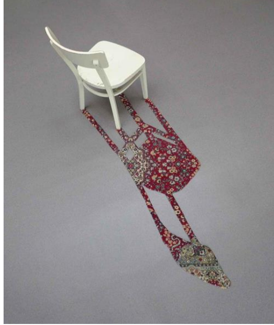
Resim 8 Chair & Carpet 4 (Şakir Gökçebağ, 2020)

“Şakir Gökçebağ enstalasyon sanatçısıdır. Estetiği ve kavramsallığı bir arada kullanmaktadır. Dünyaya öngörülemeyen bir renk ve şekil vermenin sonsuz olanaklarını göstermek için ev eşyalarını bağlamalarından ve işlevlerinden kurtarmaktadır. Çalışmalarında radikal erişilebilirliği ve ince mizahını yakalamak oldukça mümkündür. Bahçe hortumlarını, kovaları, elmaları veya lastik çizmeleri kullanmaktan sakınmayan Şakir Gökçebağ, elbise askılarını, halıları uçuyormuş gibi büküp, tuvalet kâğıdı rulolarından zarif şekiller çıkartmaktadır. Tam olarak bu şekillerin günlük nesnelere doğasında olduğu izlenimi doğrudan bize aktarılsa da bu fikir birçok kimsenin aklından geçmeyen basit ama etkili bir düşünce yapısına sahiptir. Eserlerinde yaratıcılığı ve sadeliği benimsemektedir. Gündelik nesnelere, dönüşümlerinden sonra bile tanınabilir durumda kalmasını sağlar. “Bunun için Gökçebağ’ın deyişiyle “evrensel nesnelere” ihtiyacı vardır. Dünyanın hangi köşesinde olursa olsun ister ayakkabı ister şemsiye ya da bir meyve, herkes onları bilmelidir. Herkese dokunabilmeli, o nesneyle izleyici arasında bir geçit sağlamayı hedeflemektedir.” (Şakir Gökçebağ, 2020’a).