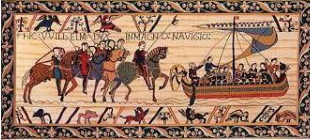
Resim 5 Bayeux Halısı (Alnur Ceyhan, 2018)

Romanesk döneminin en büyük ve en iyi korunan resimsel yapıtlarından biridir.