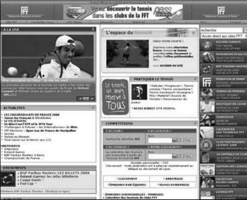
Fransa Tenis Federasyonu Web Sayfası