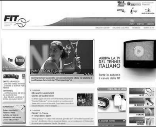
İtalyan Tenis Federasyonu Web Sayfası