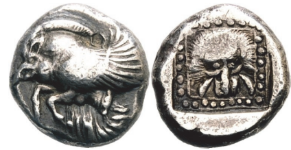
Abb. 4) Samos, Drachme, um 525, 3,52g, 14mm. Größe 2:1

Löwenmasken finden sich bevorzugt in Orten, die dem Herakles (oder einem anderen Löwentöter) in besonderer Weise verbunden sind, verweisen sie doch zumeist auf dessen erste und vielleicht berühmteste Aufgabe: das Töten des nemeischen Löwen, also im übertragenen Sinne das Zurückdrängen der ungebändigten Natur, der Unordnung. So auch in Samos, wo wir das Münzmotiv, möglicherweise zum ersten Mal überhaupt, zum Ende des 6. Jhs. vorfinden (Abb. 4).