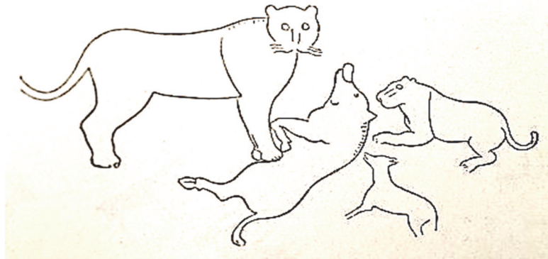
Abb. 2) Umzeichnung der Felszeichnung von Kef Messoullier, Algerien

Was den Frontallöwen hingegen vom Gorgoneion unterscheidet, ist der Fundus an dahinterliegenden Bildaussagen. Das Gorgoneion als Teil eines Fabelwesens bedarf einer Mythologie. Es kann zwar als Fratze auch ganz allein eine Wirkung entfalten, benötigt aber eine Erklärung beispielsweise dahingehend, ob es als komisch, verschreckend oder „apotropäisch“ aufzufassen sei oder ob eine mythologische oder sogar politische Referenz vorliegt. Das Bedeutungsspektrum des Frontallöwen dagegen kann abhängig sein von mythologischen Referenzen verschiedenster Art, aber auch weitgehend frei von diesen und hauptsächlich auf die tierischen oder dämonischen Qualitäten bezogen sein.