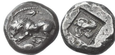
Abb. 48) Nordgriechenland? Stater, 520-480, 17,16g, 24mm.