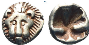
Abb. 13) Ionien, Milet, 1/48 Stater, Elektron, Mitte 6. Jh., 0,26g, 5mm. Foto: Roma Ltd. (Auktion e77, 2020, 530; Savoca (Auktion 148, 2022, 171)). Größe 4:1

Das Bildmotiv des Löwen setzte in Milet bereits eine Münzgeneration früher ein. Diese Münzen weisen allerdings seitliche Löwendarstellungen auf oder bringen Tatzen zur Darstellung. Frontale Löwendarstellungen werden dann charakteristisch für die etwas später anzusetzenden, kleineren Elektronmünzen, die mit Sicherheit von Milet stammen (Abb. 13-14), und sie bleiben auch in der frühen Silberprägung der Stadt erhalten 43 .