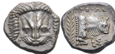
Abb. 36) Tetradrachme, Samos, 380/365, Mag. Pythion, 15,07g, 24mm.

Für die bereits oben angesprochene Tatsache, dass die leblose Löwenmaske sehr häufig mit Herakles verknüpft ist, sei abschließend ein besonders verwinkeltes Beispiel angeführt, das zudem veranschaulichen soll, auf welche Weise dabei auch andere Gottheiten involviert sein können.