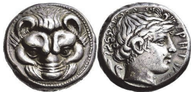
Abb. 19) Rhegion, Tetrdrachme, 415-387, 17,27g, 24 mm. Foto: Peus Nachf. (Auktion 433, 2022, 1073)