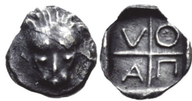
Abb. 17) Pantikapaion, Tetartemorion, 4. Jh., 6mm, 0,12g.

Auch hier scheint man der Ansicht gewesen zu sein, dass sich das Wesen der Gottheit am besten durch frontale Löwenköpfe mit besonders hervorgehobenen Augen, die vermutlich wieder auf den solaren Aspekt des Apollon rekurrieren, ausdrücken lässt. Bei einigen Exemplaren fallen überdies die markanten Stirnwarzen des Leu auf, die möglicherweise ebenfalls auf dessen solaren Charakter abheben 74 . Für Pantikapaion liegt zudem der besonders seltene Fall vor, dass die durch das Münzbild evozierte Gottheit im Revers angesprochen wird: Einige Emissionen weisen dort die Legende ΑΠΟΛΑ auf (Abb. 17). Möglicherweise steht dies mit einer von Anokhin vermuteten Münzprägestätte im Apollonheiligtum in Verbindung 75 .