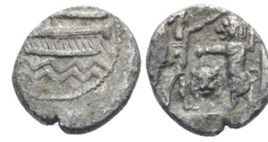
Abb. 26) Samaria, 4. Jh., Obol (1/16 Shekel), 0,8 g, 10 mm. Größe 2:1

In solchen Darstellungen des kämpfenden Großkönigs findet Zenzen „ideales Königtum als solches dargestellt“ 95 . Die dabei gewählte Frontalperspektive des Löwen dürfte zwei Funktionen gehabt haben. Zum einen scheint damit die Bedrohlichkeit des Raubtiers hervorgehoben zu sein 96 , womit zum anderen die besondere Stärke des Großkönigs veranschaulicht wird.