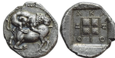
Abb. 50) Makedonien, Akanthos, Tetradrachme, 430-390, 14,09g, 26mm.