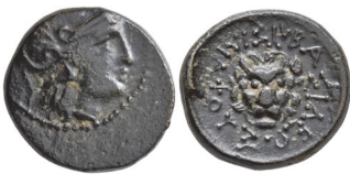
Abb. 32) Lysimachos, Bronze, 306/281, 0,98g, 10mm. Größe 2:1

Grundgerüst dieser Begebenheit und weist darauf hin, dass, Lysimachos darauf eine fabula aufbaute, die, das findet sich dann bei anderen Autoren, im Kern aus der Behauptung bestand, Alexander habe Lysimachos mit einem Löwen zusammen in einen Käfig sperren lassen und der Somatophylax habe den Leu getötet 115 . Deren Verbreitung war so erfolgreich, dass auch Seneca, Plinius d. Ä., Pausanias, Justin und Lukian diese oder Anspielungen darauf in ihre Werke aufnahmen. Diese literarisch überlieferte Selbstdarstellung war eng verzahnt mit der Münzprägung. Auf den Münzen des Lysimachos begegneten Löwen in verschiedener Form. Löwenköpfe und -protomen wurden als Beizeichen all seiner Edelmetallprägungen weidlich genutzt 116 . Im Buntmetall begegnen sie nicht nur als solche, sondern bilden auch den Reversstyp dreier Bronzeemissionen 117 . Unter diesen Reversdarstellungen sticht der hier abgebildete durch Frontalität besonders hervor (Abb. 32). Bei diesen Kleinbronzen bildet ein Löwenkopf mit halb aufgerissenem Maul und weit geöffneten, kugelförmigen Augen das Zentrum der Darstellung, umgeben von einer Legende (ΒΑΣΙΛΕΩΣ ΛΥΣΙΜΑΧΟΥ), die mit der Mähne verwoben zu sein scheint. Dieses Münzbild ist auch für die an kraftvollen Darstellungen nicht arme hellenistische Zeit von außergewöhnlicher Intensität und lässt den Avers, die im Profil dargestellte Schutzgöttin des Königs, Athena, verblasen.