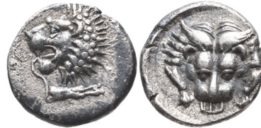
Abb. 16) Karien, Mylasa, Hemiobol, unter Hyssaldomos (400-392), 0,51g, 8 mm. Größe 3:1

Bereits die Gesamtschau der Münzprägung dieser Polis macht es deutlich, dass der Löwe auch hier das Begleittier Apollons ist. Das zeigt sich besonders an den Motivkombinationen dieses Tieres mit einem (oft frontalen) Apollonkopf 69 und einem „Stellate pattern of Milesian type“ 70 . Epigraphisch ist der Kult des Apollon Delphinios durch eine Inschrift mit der Darstellung eines auf einer Stange befestigten Delphins bezeugt, und so wird man schließlich auch die Delphindarstellungen auf den Kleinbronzemünzen mit diesem Kult verbinden können 71 .