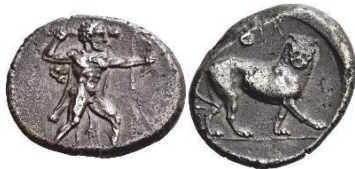
Abb. 35) Issos (?), 4. Jh., Stater, 10,35g, 22mm. Foto: NAC (Auktion 114, 2019, 276)