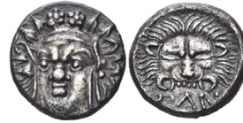
Abb. 8) Pantikapaion, Hemidrachme, ca. 375-350, 2,49g, 18mm.

Nordöstlich, auf der Taurischen Chersones, erfolgte, ähnlich wie auf Sizilien, ein Bildwechsel, allerdings von einem lebendigen Kopf hin zu einem Skalp. Die dort gelegene milesische Kolonie Pantikapaion setzte auf ihre frühen Münzen den aus Ionien importierten Löwenkopf 40 (Abb. 17-18), während spätere, unter der Dynastie der Spartokiden geprägte, Münzen gelegentlich eine Löwenmaske zeigen (Abb. 8).