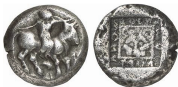
Abb. 38) Stater, Kreta, Gortyn, ca. 470 132 , 11,74g, 22mm. Foto: Künker (Auktion 136, 2008, 61)