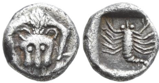
Abb. 15) Karien, Mylasa, Hemiobol, ca. 450-400, 0,53 g, 7 mm. Größe 3:1

die, von Menschen aufs Äußerste gereizt, sich „zum Sprunge zurecht“ legen 66 . Es ist eine Angriffshaltung, die auch bei Hauskatzen zu beobachten ist, und das Tier in äußerster Spannung zeigt, also – im Falle einer Großkatze – einen Moment höchster Gefahr darstellt, den die Frontalperspektive perfekt einfängt. Für die Chimaira, ein besonders gefährliches, in der Hauptsache aus einem Löwen bestehendes Mischwesen, ist diese Haltung mit nach vorn durchgedrückten Vorderbeinen und abgesenktem, sprungbereitem Torso, charakteristisch 67 . In genau dieser Haltung wird dann auf den Tetradrachmen des Hekatomnos der nach rechts stehende und brüllende Löwe dargestellt 68 . Den Prägeverantwortlichen von Mylasa, so wird man schließen dürfen, war es besonders darum zu tun, die Spannkraft des Löwen darzustellen, welcher von einem auf den anderen Moment zum todbringenden Angriff überzugehen im Stande ist. Doch wofür steht der Löwe in Mylasa?