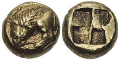
Abb. 45) Ionien, Phokaia, Hekte, 521-478, 2,63g, 13mm.

beigemessen wurde, mag sich vielleicht auch darin zeigen, dass diese auch in späteren und spätesten Kopien des Motivs, beispielsweise auf augusteischen Denaren, beibehalten wurde 162 .