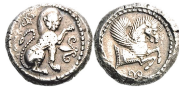
Abb. 28) Lykien, Amm(...), Stater, 480/460, Tlos (?), 9,22g, 22mm.

Auch wenn die im Revers dargestellte Pegasosprotome vordergründig den in Lykien angesiedelten Bellerophonmythos anzusprechen scheint, wird man den ins Monströse verzerrten Löwen doch nicht als Chimaira ansprechen können. Vielmehr ist in diesem Münzbild eine eigenständig lykische Bildschöpfung zu sehen, der sich auch der Dynast Khinakha (ca. 470-440) in seiner umfangreichen Münzprägung bediente, die zahlreiche Tiermotive aufweist 100 . Indes sind persische Einflüsse nicht zu leugnen 101 : Als engster ikonographischer Verwandter findet sich ein in Sardeis gefundener, vermutlich achaimenidischer Siegelstein (Abb. 29). Bei der Gestaltung des „Schwanzstachels“ konnte sich der Schöpfer des Münzbildes von assyrischen (und vermutlich auch achaimenidischen) Vorbildern inspirieren lassen 102 .