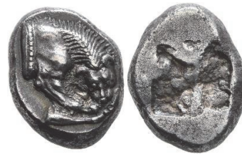
Abb. 46) Velia, Drachme, 535-465, 3,89g, 14mm. Größe 2:1