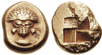
Abb. 3) Kyzikos, EL-Stater, 500-475, 16,0g, 23mm. Lefzen gespalten, Augen ungewöhnlich klein.

Blick des Löwen, sind die Augen doch erloschen. Diese Bilder auszusondern, bereitet oftmals Probleme, zumal die Beschreibungen in der numismatischen Literatur hier nicht durchweg verlässlich sind. Zudem gibt es einige wenige Fälle von Prägeherren, die beide Motive verwendet haben, wenn auch nicht gleichzeitig, sondern nacheinander.