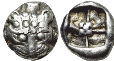
Abb. 41) Parion (?), Drachme, ca. 500, 3,87g, 14 mm. Größe 2:1

Ein erst in den letzten zehn Jahren zutage getretener Münztyp 143 scheint eine These Frobenius' zu bestätigen, wonach Löwe und Gorgoneion in ihrem dämonischen Wesen eng miteinander verbunden sind 144 . Die aktuell in wenigen Dutzend Exemplaren bekannten Münzen tragen auf der Vorderseite den nahezu bildfüllenden Kopf einer Löwin. Die geschlechtsspezifische Ansprache wird dadurch möglich, dass auch ein Teil des Rückens oberhalb des Kopfes zu erkennen ist, der im Falle eines Löwen von der Mähne verdeckt wäre 145 . Was bislang nur auf wenigen Exemplaren klar zu erkennen ist, ist die Strukturierung des Stirnbereichs der Löwin. Auf unserem Exemplar (Abb. 41) scheinen sich darauf zwei weitere, kleinere Löwenköpfchen abzuzeichnen, deren markanteste Erkennungszeichen die übergroßen, kugeligen Augen sind. Diese Vervielfachung des Motivs erinnert strukturell an das oben besprochene Beispiel und den oben behandelten Fall von Lesbos (Abb. 33), die möglicherweise auch dazu beitragen sollten, den dämonischen Charakter hervorzuheben.