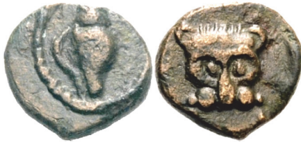
Abb. 31) Dynast Mithrapata . Bronze 390/370 v. Chr., unbestimmte Münzstätte. 0.83g, 9mm. Größe 3:1

schaftssymbol, als das sie in den bekannten lykischen Monumenten wie bspw. dem Inschriftenpfeiler von Xanthos zu verstehen sind? 106 In Verbindung mit dem oben erwähnten lydisch-achaimenidischen Siegel und angesichts des Mangels an historischem Hintergrundwissen zu den lykischen Dynasten scheint dies die momentan befriedigendste Deutung zu sein. 107