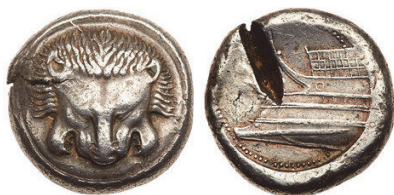
Abb. 5) Zankle, Tetradrachme unter samischer Besatzung, 494/493, 17,23g, 25mm.

Mit samischen Flüchtlingen gelangte das Motiv tief in den Westen, wo es sich auf den Münzen der von diesen eingenommenen Stadt Zankle 38 findet (Abb. 5). Sehr bald nach dieser kurzen Episode findet es sich, allerdings verändert hin zu einem lebendigen Löwenkopf, in der nunmehr in Messana umbenannten Stadt (Abb. 6). Auf diese Weise, so scheint es, gelangten also zunächst die Bilder getöteter Löwen auf unteritalische Münzen, um bald darauf (Leontinoi, Rhegion) „reanimiert“ zu werden und diese Region, in der das Tier gar nicht heimisch war, zu erobern.