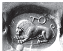
Abb. 29) Abdruck eines Siegels mit Löwenmotiv, Fundort: Sardeis. Archäologisches Museum Istanbul, Inv. 4839.