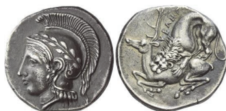
Abb. 53) Abb. 53, Velia, Nomos, 420-410, 7,74g, 21mm.