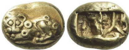
Abb. 55) Hekte, lydisch-milesischer Fuß, unbest. Münzstätte, 7./6. Jh., 2,33 g, 14mm. Größe 2:1

Leoparden ( πάνθηρ , panthera ; πάρδος , pardalis ) sind aufs Engste mit Dionysos verbunden 165 . Besondere Faszination übte offenbar ihr geflecktes Fell aus, das von Dionysospriestern getragen und mit dem Sternenhimmel assoziiert wurde 166 .