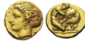
Abb. 34) Syrakus, AV-20 Drachmen, 405-400, 5,77g, 19mm.

Eine andere Wirkungsabsicht dürfte sich hinter der Frontalität verbergen, die am folgenden Münztyp zu beobachten ist (Abb. 35). Es handelt sich um eine rare Emission kilikischer 123 Statere, die unter achaimenidischem Einfluss geprägt wurden und im Avers den mit Keule und Bogen bewaffneten, weit ausschreitenden Herakles zeigen, während auf der Rückseite der Nemeische Löwe nach rechts schreitet und dabei den Betrachter zu fixieren scheint. Hierbei ist jedoch zu beachten, dass diese beiden Münzbilder besonders eng miteinander verbunden sind, gewissermaßen unmittelbar miteinander korrespondieren. Man könnte auch mit Fischer-Bossert von einer Drehszene 124 sprechen, bei dem wir, ähnlich einem Daumenkino, zuerst den laufenden Helden sehen und dann den Löwen, der gerade auf diesen aufmerksam geworden ist. Der Blick bzw. die Aufmerksamkeit des Löwen gilt also keinesfalls dem Betrachter, sondern Herakles. In diesem speziellen Fall ist die Frontalität als erzählerisches Stilmittel eingesetzt, um die beiden Münzbilder in unmittelbare Beziehung zueinander zu setzen. Diese Deutung lässt sich durch eine Gegenprobe stützen, der die fiktive Annahme zugrunde liegt, der Löwe im Revers blickte (wie gewöhnlich) nach rechts (also nach vorn): Vom Eindruck des aufgeschreckten Tiers wäre dann nichts mehr übrig.