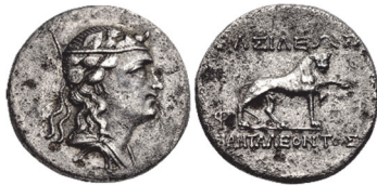
Abb. 57) Baktrien, Pantaleon, Kupfernickelimitation, ca. 185-180, 8,16g, 22mm. Foto: CNG (Auktion Triton 22, 2019, 455)

Typs werden ebenfalls versuchsweise mit der milesischen Münzprägung in Verbindung gebracht 169 , doch wäre aufgrund der Leopardendarstellung einer Prägeautorität mit einem bedeutenderen Dionysoskult Vorrang zu geben (Abb. 56) 170 .