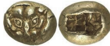
Abb. 12) Hekte, wie oben, 2,33 g, 15mm.

Das Bildmotiv des Löwen setzte in Milet bereits eine Münzgeneration früher ein. Diese Münzen weisen allerdings seitliche Löwendarstellungen auf oder bringen Tatzen zur Darstellung. Frontale Löwendarstellungen werden dann charakteristisch für die etwas später anzusetzenden, kleineren Elektronmünzen, die mit Sicherheit von Milet stammen (Abb. 13-14), und sie bleiben auch in der frühen Silberprägung der Stadt erhalten 43 .