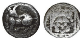
Abb. 39) Kreta, Phaistos, Drachme, ca. 470, 19mm, 5,79g.: Bibliothèque nationale de France, département Monnaies, médailles et antiques, 1966.453.2406.

Auch ein andere Münztyp wurde mit den attischen Löwentetradrachmen verbunden – was bei eingehender Betrachtung allerdings abzulehnen ist 133 . Ein Stater von Gortyn auf Kreta zeigt auf der Vorderseite Europa auf dem Zeusstier beim Überspringen des Bosporos, während auf der Rückseite ein frontaler Löwenkopf in einem Quadrat zu sehen ist (Abb. 37). Die zugehörigen