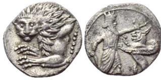
Abb. 25) Kilikien (?), Hemisiglos, 2. Hälfte 4. Jh., 2,88g, 10mm. Größe 2:1

Bildidee stärker komprimiert: Hier befindet sich zwischen dem Herrscher und dem Löwen ein emblemartiger, frontaler Löwenkopf (Abb. 26).