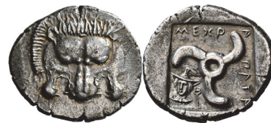
Abb. 10) Lykien, Mithrapata, ca. 390/370 Stater, 9,68g, 23mm. Foto: Peus Nachf. (Auktion 428, 2021, 299)

Das Wechselspiel zwischen Löwenkopf und -maske veranschaulicht, dass beide keine grundverschiedenen Bildmotive sind. Die jeweils gewählte Darstellungsweise unterstreicht indes ein Verlangen nach Eindeutigkeit: Masken stellen den Löwen primär als Opfer dar, während frontale Köpfe lebendiger Löwen deren dämonisch-göttlichen Eigenschaften hervorheben wollen oder besonders kraftvoll und vital wirken sollten.