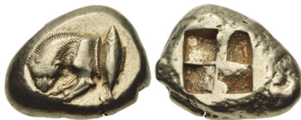
Abb. 49) Mysien, Kyzikos, Stater, 550-450, 16,08g, 22mm. Foto: CNG (Auktion 120, 2022, 283)