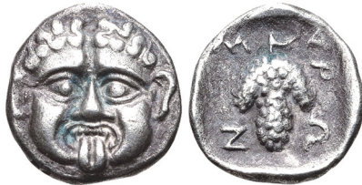
Abb. 42) Maroneia. Circa 432-425/4 BC. Obol, 9mm, 0.72 g. Größe 3:1

winnenkopf als Vorstufe des Gorgoneions ausmachen, indem er anführte, dass ein Löwinnenstempel sukzessive zu einem Gorgoneionstempel umgraviert worden sei. Der Beweis hierfür scheint mir indes nicht erbracht worden zu sein. Festzuhalten ist aber in jedem Fall, dass es eine Prägestätte gab, die diese beiden Typen entweder parallel oder innerhalb kurzer Zeit herstellte. Aufgrund der von Snible angeführten bulgarischen Fundprovenienzen besteht auch berechtigter Zweifel daran, dass dies Parion gewesen sein muss 148 . Aufgrund der unsicheren Lokalisierung und der kaum gesicherten Datierung verbieten sich Überlegungen zur konkreten Bedeutung des Münzbildes. Verwiesen sei jedoch auf ein Gorgoneion aus dem thrakischen Maroneia, dessen markante Stirnfurche etwas Löwenartiges hat und somit dazu dienen kann, die Ähnlichkeit von der Gegenseite her zu illustrieren (Abb. 42).