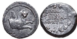
Abb. 58) Seleukiden, Antiochos VI. Dionysos, Bronze, 6,48g, 17mm.