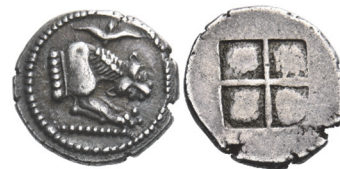
Abb. 52) Makedonien, Akanthos, Tetrobol, 480-470, 2,37g, 11mm. Größe 2:1