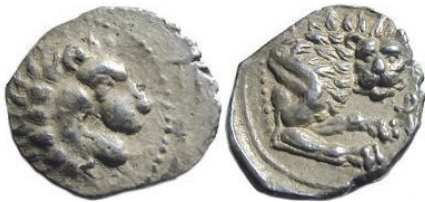
Abb. 27) Zypern, Amathos, König Rhoikos, ca. 350, Tetrobol, 2,12g. 13mm. Größe 2:1

In solchen Darstellungen des kämpfenden Großkönigs findet Zenzen „ideales Königtum als solches dargestellt“ 95 . Die dabei gewählte Frontalperspektive des Löwen dürfte zwei Funktionen gehabt haben. Zum einen scheint damit die Bedrohlichkeit des Raubtiers hervorgehoben zu sein 96 , womit zum anderen die besondere Stärke des Großkönigs veranschaulicht wird.