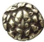
Abb. 22) Hekte, Samos, 6. Jh., 2,85g, 17mm.

den Kopf umgebenden Ornamente eine solche darstellen sollen. Das Einsetzen dieser Prägungen ist zeitlich bislang kaum näher bestimmt worden, es mag zwischen 620 und 590 liegen 84 .