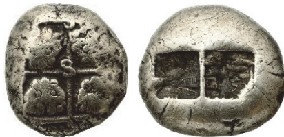
Abb. 40) Elektronrite, unbest. Mzst., 7./6. Jh., 4,64g, 13mm. Foto: Bibliothèque nationale de France, département Monnaies, médailles et antiques, Fonds général 19. Größe 2:1

der obere und untere zueinander ausgerichtet sind. Diese paarweise Anordnung zweier gleichartiger Köpfe verleiht dem Münzbild einen ornamentalen Charakter. Bildkompositionen wie diese lassen vermuten, dass es hier nicht um einen einzelnen Löwen ging, der in einer Nahbeziehung zu einer lokalen Gottheit stand, sondern dass der Löwe als Typus gemeint ist. Bei diesem Münzbild dürfte der dämonische Charakter des Löwen im Vordergrund zu stehen, der durch die Vervielfachung verstärkt wird 142 .