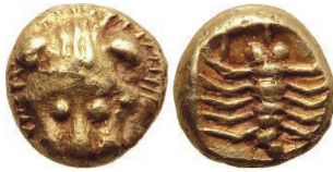
Abb. 14) Ionien, Milet, 1/48 Stater, Elektron, 6. Jh., 0,26 g, 5 mm. Größe 4:1

Mähne, dass es ihren Herausgebern hauptsächlich um den feurig-solaren Aspekt des Löwen gegangen sein muss, wie er beispielsweise auch in dem von Homer auf den Löwen bezogenen Adjektiv αἶθων (feurig, brennend) mitschwingt 48 .