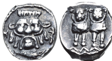
Abb. 44) Samaria, Obol, 401-380 155. 8,5 mm, 0,78 g 156. Größe 3:1