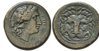
Abb. 20) Rhegion. 351-280, Bronze, 21mm, 6,82g.

Das für die unteritalische Stadt Rhegion charakteristische Münzbild wird fälschlicherweise oft als „Löwenmaske“ oder „Löwenkalp“ bezeichnet. In Wahrheit aber sehen wir hier eine besonders gelungene Nahaufnahme eines lebendigen Löwen. Kurioserweise war das Münzbild von Samos, wo es sich noch um eine augenlose Löwenmaske gehandelt hatte, das Vorbild für die Löwenmünzen von Rhegion 76 . Offenkundig war eine Anpassung an die lokalen Gegebenheiten unumgänglich: Rhegion beherbergte einen der wichtigsten Apollonkulte Unteritaliens – welchen Sinn hätte es gehabt, sein Begleittier in Form einer Jagdtrophäe zu zeigen?