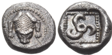
Abb. 9) Lykien, unbest. Prägestätte, unbest. Münzherr, Obol, ca. 450, 0,67g, 8mm. Größe 3:1

Geradezu charakteristisch war in dieser Zeit die Löwenmaske bereits für Lykien geworden, wo sie für eine Weile zum Hauptmünzbild der dynastischen Prägungen wurde. Ein möglicher Vorläufer entstand dort schon in der Mitte des 5. Jhs. Das nur in dem Exemplar der Slg. Denise Bérend bekannte Exemplar eines Obols (Abb. 9) zeigt den Vorderteil eines Löwen, von dem zu vermuten ist, dass er bereits ausgestopft ist, denn seine Augenhöhlen sind leer.