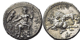
Abb. 54) Tarsos, Stater, Satrap Mazaios, 361-334, 10,81g, 22mm.

Nach Auskunft der genannten und hier gezeigten Münzbilder übte also der Anblick fressender Löwen einen besonderen Reiz auf ein antikes Publikum aus.