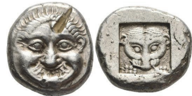
Abb. 37) Athen, Tetradrachme, ca. 525, 17,27 g, 25mm.

Damit ist der Übergang zu weiblichen Gottheiten vorbereitet, die durch (frontale) Löwen repräsentiert werden können. Die ersten attischen Tetradrachmen (oder auch: Di-Statere) verbinden zwei frontale Münzbilder miteinander: Das Gorgoneion füllt die Vorderseite aus, während das Quadratum Incusum mit dem Bild einer Löwin gefüllt ist, deren auf den unteren Bildrahmen gesetzten Tatzen suggerieren, dass sie den Betrachter anspringt (Abb. 37). Die kuriose Bildkombination ist auf der ersten Verständnisebene als Verbindung von zwei Wesen verständlich, deren tödlich-dämonischer Charakter wesentlich in ihrem Blick begründet liegt, der durch die übergroß dargestellten Augen zweifellos besonders hervorgehoben wird. Doch dies allein ist als Grund für die Wahl der Bilder kaum tragfähig. Während der direkte Polisbezug des Averses zumeist anerkannt wird 127 , scheint in der Numismatik bzgl. der Reversdeutung noch das Paradigma der „Wappmünzen“ zu gelten, wonach Löwin und Stierkopf (das zweite Reversmotiv dieser Münzen) als „persönliche“ Bilder von irgendwie Prägeverantwortlichen zu lesen seien.