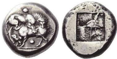
Abb. 47) Makedonien, Stagira, Tetradrachme, 520-500, 17,3g, 25mm. Foto: NAC (Auktion 52, 2009, 96)