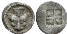
Abb. 51) Makedonien, Akanthos, Obol, 500-470, 0,37 g 163 , 6mm. Größe 3:1