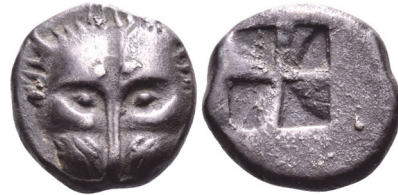
Abb. 18) Pantikapaion, 480-470. Tetrobol, 13mm, 2,94g. Foto: Nomos AG (Auktion obolos 28, 2023, 253).