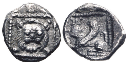
Abb. 43) Samaria, Obol, 401-380 154. 9 mm, 0,71 g. Größe 3:1

Wenngleich man einräumen muss, dass diese beiden Münzlein ideal als „Charonsobole“ geeignet gewesen wären, wird man kaum annehmen dürfen, dass darin der Grund für die Motivwahl gelegen hätte.