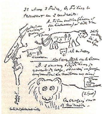
Abb. 1) Skizzen der Zeichnungen aus Trois Frères, Frankreich.

schen all diesen Stationen vermutet er ephemere Bildträger, deren Material und Wege sich allenfalls durch Zufälle noch rekonstruieren lassen 5 . Auch wenn man dieser Annahme nicht in jedem einzelnen Fall folgen möchte, steht fest: Der En-face-Löwe ist ein „vorgefundenes“ Münzbild – eines, das nicht neu erfunden werden musste, sondern nur noch im Münzrund (das anfangs auch ein Oval sein konnte) zu platzieren war. Ähnlich wie das wesentlich jüngere Gorgoneion existierte es lange vor der griechischen Kunst.