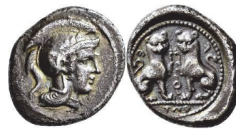
Abb. 30) Lykien, Stater, Whekessere II., Tlos, 400-380, 7,92g, 23mm.

Auch für den Dynasten Whekessere II. (ca. 400-390) scheinen Löwen von besonderer Bedeutung gewesen zu sein, denn sie zieren einen Großteil seines Prägeprogramms. Unter ihm begegnen häufiger in oben beschriebenem Sitzschema wiedergegebene Löwinnen, oft sogar in doppelter, antithetischer Anordnung (Abb. 19) 103 . Der Tatsache, dass diese Bilder fast ausschließlich mit Athenaköpfen gekoppelt sind, sollte keine zu hohe Bedeutung beigemessen werden. Eher scheint Athena für diesen Dynasten eine besondere Rolle gespielt zu haben, als dass man sie mit diesen Löwen in eine unmittelbare Beziehung setzen sollte 104 . Die symmetrische Anordnung der Löwen lässt in Verbindung mit der hieratischen Darstellungsweise das Prädikat „heraldisch“ treffend erscheinen, das Novella Vismara für die Bildbeschreibung verwendete. 105 Doch was genau soll es bedeuten? Sind die Löwen als „Wappentiere“ des Münzherrn zu verstehen, also reines Herr-