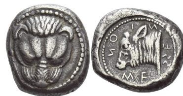
Abb. 6) Messina, Tetradrachme, 488/481, 17,32g, 25mm.

Allein das kampanische Kyme (Abb. 7) blieb dem Vorbild einigermaßen treu, präsentierte aber auf seltenen Didrachmen einen größeren Teil eines ausgestopften Löwen, der zudem mit Eberköpfen, also Teilen von tatsächlich auf der Apenninhalbinsel vorzufindenden Tieren, kombiniert