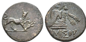
Abb. 59) Amisos, Messingnominal, 85-65, unter Mithridates VI., 4,2g, 18mm.