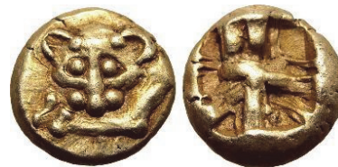
Abb. 56) Hemihekte nach lydisch-milesischem Fuß, unbest. Mzst., 7./6. Jh., 8mm, 1,11g.

Eine frühe Elektronhekete zeigt im Avers eine linkshin kauernde Großkatze, die den Betrachter mit den Augen fixiert (Abb. 55). Ihr Körper ist mit gepunzten Ringen versehen, sodass, auch aufgrund der fehlenden Stirnfurche, anzunehmen ist, dass es sich um das Bild eines Leoparden ( πάρδαλις ) handeln soll. Das Stück wird der lydischen Prägung zugeschrieben 167 . Dem Leoparden wurden ähnliche Fähigkeiten wie dem Löwen nachgesagt, insbesondere was seinen Blick betrifft, sodass die Darstellungsabsicht auch hier augenfällig ist 168 . Die Hekten und Hemihekten dieses