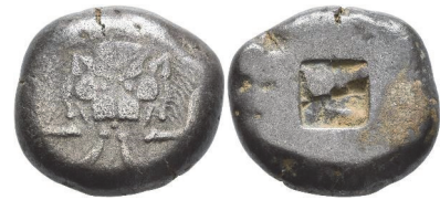
Abb. 33) Lesbos, Billon-Statere, 525-513, 13,99 g, 23 mm.

Die monströsen Züge (das eigenartige Gebilde am Maul sowie die Vervielfachung 121 des Löwen) sprechen dafür, dass eine Verbindung besteht zwischen dem Münzbild und dem Untier.