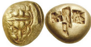
Abb. 11) Elektron-Stater nach lydisch-milesischem Fuß, Milet (?), 7./6. Jh., 14,17g, 23mm.

„funkelnden“ Blick, gefasst in ein Paar aus rautenförmigen Augen. Der Rest des Löwenkopfs ist kaum mehr als eine Skizze: Zwei starke Stirnwülste oben, seitlich strichartige Wangenknochen und zwei dick gepunktete Lefzen. Das Motiv und der Gewichtsstandard ließen manchen Numismatiker Milet als Prägestätte vermuten, und auch Hilbert, der sich zuletzt intensiv mit der milesischen Münzprägung befasst hat, hält dies für möglich, wenn auch nicht für vollkommen gesichert 42 .