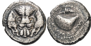
Abb. 7) Kampanien, Kyme, Didrachme, 420/390, 6,89g, 20mm. Foto: Peus Nachf. (Auktion 407, 2012, 42)

wurde. Hier wird zweifelsohne samnitischer Einfluss über die Bildwahl entschieden haben. Dieses Münzbild dürfte sich eher auf die konkreten Qualitäten der abgebildeten Tiere bezogen haben, vielleicht auch auf ein von ihnen hergeleitetes Abstraktum wie „Stärke“, nicht aber auf einen mythischen Jäger wie Herakles 39 .