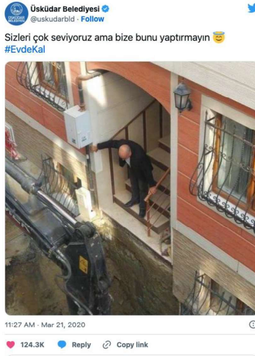
Görsel 1. Üsküdar Belediyesi Twitter hesabının paylaşımı

Haber içeriklerinde rastlanan diğer bir eğilim ise yaşlıları kurallara uymayan, yasakları delen, dolayısıyla bu davranışları nedeniyle kamu sağlığını da tehlikeye atan homojen bir grup olarak nitelendirmeleridir. Yukarıdaki örnekte ifade edildiği gibi, 65 yaş üstü yaşlıların tamamının -istisna olmaksızın- yasaklara uymadığı görülmektedir. Yasaklara uymayan bir toplumsal grup olarak yaşlılar sadece düzeni bozan bir grup olarak temsil edilmekle kalmayıp aynı zamanda makul düşünemeyen, eylemlerinin toplumsal sonuçlarını dikkate almayan, irrasyonel ve bencil bireyler olarak da anlaşılmaktadır. Pandemi döneminde medyada sıkça yer alan bu tür haberlerin özellikle yaşlılara karşı olumsuz eylemlerin gerekçesini oluşturduğunu varsayabiliriz. Toplumsal sorumluluk taşımadığı ve bencilce hareket ettiği düşünülen yaşlılara karşı özellikle gençler tarafından -nesiller arası çatışmanın bir örneği olarak yorumlanan- aşağılayıcı eylemlerin gerçekleştiği bilinmektedir. Dolayısıyla bu tür haber temsillerinin yaşlıların toplumdaki anlamlarını ve konumlarını da olumsuz etkilediği söylenebilmektedir.