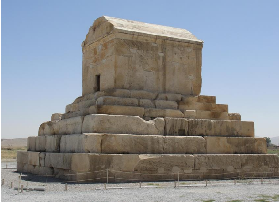
Resim-1: Büyük Kyros'un Anıt Mezarı

https://thesecondachilles.files.wordpress.com/2014/03/image26.jpg