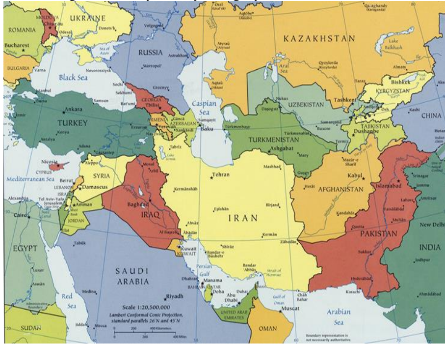
Harita-1: Bugünkü Orta Asya'nın Siyasi Coğrafyası

( http://www.maps-continents.com/caucasus-central-asia.htm )