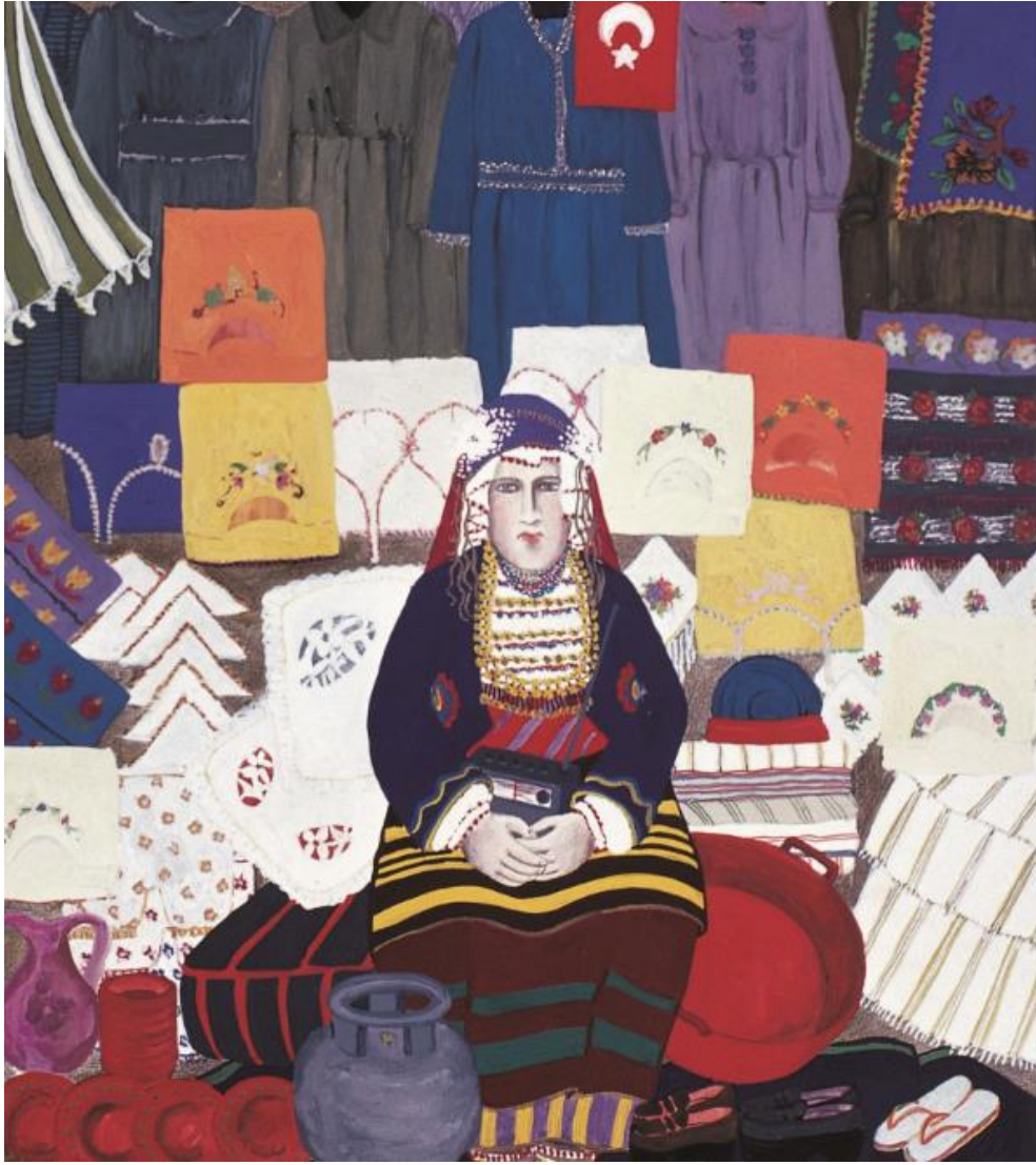
Görsel 7. Gülsün Karamustafa, "Kıymatlı Gelin", 43x30 cm, TÜYB, 1975.