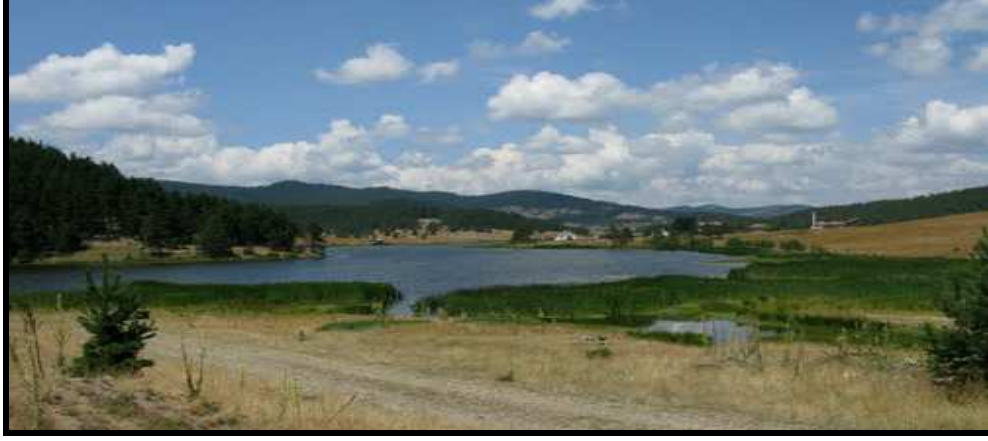
Şekil: 4. Son zamanlarda bozulmamış doğasını görmeye ve trekking yapmaya gelenlerin arttığı Eğriova Yaylası.

Eğriova yaylalar serisi doğa sporları için uygun ortamlar oluşturmanın yanında barındırdığı alana özgü bitki ve hayvan varlığı ile ilgi çekicidir. Yaylalar serisinin bulunduğu kesimler kış aylarında kar manzaraları, baharda çok zengin çiçek görüntüleri özellikle biyoloji-botanik ve fotoğraf çalışması için oldukça uygun fırsatlar sunmaktadır. Yaylalarda doğa yürüyüşleri için çeşitli yürüyüş hatları olanakları bulunduğu gibi, kampçılık için uygun ortam ve dağ bisikleti için uygun mekânlar barındırmaktadır.