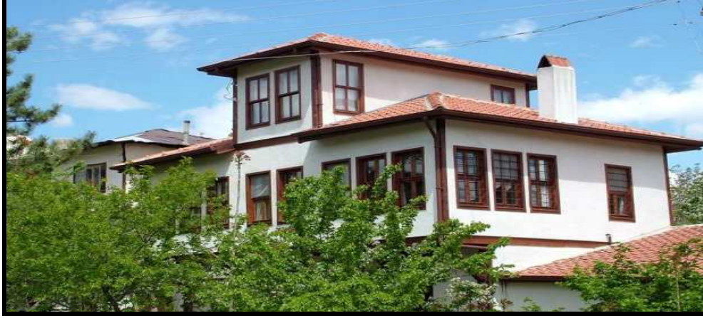
Şekil: 2. Beypazarı ilçesinde 3500 civarında geleneksel Türk mimarisini yansıtan konut bulunmaktadır.