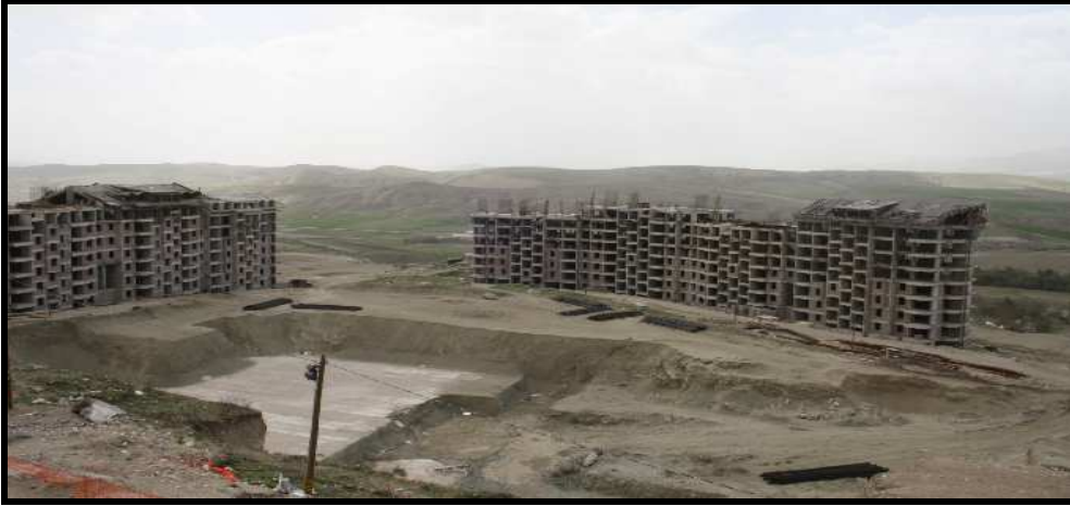
Şekil: 6. Beypazarı şehri Boztepe mevkiinde yapım aşamasında olan 1000 yatak kapasiteli Akropol termal tesisleri.

Beypazarı ilçesinde turizm çekiciliklerinden bir diğeri de Dereli köyünde bulunan volkanik arazide Süvari Çayı ve kollarıyla yüzey sularının aşındırmasıyla oluşmuş olan peri bacalarını andıran volkanik şekillerdir (Şekil: 7). Ayrıca Akçakavak köyündeki organik tarım ürünleri üretiminin yapılması da tarımsal turizm açısından bir cazibe oluşturmaktadır.