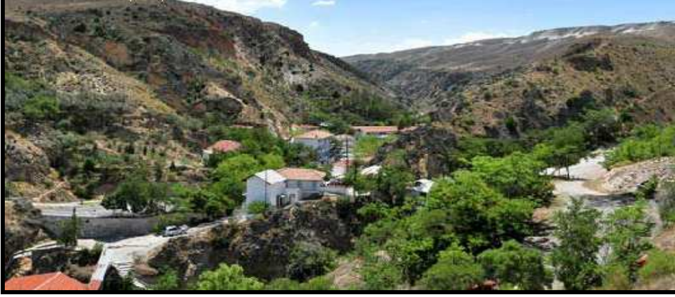
Şekil: 5. Dutlu – Tahtalı kaplıcası.

tesis belirtildiği özellikleriyle tamamlanırsa bu durum Beypazarı için oldukça önemli avantajlar ortaya çıkaracaktır.