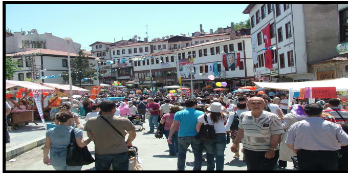
Şekil: 8. Beypazarı'nda genellikle turizm potansiyeli şehir ve yakın çevresiyle sınırlıdır.

Beypazarı ilçesinde turizm faaliyetleri gözlemleyebildiğimiz kadarıyla genellikle Beypazarı şehriyle sınırlı kalmaktadır. Hâlbuki ilçede alternatif turizm olanaklarına sahip ortamlar da bulunmaktadır. Son zamanlarda alternatif turizm arayışları ile birlikte ilçenin yaylalarında özellikle Eğriova yaylalar serisinde bir kırsal turizm faaliyeti gözlenmektedir. Ama alanın potansiyeli düşünüldüğünde bu katılımın yetersiz olduğu da bir diğer gerçektir. Bu bağlamda ilçede turizm potansiyelinin yalnızca şehir ve yakın çevresiyle sınırlı olmadığına farkına varılması ve buna uygun çalışmaların yapılmasıyla turizmin organize bir şekilde ilçe geneline yayılması gerekmektedir (Şekil: 8).