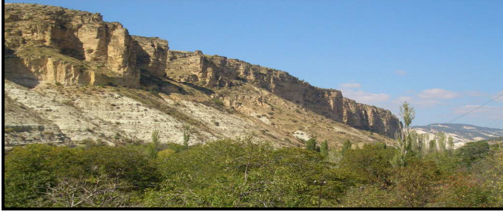
Şekil: 3. İnözü vadisi arkeolojik ve doğal sit alanı olarak koruma altına alınmıştır.

Yaylalar, göçebe ve yarı göçebelerle, köylerin ekonomik faaliyet alanıdır. Bu ekonomik faaliyetlerde hayvancılık önde gelmekle birlikte, tarımsal faaliyetler de yapılabilmektedir. Bunun yanında yaylalar, kasaba ve şehirlerde yaşayan insanların da sosyal amaçlar için kullandıkları ya da yararlandıkları, çıkılan veya gidilen yerdir (Somuncu, 2005: 24).