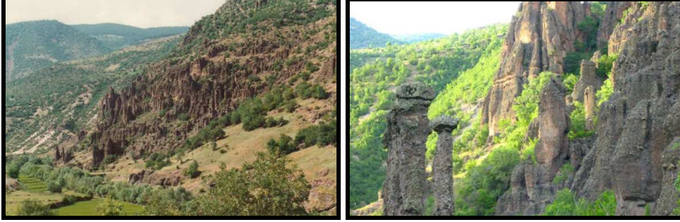
Şekil: 7. Dereli köyü yakınlarında yüzey sularının aşındırmasıyla oluşmuş olan volkanik şekiller.

Doğal ve kültürel değerler açısından çok çeşitli turizm kaynaklarına sahip olan Beypazarı, gerek günübirlik gerekse daha uzun süreli konaklanabilecek ve farklı turizm olanakları (yayla turizmi, kültür turizmi, sağlık turizmi, kırsal turizm gibi) sunan bir ilçedir. Ankara ve İstanbul için kolaylıkla ulaşım imkânı olan Beypazarı, kültür turizmi açısından uygun konumda bulunmaktadır. Özellikle Ankara için günübirlik ulaşım imkânı olan Beypazarı, kent halkı için günlük yaşamdan uzaklaşarak tarihi kent dokusu içinde rekreasyonel ihtiyaçların karşılandığı bir merkez konumuna ulaşmıştır. Ekonomik olarak Beypazarı'nda turizm yakın bir zamanda başlamış olup kısa zamanda pansiyon, kafeterya ve otantik restoranlar açılmasına rağmen yeterli düzeye ulaşamamıştır. Bu nedenle mevcut turizm potansiyeli tam olarak değerlendirilememektedir. Bu amaçla Beypazarı'na gelen ziyaretçilere ulaşım, konaklama, yeme-içme, eğlenme, alışveriş gibi çeşitli imkânların planlı bir şekilde sunulması gerekmektedir.