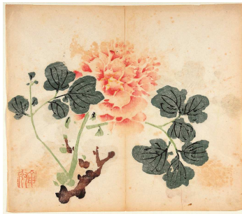
Şekil 2. "The Ten Bamboo Hall" isimli kitabın iç sayfalarından görüntü (XVII. Yy.)

Çin'de yüzlerce yıl birçok olağanüstü kitap basılmıştır. Çin'de yazılan ve basılan kitaplar ancak XVII. yüzyıldan sonra renklendirilmeye başlanmıştır. "The Ten Bamboo Hall" ve "Mustand Seed Garden" adlı kitaplarda görülen, kuş, bitki ve çiçekler sanatçılar için elle nasıl baskı yapıldığına ilişkin örnekleri içeren en orijinal eserlerdir (Akan, 2000).