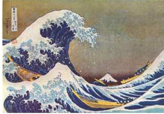
Şekil 4-5. “Ukiyo-e” Sanatından örnek çalışmalar.