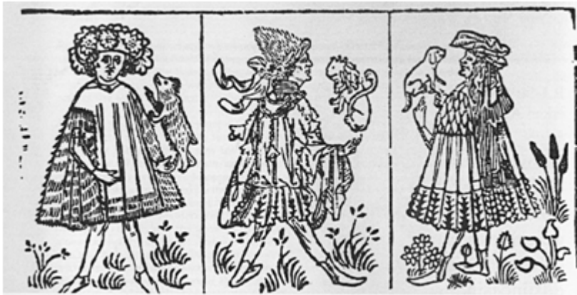
Şekil 7. Avrupa'da yüksek baskı tekniğiyle hazırlanmış oyun kâğıtları (1460'lar)

XIV. yüzyılın ana motifi Hz. İsa'nın hiddet ve kin dolu yüz ifadelerini yansıtan baskılar olmuştur. Baskılarda kaybolan incelik gözleri yorar. Avrupa'da, İtalya'da büyük formatlı basılı at ve mihrap resimleri kilise duvarlarında ve duvar süslemelerinde kullanılmıştır. Bunun yanında sayıca az da olsa dini olmayan resimler de üretilmiştir. Örneğin; oyun kartlarında, astrolojik tasarımlarda XIV. yüzyılda basılan baskılar genellikle yöresel karakterler taşımaktadır. Oyun kartları XIII. yüzyılda burjuva sınıfı tarafından çok benimsenmiştir. XIV. yüzyılda kâğıdın Avrupa'da yaygın bir şekilde kullanılmaya başlanılıp kâğıt maliyetlerinin düşmeye başlamasıyla birlikte oyun kartları en yoğun baskı seviyesine yükselmiştir. Bundan sonra burjuvanın yanı sıra orta gelirli halk arasında da hızla yayılan oyun kartlarının yapımı sonraki yıllarda yasaklanmış olmasına rağmen, Alman askerlerinin aracılığı ile oyun kartları, İtalya ve Fransa'da geniş halk kitlelerinin arasında hızla yayılmıştır. O dönemde yapılan kartların dekoratif özellikleri bugün az da olsa kullanılmaktadır (Akalan, 2000).