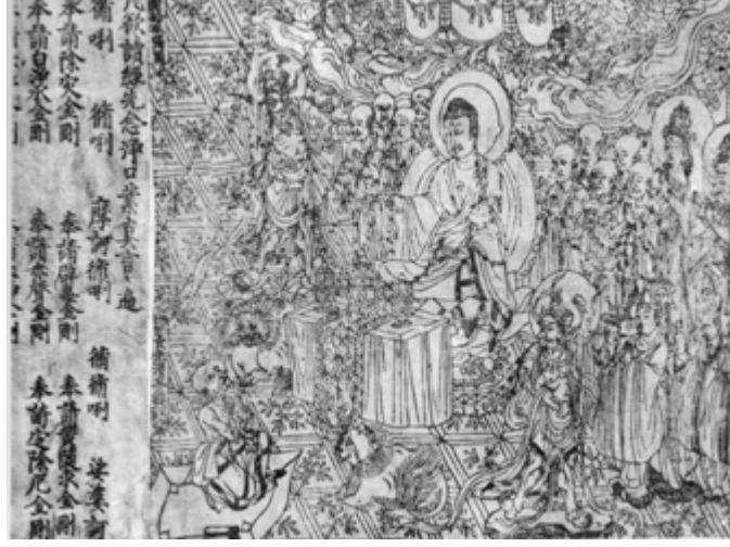
Şekil 1. İlk basılmış kitap olarak bilinen Elmas Sutra (Diamont Sutra)'dan bir sayfa

Literatüre geçmiş diğer önemli bir eser de; M.S. 869 tarihli Wang Çieh tarafından Çin'de basılan, Elmas Sutra (Diamont Sutra) adlı rulo kitaptır. Bu kitap, Sanskritçe'dir ve "Diamond Sutra Öğretisi" konuludur. Özdeyiş biçiminde hazırlanmış metinlere sutra adı verilir. Bu karmaşık figürlü ve metinli çalışma, 1900 yılında Taoist bir papaz tarafından Türkistan'da bir mağarada bulunmasıyla ortaya çıkmıştır. Budizm'i anlatan ağaç bir bloktan basılan bu kitap, Batı'da "Block book" (tahta baskı kitap) olarak literatüre geçmiştir (Göncü, 1985).