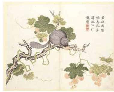
Şekil 3. "Mustand Seed Garden" isimli kitabın iç sayfalarından görüntü (XVII. Yy.)