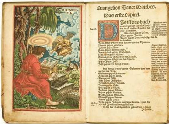
Şekil 14. Lucas Granach tarafından hazırlanan İncili (XVI. Yüzyıl)

Tahta baskı tekniği özellikle illüstratif kitaplarda fazlaca kullanılmıştır. İlk tipografik basılmış kitaplarda paragraf başına gelen süslü harf kısımları sonradan elle yapılmak üzere boş bırakılmıştı. 1400'den sonra Johann Fust ve Peter Schoeffer bu tür süslü başlık harflerini dini kitaplarda iki metal kalıp ile renkli olarak basmıştır. İlk illüstratif kitap 1461 yılında Albrecht Pfister tarafından basılmıştır. Sanatçı çalışmalarında illüstrasyon gelecek yerleri sonradan tahta baskı tekniği ile basmak üzere boş bırakmıştır. 1462'den sonra Pfister, yazı ile resmi aynı anda basmayı başarmıştır.