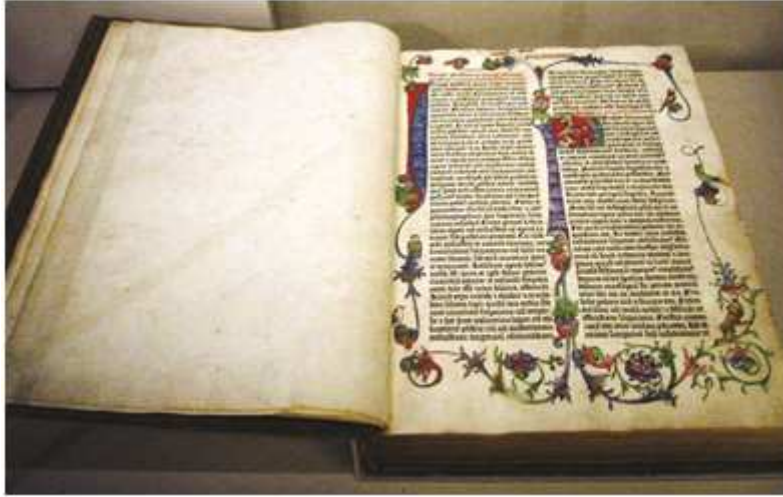
Şekil 11. Johan Gutenberg ve ortakları tarafından hazırlanıp basılan İncil’den bir sayfa.

“Alman asıllı Johan Gutenberg, 1430 yılında bir kuyumcu yanında oyma işlerinde çalışırken hayatına yeni bir yön verecek olan fikri ortaya koyma imkânı arıyordu. Bu fikir ayrı ayrı harf şekillerini yan yana getirerek sayfa yapmak, bir sayfayı bastıktan sonra dağıtılacak harfleri yeni sayfaların düzenlenmesinde tekrar kullanmaktı” (Evliyagil, 1972). Gutenberg bu fikrini ortaya koyabilmek için çok çalışmış, hatta bu amaca ulaşmak için üç ortaklı bir işletme kurmuştu. “Daha sonra yıllarca denemeler yapan Gutenberg 1450’de bir kitabın tipografi tekniği ile basılabilmesine imkân sağlayan sistemi buldu” (Becer, 1997). İlk baskı çalışanları Gutenberg ve ortakları Johann Fust ile Peter Schöffer tarafından İncil üzerine olmuştur.” (Özer, 1995).