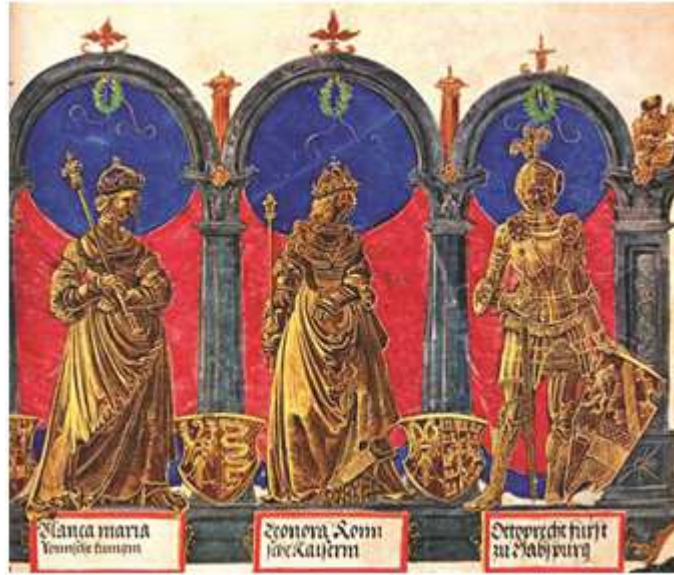
Şekil 10. Albrecht Altdorfer tarafından hazırlanan "Triumphzug Kaiser Maximilians" adlı çalışmadan ayrıntı (1513-1515).

XVI. yüzyılın ilk yarısında tahta baskıda, özellikle Hans Holbein'in eserlerinde görüldüğü gibi, çizgi sayısı dolayısı ile de baskı kalitesi yüksek seviyeye çıkmıştır. Tahta baskıcılar XV. yüzyılın sonlarında gelişen bakır baskı tekniğine yakın neticeler almak için çabalayarak ince ve detaylı sonuca ulaşmaya çalışmaktadır. XVI. yüzyılda hem minyatür gibi küçük hem de freskler kadar büyük formlarda baskılar yapıyordu. Büyük formattaki baskılar birçok baskının bir araya gelmesinden oluşmaktadır. Albrecht Altdorfer tarafından 1513-1515 yılları arasında yapılan "Triumphzug Kaiser Maximilians" 138 farklı baskı kalıbından oluşmuştur. Tiziano, boyutları 1,3x2,8 m. olup 12 tablodan oluşan "Untergang Des Phavaos" isimli büyük bir baskı yapmıştır. Bunun yanında Hans Holbein 5x6,5 cm. boyutlarında küçük tahta baskılar yapmıştır. Bütün bu mücadeleye rağmen zaman içinde bakır baskı tahta baskının yerini almış, teknik sonraki zamanlarda sadece yöresel eserlerde ya da sanatçılar tarafından ifade aracı olarak kullanılmıştır.