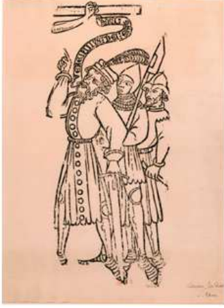
Şekil 6. “Bois-Protat” adlı eser

XIV. yüzyılın ana motifi Hz. İsa'nın hiddet ve kin dolu yüz ifadelerini yansıtan baskılar olmuştur. Baskılarda kaybolan incelik gözleri yorar. Avrupa'da, İtalya'da büyük formatlı basılı at ve mihrap resimleri kilise duvarlarında ve duvar süslemelerinde kullanılmıştır. Bunun yanında sayıca az da olsa dini olmayan resimler de üretilmiştir. Örneğin; oyun kartlarında, astrolojik tasarımlarda XIV. yüzyılda basılan baskılar genellikle yöresel karakterler taşımaktadır. Oyun kartları XIII. yüzyılda burjuva sınıfı tarafından çok benimsenmiştir. XIV. yüzyılda kâğıdın Avrupa'da yaygın bir şekilde kullanılmaya başlanılıp kâğıt maliyetlerinin düşmeye başlamasıyla birlikte oyun kartları en yoğun baskı seviyesine yükselmiştir. Bundan sonra burjuvanın yanı sıra orta gelirli halk arasında da hızla yayılan oyun kartlarının yapımı sonraki yıllarda yasaklanmış olmasına rağmen, Alman askerlerinin aracılığı ile oyun kartları, İtalya ve Fransa'da geniş halk kitlelerinin arasında hızla yayılmıştır. O dönemde yapılan kartların dekoratif özellikleri bugün az da olsa kullanılmaktadır (Akalan, 2000).