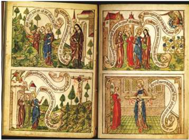
Şekil 15. Canticum canticorum, blockbook (1465)

Batı Dünyası'nın basılmış en eski kitapları olan "blok kitaplar", illüstrasyon ve yazı kısmı ağaç baskı tekniğiyle hazırlanan kitaplardır. Bu döneme ait bilinen blok kitaplarda tarih yoktur. 1430 ile 1470 yılları arasında hazırlandığı tahmin edilmektedir. Tipografik unsurlarla basılan kitaplardan daha önceki yıllarda hazırlanan blok kitaplar başta Almanya olmak üzere birçok Kuzey Avrupa ülkesinde basılmıştır. Fransa ve İtalya'da baskı kitaplar ender olarak görülmektedir. En eski kitaplardaki illüstrasyonlar tahta baskı tekniği ile basılmış, yazı ilave olarak sonradan yazılmış veya yanına yapıştırılmıştır. Daha sonraları yazı, kompozisyonların içinde veya yanında yer almıştır. Tek taraflı basılan baskılar arka yüzlerinden kitaba yapıştırılmıştır. Bu kitaplar anopistografik blok kitaplar diye isimlendirilmiştir. 1450'den sonra kâğıdın çift tarafına yağlı boya ile baskı yapılmış ve opisthografische blok kitapları diye isimlendirilmişlerdir. Daha sonraları kitaplara tipografik döküm harflerle hazırlanıp basılan yazılar yapıştırılmıştır. Bu kitaplara typoxylografische blok kitaplar denmiştir. Bunlar normal dizgiyle basılan illüstratif kitaplara geçiş aşamasını oluştururlar. İllüstratif kitapların çoğunda resim yazıya oranla daha çok kullanılmıştır. Tahminen 33 değişik blok kitap mevcuttur. Bu kitapların büyük bir çoğunluğu dini içeriklidir (Mitchell, 1964).