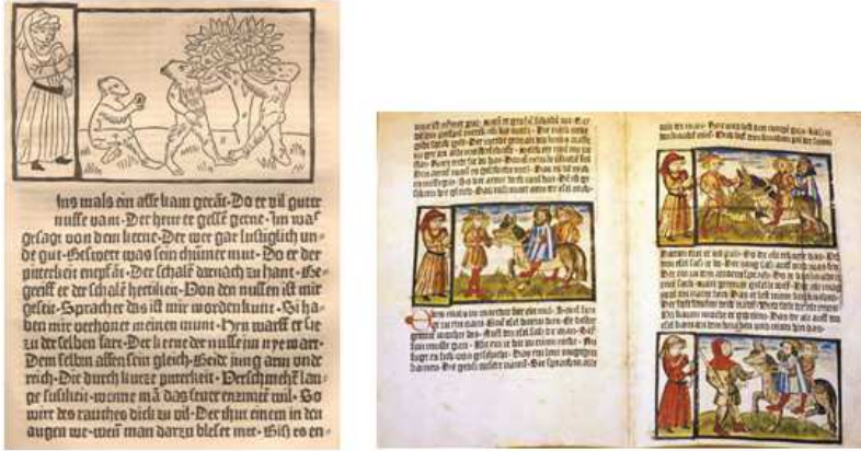
Şekil 12-13. Albrecht Pfister tarafından tarafından basılan ilk illüstratif kitapların iç sayfalarından görüntüler.

Ahşap baskı tekniği, Gustave Dore'nin resimlediği Dante'nin Kutsal Komedyası'ndan sonra, resimli gezi ve edebiyat kitaplarıyla baskı sanatlarında büyük aşama kazandı (Erzen, 1983).