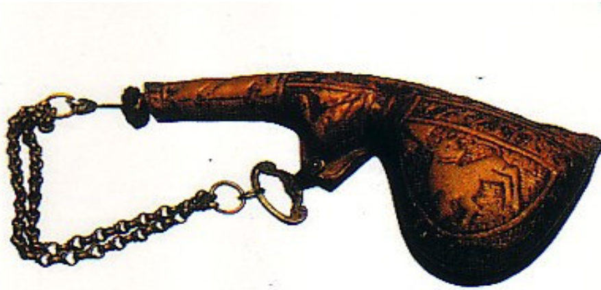
Şekil 8. Gön Koleksiyonundan; üzeri hayvan motifli barutluk (Sakaoğlu ve Akbayar, 2002: 136)