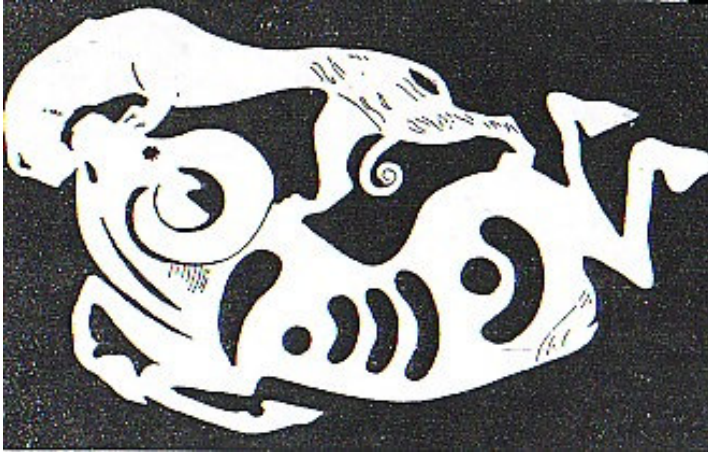
Şekil 1. Birinci Pazırık kurganından çıkarılan deriden yapılmış bir eyer örtüsünde kaplanın bir dađ koyununa saldırıř sahnesi (Diyarbakirli, 1972: 82)

Hunlar, ustalıklı işledikleri deriyi boyayıp; günlük gereksinimlerine göre biçimlendirdikten sonra , geometrik motifler ya da bozkır kültürünün sanatında yoğun olarak görülen hayvan figürleriyle süslenmişlerdir. Hayvan figürleri farklı renklerde boyanmış deri yüzeyler üzerine yapıřtırılmış ya da dikilmiştir. Hayvan figürleri, (hayvan mücadele sahneleri) en çok deri eyer apliklerinde görülmektedir (Şekil 1ve 2). (Gargı, 2000: 24). Orta Asya'da kemer, çizme, çanta gibi deri aksesuarlar, bozkır yaşantısına uygun biçimde yapılmıştır. Bu aksesuarlar üzerinde hayvan figürleri, geometrik ve bitkisel motifler işlenmiştir