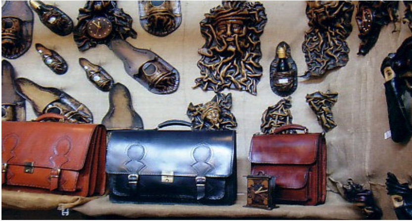
Şekil 13. Günümüzde yapılan deri ürün çeşitleri

Ayrıca deri ürünler, fonksiyonelliğinin yanı sıra göz zevkine hitap etmesi, doğal malzemelerle yapılması, el emeği özelliği taşıması ve fabrikasyon üretimin bol ve ucuz pazarlanan ürünlerine göre çok daha az üretilmesi, modern eşyalarla da uyum sağlaması gibi nedenlerle pek çok kullanım alanı bulunan ve tercih edilen ürünlerdir. Bu ürünler, çanta, kemer, takı, pano, çerçeve, sigaralık, anahtarlık, saksı altı, vazo , minder v.b. gibi çok çeşitli ürünlerden oluşmaktadır. (Şekil 14).