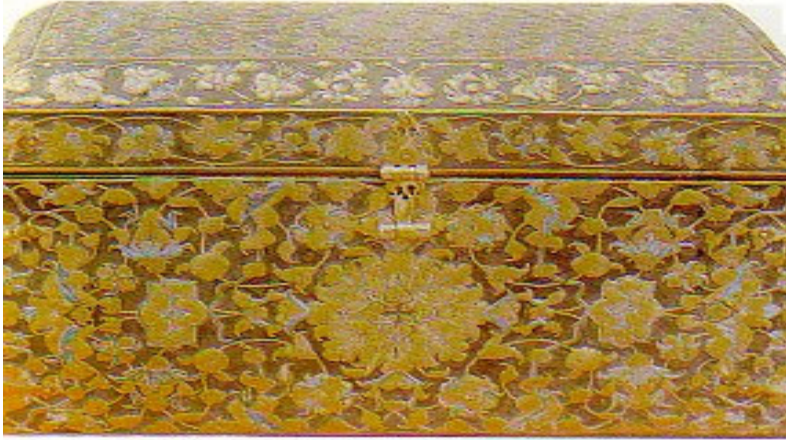
Şekil 10. Siyah deri üzerine ipek iplik ve altın tellerle işlenmiş sandık (Delibaş, 1989: 6)

Topkapı Müzesi'nde, harem dairesindeki ocaklı sofada yer alan büyük sandıklar, (Şekil 10) gezi eşyalarının içine konduğu hurçlar da görülmeye değer ürünlerdir.