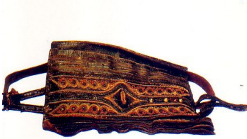
Şekil 7. Gön Koleksiyonundan; işlemeli silahlık (Sakaoğlu ve Akbayar, 2002: 189)

Osmanlı Döneminde deri, askeri eşya ve aksesuarlarda çok kullanılmıştır. Osmanlı Dönemi silahlarından kılıcın içine konulduğu kınların ahşap veya metalden yapıldıklarını ancak, dış yüzeylerinin hava ve neme dayanıklı bir deri ile kaplandığı belirtilmektedir. Deri, Osmanlı'nın kullandığı bir diğer silah olan sapanda da işlevsel kılınmıştır. Aynı şekilde okların içine konuldukları kandil, okluk veya kuburlarda da deriden yararlanılmıştır. (Eralp, 1993).