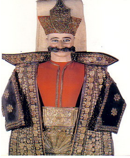
Şekil 9. İstanbul Askeri Müzesinde bulunan saka kıyafeti

Topkapı Müzesi'ndeki, Sultan Murat'ın, deriden yapılmış olan içi ve yalnız kenarları kürklü kaftanları hayli görkemlidir. Bundan başka Askeri müzede bulunan madeni işlemeli saka giysileri de dikkâti çeker özellikler taşımaktadır (Şekil 9)