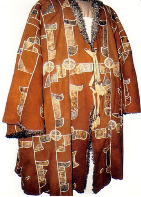
Şekil 4. Topkapı sarayı Müzesinde bulunan kürklü yüzü içte, deri yüzü doğal boyalarla boyanmış padişaha ait kaftan (Sakaoğlu ve Akbayar, 2002: 188)

Osmanlılar döneminde altın çağını yaşamış olan deri sanatı, özellikle saray atölyelerinde, saray için üretilen deri örneklerinde üstün başarı göstermiştir. İnce işçilik ve güzel süslemeleri ile dikkati çeken bu örnekler, kitap kapları, hurçlar, değişik sandıklar, kaseler, giyim eşyası, kalkanlar, eyer ve at koşum takımları, kesici alet kılıfları, kapı perdeleri, karagöz figürleri, kemerler, çantalar v.b. gibi eserlerdir. (Şekil 4, 5). Osmanlı döneminden günümüze ulaşan ve her biri ayrı bir sanat haline gelen ciltler, kültür ve sanat değeri açısından kalıcı ve anlamlı belgelerdir.