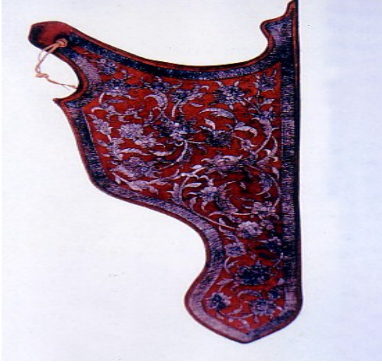
Şekil 11. Ponzan Ulusal Müzesinde bulunan, 17.yy., Deri üzerine işlemeli Osmanlı sada (Sakaoğlu ve Akbayar, 2002: 178)

İstanbul Türk İslam Müzesi'ndeki deri ciltler de ayrı birer örneklerdir. (Şekil 12). Ayrıca Ankara Etnoğrafya Müzesi'nde bulunan deriden yapılmış, renkleriyle ilgi çeken su kapları ve altın sırmalarla süslenmiş vezir çantaları da o dönemin deri sanatının önemli örneklerini oluşturmaktadırlar. Manisa Müzesi'nde de görülmeye değer özellikle bir deri kalkan ve yine deriden yapılmış işlemeli askılı kahve tepsisi vardır. Yazılı belgelerden anlaşıldığı gibi, Anadolu, deri işlemeciliğinde yüzyıllar boyunca önemli bir merkez kimliğini sürekli taşımıştır.