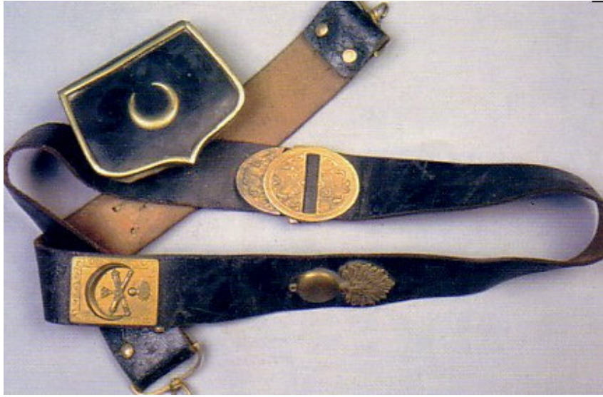
Şekil 6. İstanbul Askeri Müzesinde bulunan deri kütüklük ve kemeri

Askeri Müze’de sergilenen eşyalar arasında ise ; kale kapılarının büyük hacimdeki anahtarlarını koymaya yarayan deriden yapılmış büyük mahfazalar, davul ve trampetlerin kılıfları, kalkanlar, arka çantaları, zenbiller, önlükler, maşrapalar, su kırbaları, yeniçeri mantoları, silah kılıfları, kütüklük, barutluk ve fişeklikler (Şekil 6,7,8) deriden yapılan önemli ürünlerdir.