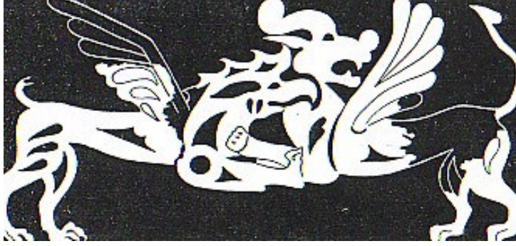
Şekil 2 . Birinci Pazırık kurganından çıkarılan deriden yapılmış bir eyer örtüsünde kartal ve arslan grifonların mücadele sahnesi (Diyarbakırlı, 1972: 82)

Orta Asya'da derinin kullanım alanları çok çeşitlidir. Bu alanlardan biri olan ayakkabılar; Türk kültür tarihinde Orta Asya'dan başlayarak çeşitlenmiş ve değişik adlarla anılmıştır. Orta Asya'da başta çizme olmak üzere çarık, edük-etik, başmak gibi ayakkabı türleri giyilmiştir. (Şekil 3) Bu dönemi anlatan kaynak ve resimlerden çizmelerin geometrik ve stilize motiflerle, dikiş ve işleme teknikleriyle, Hun aristokratlarına ait kurganlardan çıkartılan buluntulara göre; altın ve gümüş sırmalarla işlenerek yapıldığı görülmektedir.