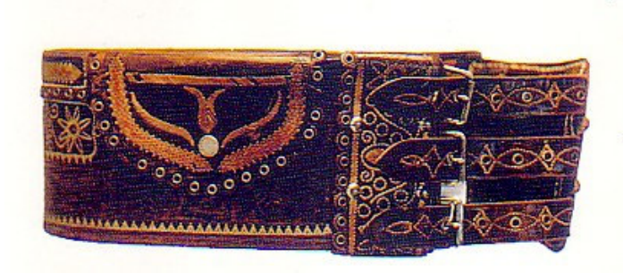
Şekil 5. Gön koleksiyonundan; 20yy.başı, üzeri işlemeli kalın bayan kemeri (Sakaoğlu ve Akbayar, 2002)

Askeri Müze’de sergilenen eşyalar arasında ise ; kale kapılarının büyük hacimdeki anahtarlarını koymaya yarayan deriden yapılmış büyük mahfazalar, davul ve trampetlerin kılıfları, kalkanlar, arka çantaları, zenbiller, önlükler, maşrapalar, su kırbaları, yeniçeri mantoları, silah kılıfları, kütüklük, barutluk ve fişeklikler (Şekil 6,7,8) deriden yapılan önemli ürünlerdir.