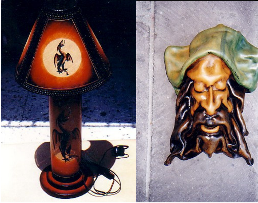
Şekil 14. Günümüzde yapılan deri ürün çeşitlerinden örnekler