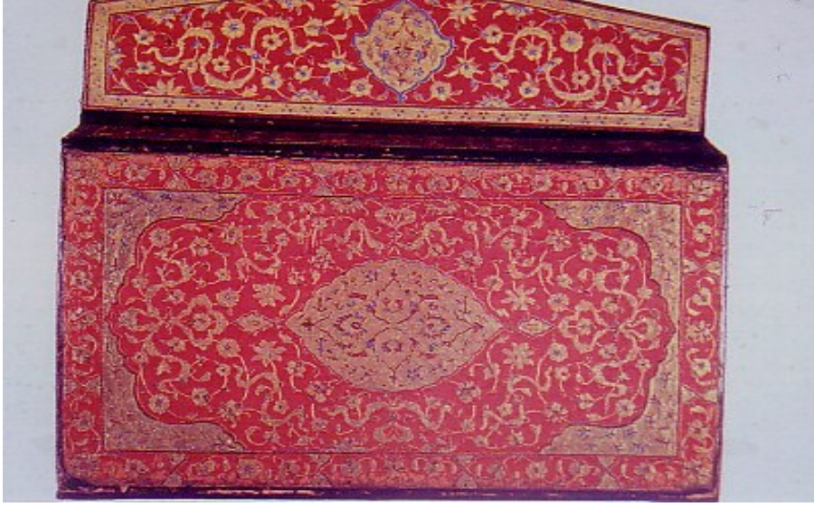
Şekil 12. Osmanlı kitap cildi ((Sakaoğlu ve Akbayar, 2002: 198)