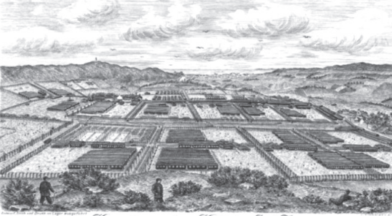
Kriegesgefangenenlager Knockaloe, Insel Man.

Osmanlı vatandaşlarının İngiltere tarafından esir alınarak Hindistan, Burma ve Mısır'da bulunan kamplara gönderilmesi üzerine Osmanlı Devleti de kendi topraklarında bulunan İngiliz sivilleri, esir almaya başlamıştı. Esirler, başta İzmir olmak üzere Afyon, Kastamonu, Niğde, Merzifon ve Şam'da kurulan kamplara yerleştirilmişti. Sivil esirler, savaşın doğrudan tarafı olan ya da cephede savaşan kişiler olmadıkları için çoğu zaman esir edilmelerini tepkiyle karşılamıştı. Kendilerine haksızlık edildiğini düşünen esirler, sürekli olarak tarafsız ülke temsilciliklerine kendilerini kurtarmaları için girişimlerde bulunmuştu. Hatta içlerinde bazı hastalar, tedavilerinin devamı için ülkesine gitmek istemiş ancak olağanüstü şartlar mevcut olduğu için istekleri savaş sonrasına kalmıştı. 5 Savaş sırasında İstanbul'da İngiltere'yi Felemenk Krallığı (Hollanda) temsil etmekteydi İngiltere adına diplomatik girişimleri Felemenkli diplomatlar yürütmekteydi.